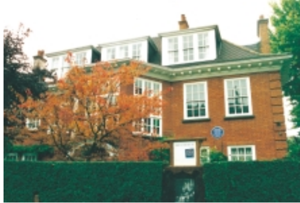
佛洛伊德博物館外觀。

此一書房，除了裝滿了書籍之外，也擺滿了佛洛伊德的收藏品，表現出他特殊的審美品味。經過大致的瀏覽，他的收藏品主要來自希臘、羅馬時代、埃及以及東