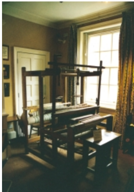
安娜·佛洛伊德所收藏的古老織布機。