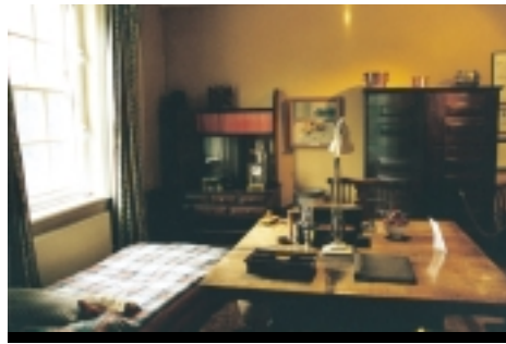
安娜·佛洛伊德的書房一隅。

遠望佛洛伊德的故居博物館，隱藏在十月的涼風習習的悠然環境之中，輕輕搖動的樹林裡在陽光裡款擺，早秋的落葉隨風舞動，讓參觀者沐浴在一種靜定而古雅的氣氛裡。我不禁想到，是如此悠然的環境，造就了此一位在人類歷史上的重量級智者，還是自古以來的聰慧之士，原本就鍾情於山林，樂於徜徉在自然裡，尋求那深不可測的靈感……。