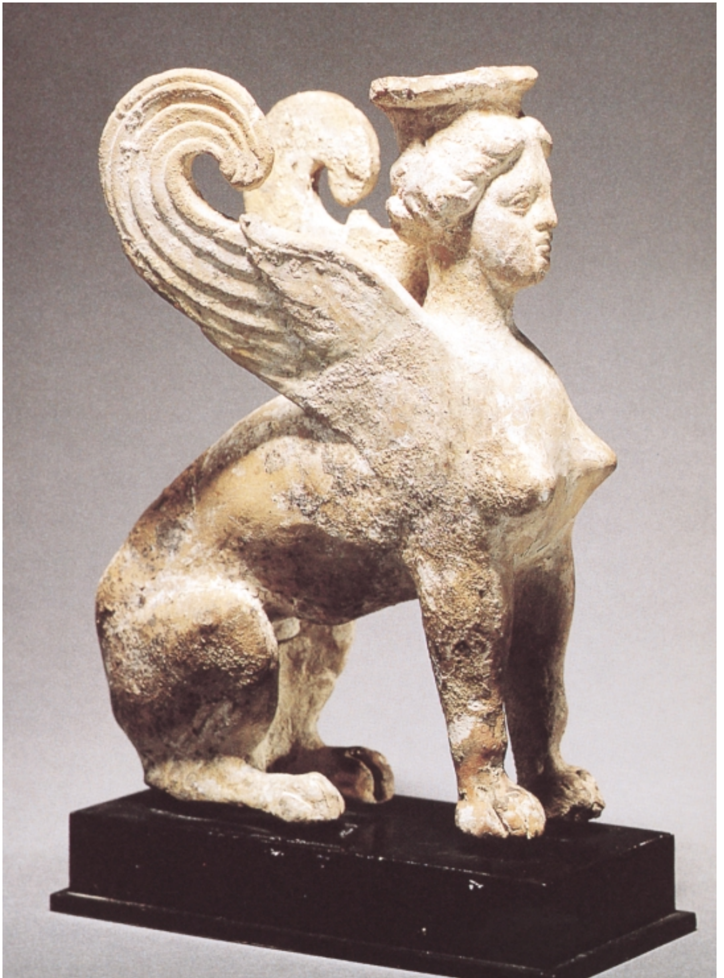
史芬克斯陶塑，希臘時期，四世紀早期（佛洛伊德收藏）