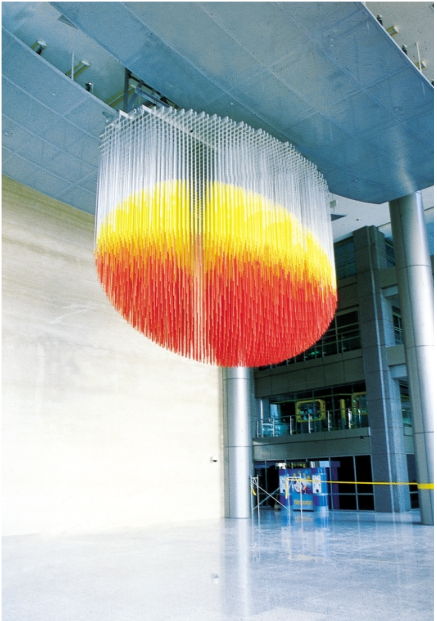
2 Artwork for Taipei (中國石油公司總部大樓) / Jesus R. Soto