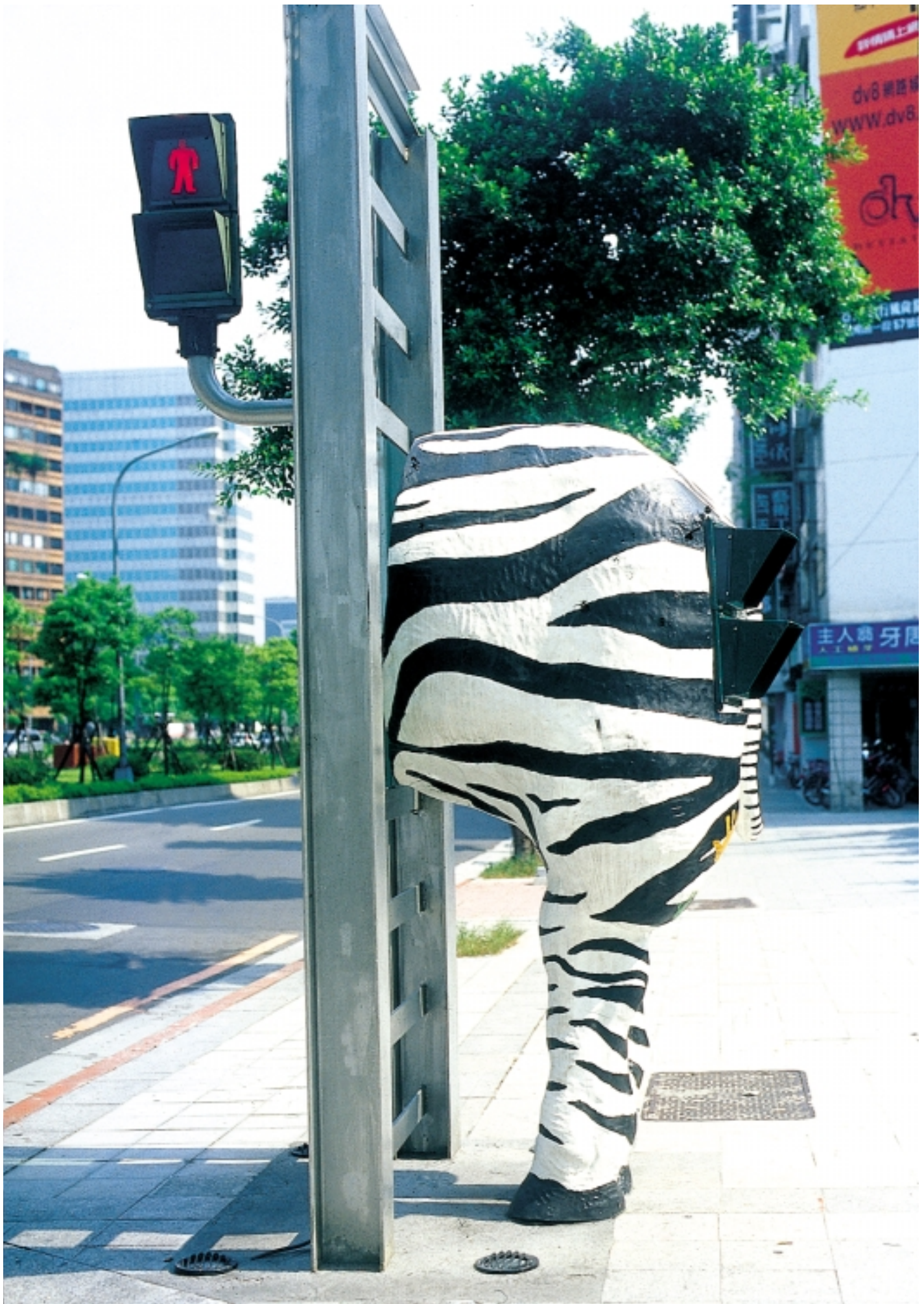
1 時間斑馬線（敦化藝術通廊） / 黃中宇