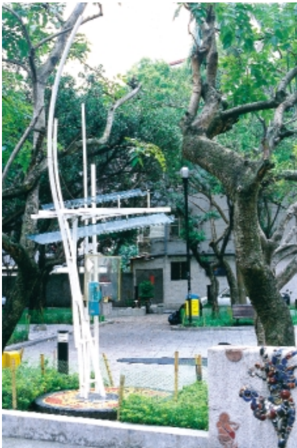
3 藝術電話亭－葉（永康公園） / 佾所設計工程顧問有限公司 （黃健敏攝）