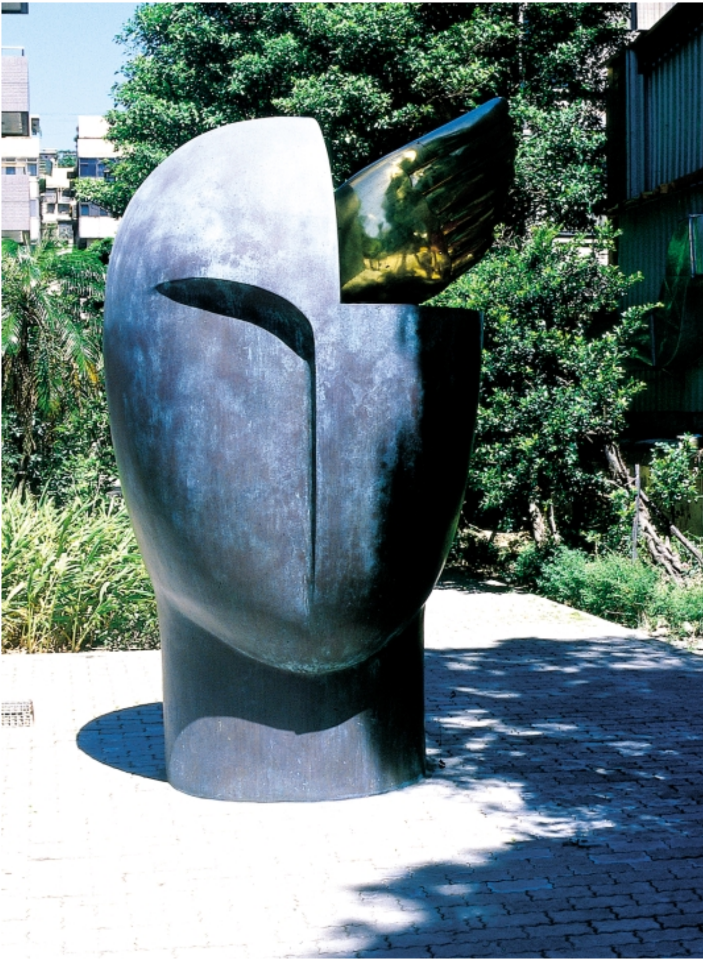
10 翔（行政院公務人力發展中心）／林正仁