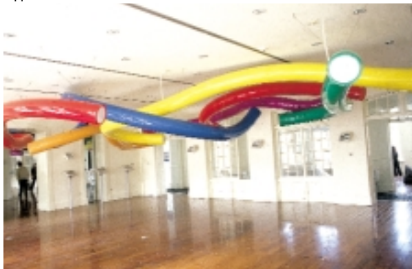
11 女武神與時間廊（市民大道）/ 聶振平