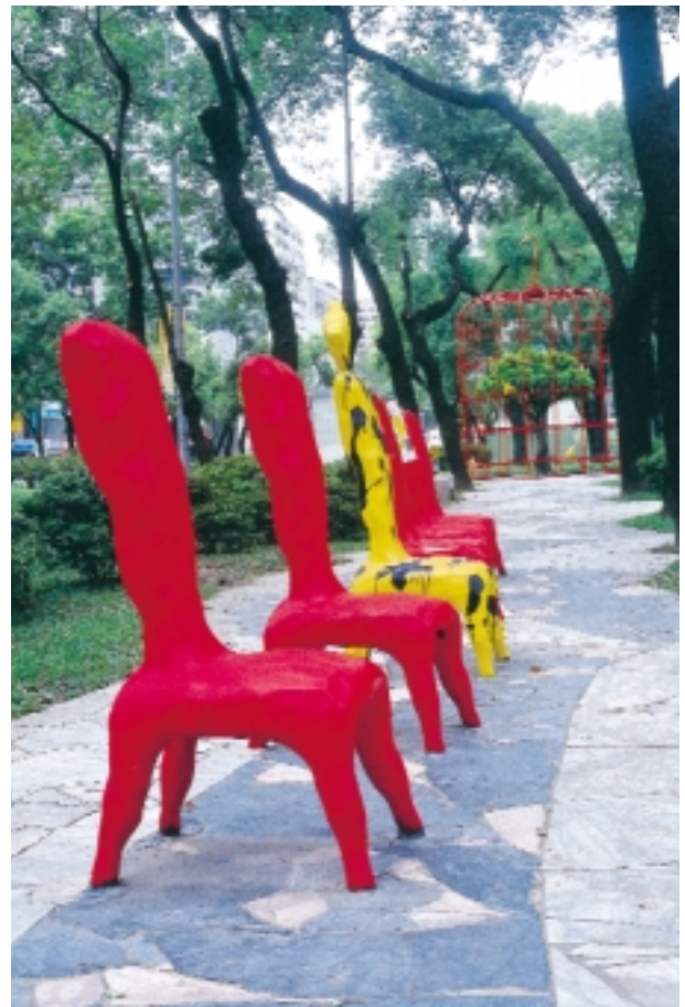
4 鳥籠外的花園（敦化藝術通廊） / 徐秀美