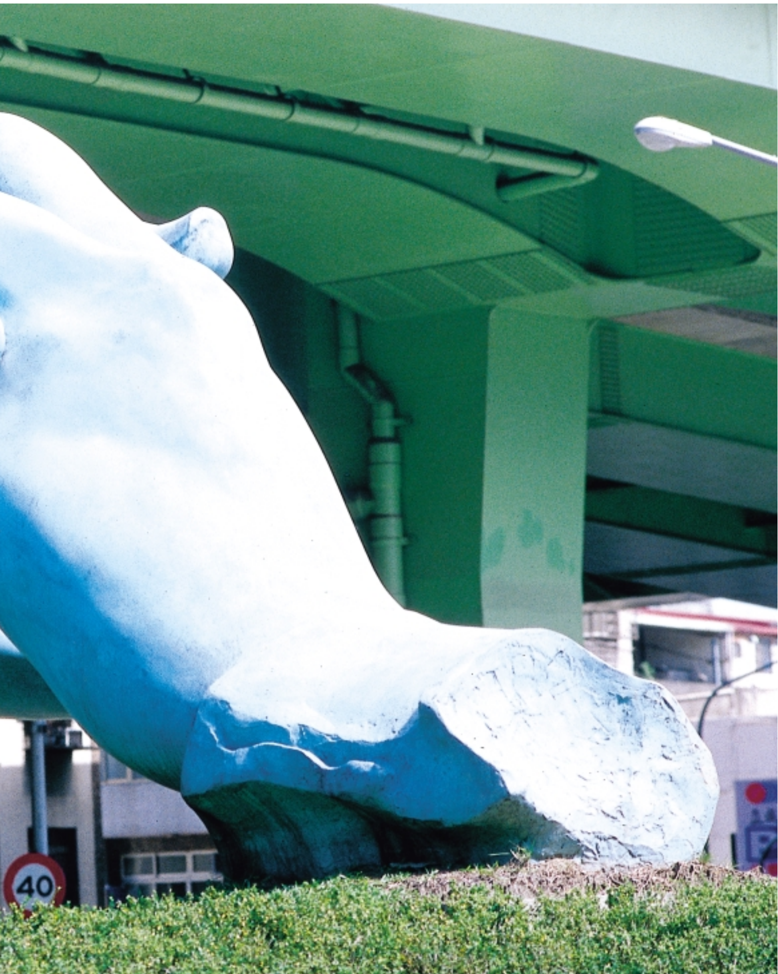
9 合（市民大道）/ 李光裕