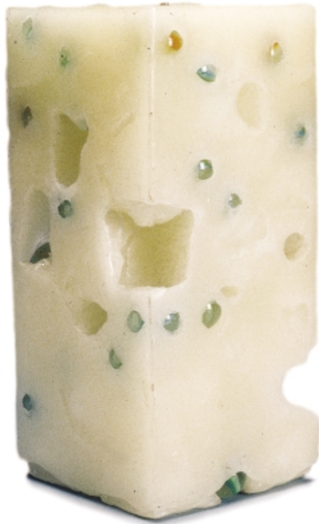
歷史博物館舉辦的阿曼展活動中由學生完成之作品。