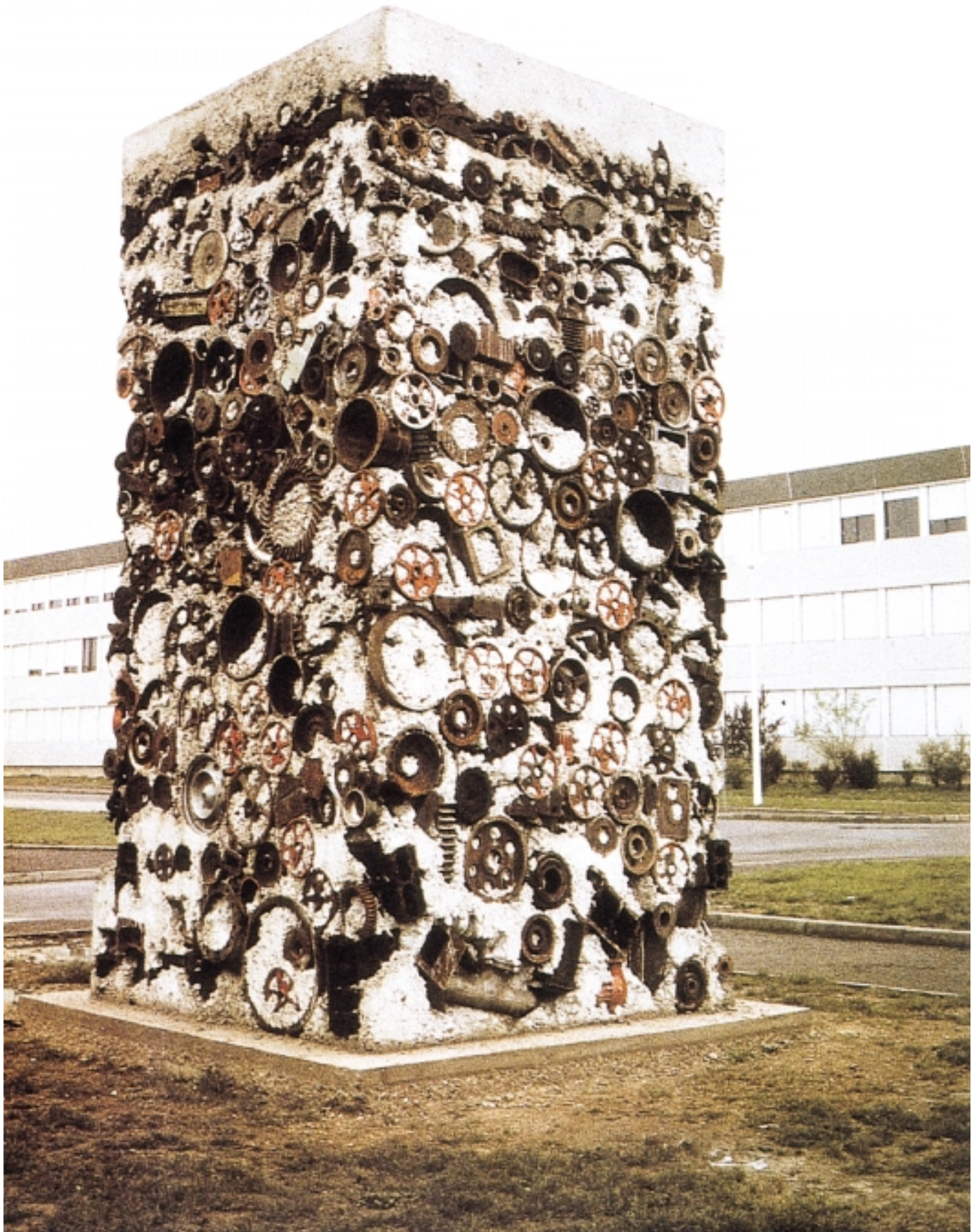
阿曼 Mechanical Fossil 1974 機械零件排列灌注混凝土