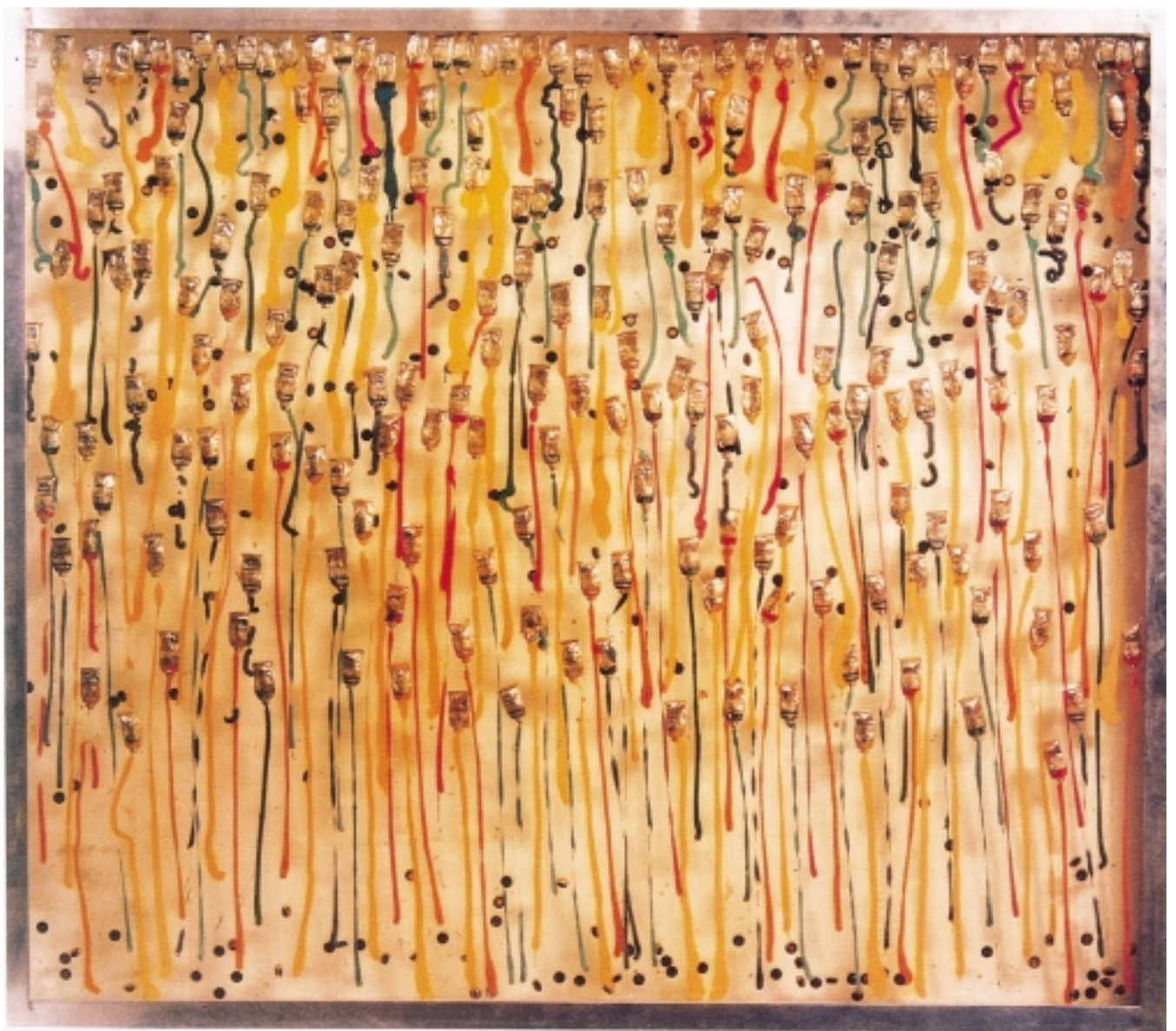
阿曼 Bonbons Anglais 1966 擠壓顏料管置於壓力盒內灌注多元脂樹脂

八十二年九月公佈並於民國八十五年全面實施至民國九十年的國民小學美勞科教學課程標準，其中規定國民小學應設置美勞科專用教室，專用教室裡有關雕塑教學應有的硬體教具與軟體教具，包括雕塑用的黏土、陶土、瓷土、紙黏土、人工土、石頭（軟石）、磚瓦、木材等，用具則須備有貯藏用缸、黏土板、黏土篾、麵棒及雕塑工具等；軟體設備包括立體造型與作法、塑造種類與作法、雕刻種類及作法等書籍、幻燈片或掛圖等。由其所列的硬體教具，可發現它是非常單一化。當學生在校外教學活動，參觀美術館展出的現代或當代雕塑時就無法產生共鳴；若教師想要增加設