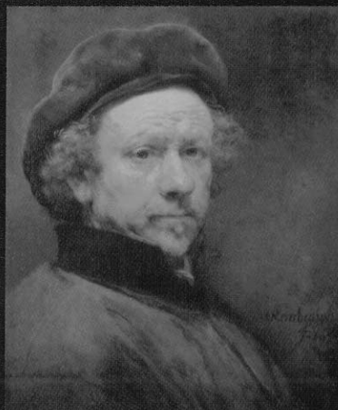
·戴著貝雷帽的自畫像，一六五九年作。