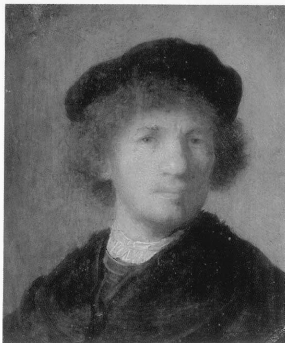
· 林布蘭特自畫像，一六三〇年作。

荷 蘭的藝術大師林布蘭特是最具影響力的十七世紀歐洲畫家之一，也是最具世界性知名度，最為人熟悉的西方藝術家之一；根據學者統計，在他的一生中至少創作超過七十幅的自畫像。不像許多歷史上的英雄人物或藝術家往往只留下極其少量制式化的肖像畫，我們很難從單調的少數一兩幅畫像中窺見昔人真正身影，然而林布蘭特可謂是藝術史上的特例，自年輕時期開始，他就偏愛以自畫像的形式，做為創作的題材，一幅幅講述著他生命的傳奇，人世的滄桑。