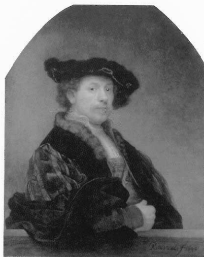
· 林布蘭特自畫像，一六四〇年作。

在一六三一年，林布蘭特移居阿姆斯特丹，成為頗富盛名的人物畫家，肖像畫的訂購應接不暇，名譽與財富接踵而來。此時他完成了包括荷蘭東印度公司總督菲利普·魯卡茲(Philips Lucasz)等著名的肖像作品。