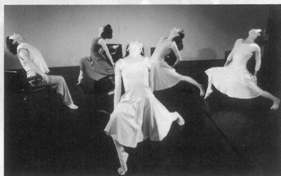
《在邊界前後左右》 演出單位：舞蹈空間舞團 演出舞碼：「房間」(Rooms) 編舞者：安娜·索克羅 (Anna Sokolow)