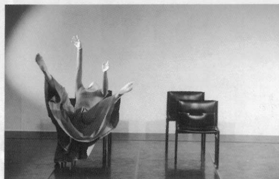
《在邊界前後左右》 演出單位：舞蹈空間舞團 演出舞碼：「房間」(Rooms) 編舞者：安娜·索克羅 (Anna Sokolow)