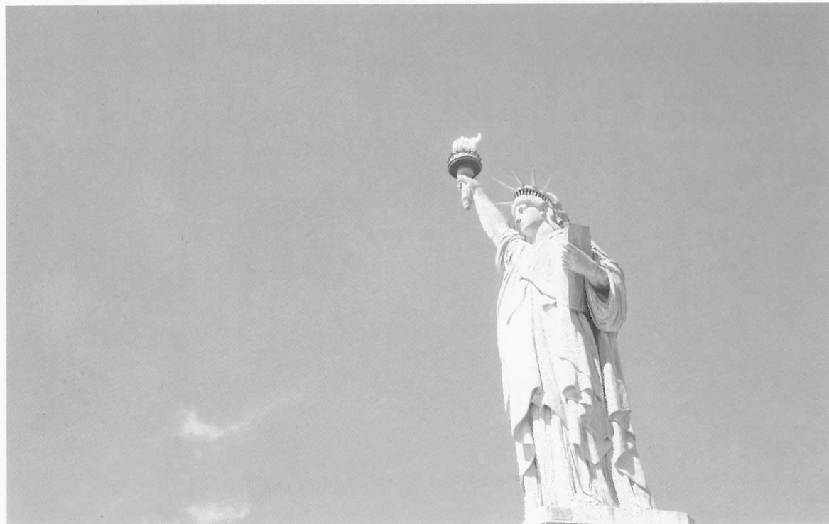
位於紐約港自由島 (Liberty Island)，自由女神像 (Statue of Liberty)，青銅，高46公尺。