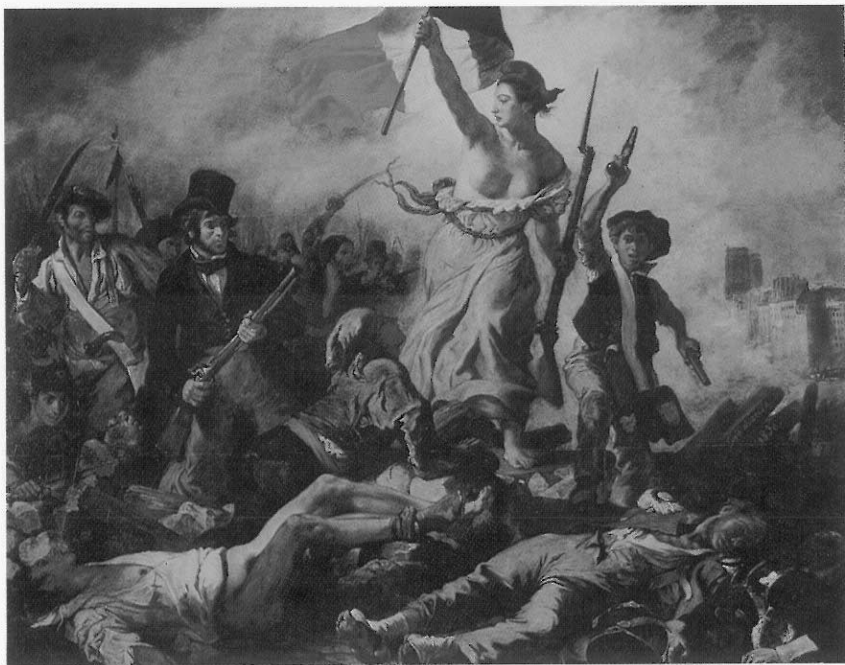
德拉克洛瓦 (Delacroix 1798-1863) 「自由帶領人民」 (Liberty Leading the People) 260×325公分 1830年。

話稱她為耐吉 (Nike)；羅馬神話則叫她維多莉亞 (Victoria)。耐吉是提坦族 (Titans) 的帕拉斯 (Pallas) 和俄科阿諾斯 (Oceanus) 與特提斯 (Thetis) 之女絲蒂克絲 (Styx) 的兩人相愛結晶。耐吉的眾家姐妹們，尚有：具熱情與競爭的化身的澤洛絲 (Zellus)、代表強健的克刺托絲以及力量的代言人比亞等諸神，是個具健康、樂觀與希望的家族。後因絲蒂克絲曾率其女兒諸神們，協助宙斯揭竿起義，革了宙斯老爸克羅洛及同胞的命，推翻了提坦族，使宙斯榮登諸神之王的寶座，故與絲蒂克絲宙斯長居奧林匹斯山。