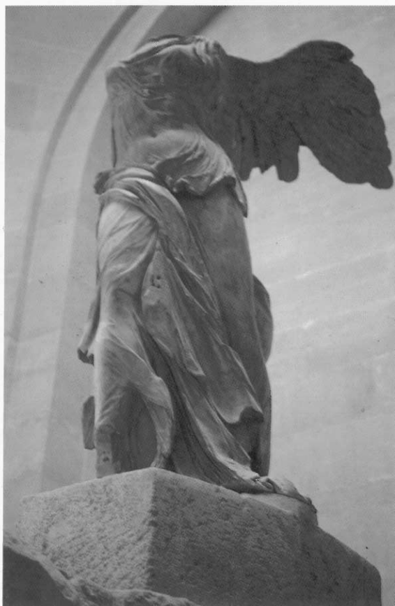
薩摩特拉的勝利女神 (Nike of Samothrace 190B.C.)， 1863年發現於薩摩特拉島，大理石，高275公分。

從 羅浮宮金字塔頂下的大廳，沿著南翼樓，拾級而上來到了專以典藏義大利文藝復興時期繪畫和古代希臘雕像著名的「德儂館」(Pavillon Denon)。進入「德儂館」，仰觀樓梯間，在遠處，有一座振翼飛翔，婆婆體態有如姍然飄下的凌波仙子雕像—「勝利女神」。此堪稱是一座完美秀麗，質地剔透，具理想美典型的大理石雕像。她靜謐佇立於船首，高高迎風而來，薄薄的衣裳，隨風飄盪，玲瓏曲線的美麗身材隱