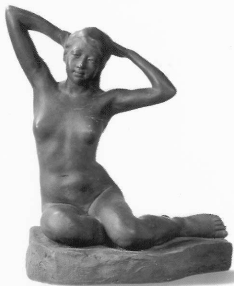
結髮裸婦 黃土水 約1929 石膏 53x46x30cm