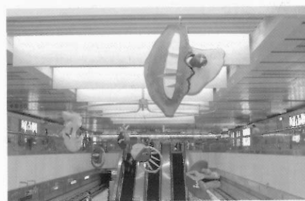
邂逅 李長發、曾英棟 1998 樹脂、 防火漆