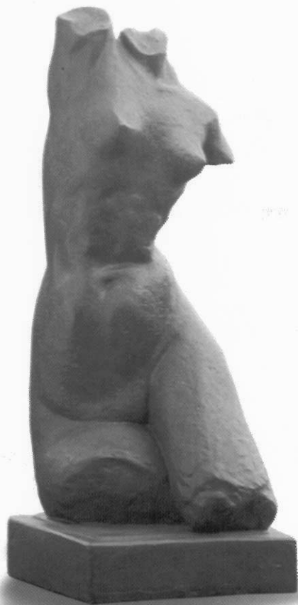
淨 楊英風 1958 銅 138x52x52cm

有機抽象造型的雕塑作品，在六〇年代開始成爲雕塑家創作的題材。它的造型是來自將人體或自然生物形體加以簡化變形，成渾厚圓潤造型，觀賞者可在形體