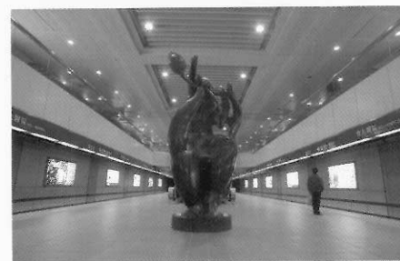
蓮花持 李光裕 1998 銅 159x194x400cm