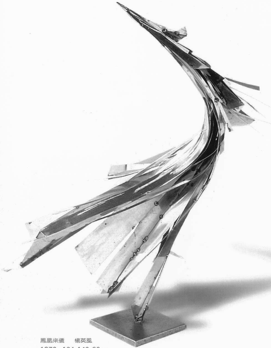
鳳凰來儀 楊英風 1970 104x140x90cm

塑教育政策；也涉及到臺灣從農業社會、工業社會到科技社會的經濟狀況與國民所得等等；同時也與美術館成立和各美術館推動的藝術類型有諸多密切的關聯。拋開歷史，並不意味就與史無關；而是將雕塑史的脈絡潛藏在風格中來探討。臺灣雕塑造型從日據時代雕塑家創造具象裸體像、民間風情、人物肖像；國民政府遷臺後，寫實中具有理想化政治人物雕像；而六〇年代的有機抽象，八〇年代的幾何抽象與極限藝術；以至解嚴後，雕塑藝術不但包涵過去創作的題材、風格，同時也新添了批判性、觀念性極強，並以新的展現手法呈現的裝置藝術。雕塑藝術風貌在近十多年來快速形成，對欣賞者人口也遽增的臺灣觀眾，所造成的困擾是不知如何去欣賞。觀賞者那形式主義的審美觀，也常將觀念藝術所重視的創作歷程給予忽略，將創作者對社會、文化、生態環境、甚至具政治性的批判性語言給消音了，留下的是對藝術形式美的懷念，對藝術是什麼的困惑，對藝術是反映時代精神的不適應症。欣賞者若無法體驗現代性的意義和了解現代性的精神，當然也就無法欣賞現代雕塑的藝術性。