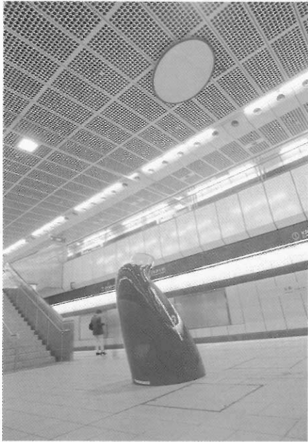
以管窺天 陳健、蔡淑瑩 1999 玻璃纖維、投影機、攝影機、銀幕