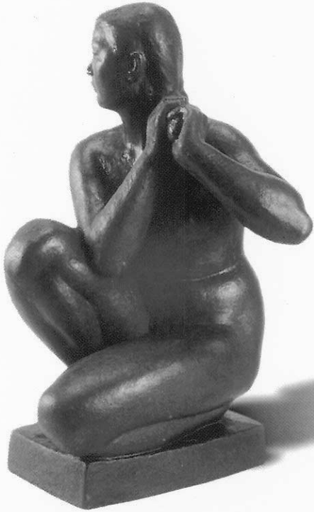
裸女之二 陳夏雨 1948 青銅 31x18x18cm (臺北市立美術館館藏)

接受日本雕塑藝術教育的臺灣雕刻家，所創作的女性裸體像大多屬於以具象造型，來表現女性內在生命張力。當然每位雕塑家也都有其個人的表現手法，例如黃土水的《甘露水》表現手法是藉著逐漸上揚的造型傳遞出生命的提升；此外，他的《擺姿勢的女人》(1922)，陳夏雨的《裸婦》(1948)與蒲添生的《春之光》(1958)則有異曲同工之妙，在豐實的軀體流露渾厚的生命力。然而，這異曲同工之妙，也使得初始學習欣賞雕塑的人，不再深入體驗藝術家個別的風格與表現手法之差異性。