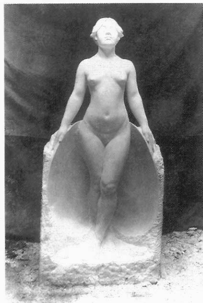
甘露水 黃土水 1919 大理石雕 入選第三屆帝展