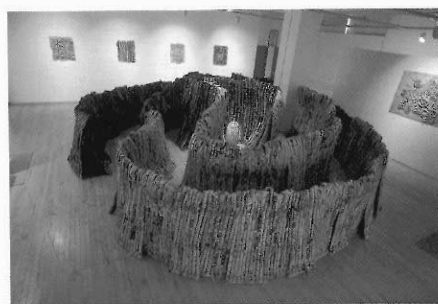
指紋迷宮 鄭亦欣 1998 4x3.5x1.7m (鄭亦欣提供)

欣賞複合媒材藝術必須能了解，藝術家對各類藝術形式與媒材語言的掌握能力，以及對呈現作品空間和展現方式的敏銳處理。此類的作品，創作技法並不僅是完成作品必須具有的能力，它還具備著詮釋作品意義的功能之一。如何讓不同特質的媒材在一件作品中達成互動的能量，藝術家是必須具備有對材料語言的特殊敏感度，以及對每一類媒材運用何種表現技法方能完成創作內容的知能。但是，於此必須強調的是，並不是這類創作型的藝術家就比運用單一媒材的藝術家能力強；而應當說，當藝術家認為這樣的藝術形式與媒材運用，方能傳達其想表現的藝術情感與理想時，就會選擇這類的藝術形