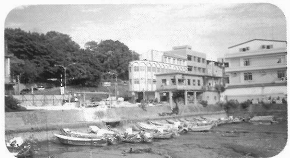
圖12 乾涸的漁港 「漁港已不再使用，不再進行貿易，但卻成為觀光勝地。不過它已快走入歷史了。」(陳書樵 圖文)