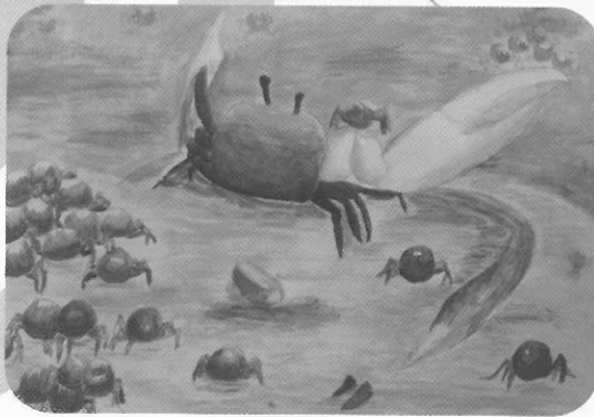
圖5 招潮蟹 張煒晨 水彩畫 38x55cm