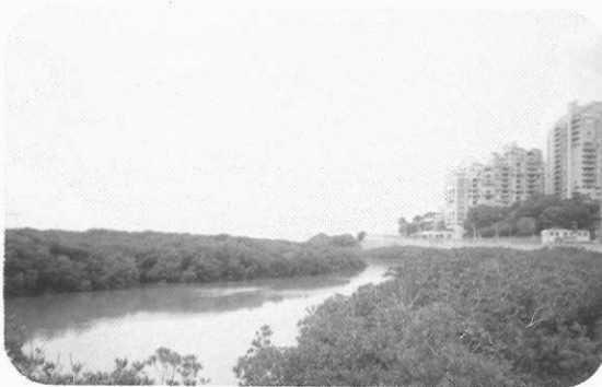
圖7 淡水河邊的紅樹林