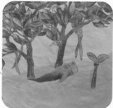
圖6 水筆仔與彈塗魚 岳彥 水墨 30x30cm