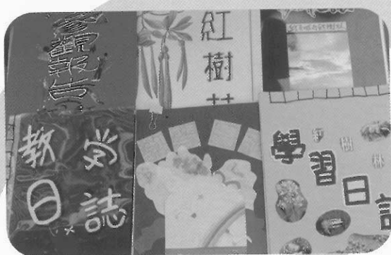
圖1 心得報告封面設計