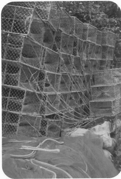
圖9 捕漁工具：漁網