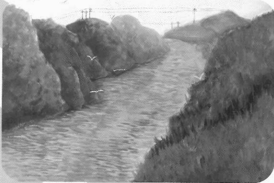
圖3 流向大海 陳鈺雯 水彩畫 38x55cm