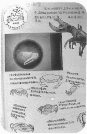
圖2 心得報告：招潮蟹研究 陳宜莓撰(部份)

面功夫好玩的參觀一下，並沒有非常仔細的來給它研究，但，今天我終於了解在淡水還有這一座雄壯堅固的堡壘，還有一段偉大的故事，三〇〇年前的戰場，三〇〇年後的偉大遺蹟，我們一定會努力愛惜這歷經世間萬千的一級古蹟!!