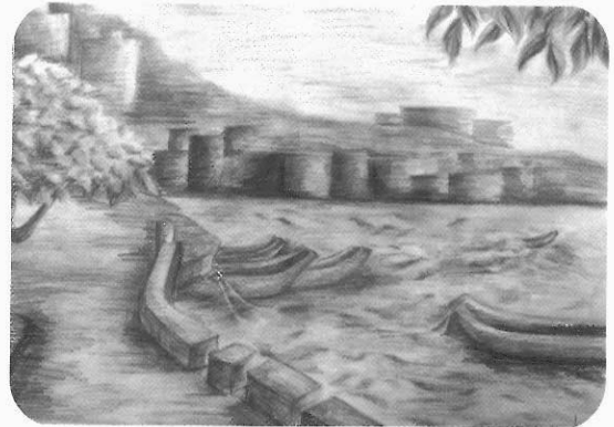
圖4 淡水河邊 Angela 鉛筆素描 38x55cm