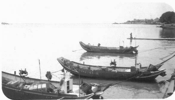
圖11 漁船 「這幾艘漁船可用來捕魚，不過大都只能捕到吻仔魚。捕到後用大電扇風乾。」(陳書樵 圖文)