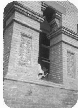
圖8 紅毛城之領事館廊柱上的雕花