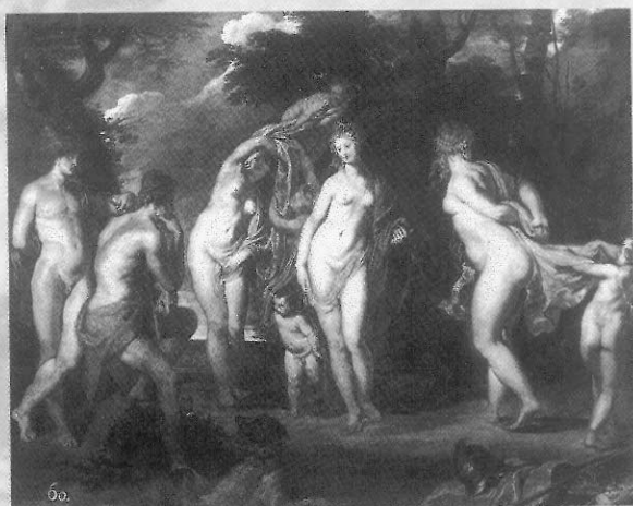
魯本斯 帕里斯的審判 油畫 1602 馬德里普拉多美術館藏

麗的妻子照顧下，過著美滿幸福家庭生活。之後，魯本斯的藝術不再只是受人委託創作，而是為了喜悅而畫畫。在開朗、自在的創作條件下，加上年輕貌美的少妻，激發出他對豐富、健康女性裸體的興趣、靈感及無限的創作慾，故成功地以海倫為模特兒，畫出無數的精采關於神話內容的大作。一六三二至一六三五年又舊題新畫「帕里斯的審判」。這一次構圖上，魯本斯略作調整，三位女神安排於中左處面向右方，手持金蘋果的帕里斯坐於石塊上，凝神諦視著三女神，後方樹下有漢密斯，魯本斯在安特衛普別墅所禽養的孔雀也躍登畫上。中景的牧羊和遠方的風景，古典般的靜逸暗示著作品深邃的空間。而不和女神艾莉斯，正在樹梢雲端邊，緊張怒視看著選美的揭曉。可是金蘋果將屬於誰？靜態的畫面，左側旁有一隻貓頭鷹、其下方襯著一塊鮮紅的布幔、有著梅杜莎（Medusa）圖案的盾牌和鐵盔亦立於旁，強化了獲選美麗女神的阿佛柔黛蒂。