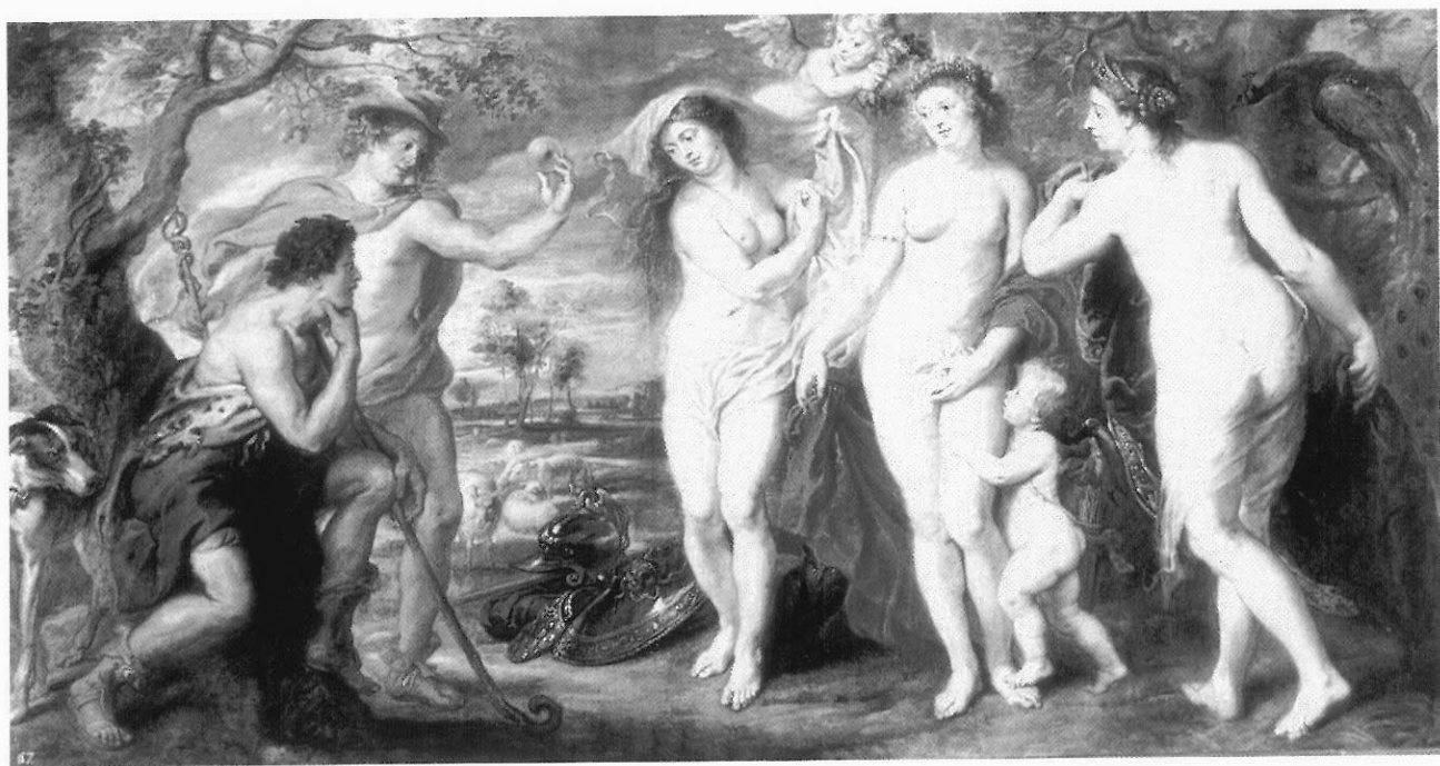
提香 帕里斯的審判 油畫 畫布 1638--1639 199X379cm 馬德里普拉多美術館