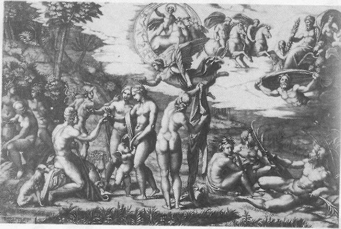
雷蒙狄·帕里斯的審判 版畫 1514-18 29.2X43.3cm 大英博物館藏

決選之時，先與這位英俊的評審人謀面，一來爭得好感，二來私下許諾，再者阿諛奉承，盼能順利當選。於是，希拉要讓帕里斯腰纏萬貫；雅典娜應允聲望名譽；而阿佛柔黛蒂則施出美人計，允諾介紹天下最美麗的女人許配與他。三位女神私下向帕里斯表態和承諾，以謀求最後的殊榮，也為往後的人世間，於每項競賽裡，種下「買票賄選」敗壞世風的惡習。