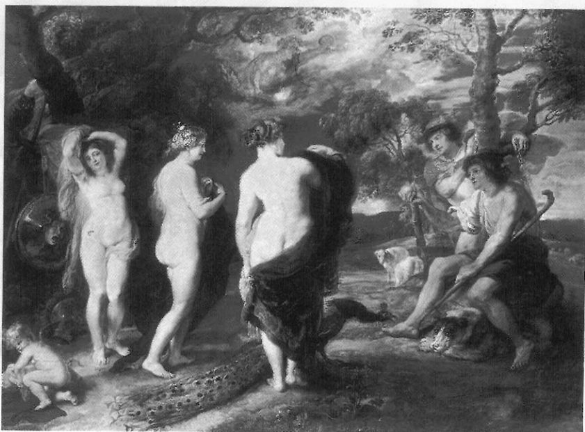
魯本斯 帕里斯的審判 油畫 木板 1632-1635 145X194cm 倫敦國家畫廊

位，而釀成的神話歷史的悲劇；又創世紀裏的亞當與夏娃，在安逸的環境裡仍禁不住誘惑及慾望的作弄，而偷吃「禁果」，破壞與神的承諾，帶著懊悔被逐出伊甸園，從此必須面對接受種種苦境。此外，還有一顆家喻戶曉的「蘋果」，那就是德國民間「格林童話」中的「白雪公主」，格林兄弟倆人蒐集和研究德國語言的根源和故事，於一八一二年編寫出這篇著名故事。