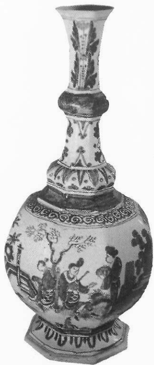
十七世紀法國Nevers地區所生產的仿中國青花瓷瓶。