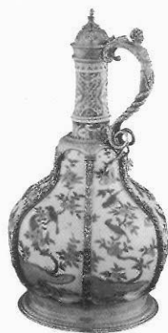
(圖左) 意大利梅迪奇生產的仿中國軟質陶瓷青花器，約生產於一五七五至八七年間。