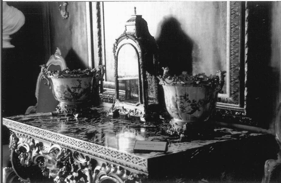
中國瓷器成為歐洲上層社會收藏與裝飾家居的重心。 (筆者攝於華威克城堡[Warwick Castle])

the Medici)仿製中國瓷器，由於缺乏技術上與材料的知識，他們以各種原料如沙子、玻璃、水晶沙、黏土等等，企圖燒製出釉色光輝而透明的堅緻瓷器，但是許多試驗證明是失敗的，目前留存下來當時的製品顯示，釉色朦朧不清而且含有大量的氣泡，裝飾手法以模仿明代嘉靖與萬曆時期的青花為主，繪滿了中國風味的圖樣。一五八七年法蘭西斯科一世死後，數十年間，沒有人敢去嘗試仿製中國瓷器 6 。