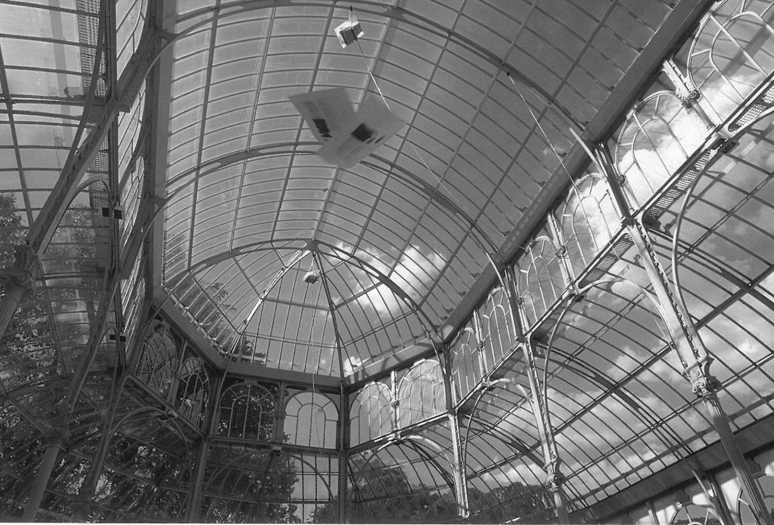
大衛·漢蒙斯 (David Hammons) 二千年全球傳真節 馬德里玻璃宮 西班牙

在後現代的論述充溢的當下，我們瞭解了：書寫存有意識型態的揭露，觀看則含有生命經歷的反芻；而選擇也早避不開片面主觀所主導的權力迷思。在此，個人是以視覺藝術的創作者背景，對當下發展的潛流，做一個論述引介的想法。也礙於篇幅的限制，姑且就讓整個文章脈絡，停留在對差異的揭露、與議題表相引介的層面，而讓呼之欲出的定義內涵探討，暫時停駐在存而不論的高塔上。本文對介入課題的思索路線，一直著重在都會型空間的採樣；而事實上，都會課題只是它整體發展中的一個片斷而已，從它那搖擺的身影走來，我們發現這個介入的觀念，晃動在建築與再現的作品之間；或者換個角度來說，是游走於他者的先存狀態，與作者的現存觀念之間；甚而打破了主客體、內外等等西方習慣性的二元論述限制，而導向一種不以相對論做為探討文本可能性的新結構。