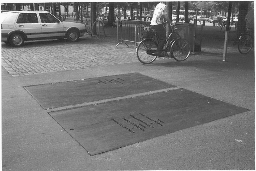
勞伍倫斯 (Lawrence Weiner) 1997年雕塑計畫在幕斯特 德國

而相對於雷貝卡·洪的嚴肅面對，勞伍倫斯的作品計劃，則顯現出一種生活化的幽默。他在市內廣場的地面位置，裝置了好幾組兩片式的鋼板，鋼板上以鏤空的方式，刻著英文與德文並列的句子，句子的文字是：乾的土地和散亂的灰燼，或乾的土地和埋葬的黃金。而鋼板下方有水流動的聲音，可以得知是直接放置在下水道管路的位置。作者利用了