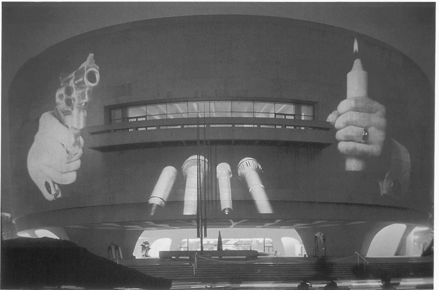
伍迪茲寇 (Krzysztof Wodiczko) 華盛頓赫爾宏美術館 美國