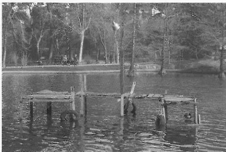
卡丘 (Kcho) 漫濕的觀念 馬德里玻璃宮 西班牙

或許，可以再接近地談論它所觸及的軌跡。一座用來接駁停靠用的木製碼頭結構體，遠遠的離開岸邊而獨立於小池中。一個現實存在的“現成品”觀念，在那移了它的屬性場域之後，又回到它被刻意建構的另一個新的屬性意涵；水池場並未被遷離它的空間概念，卻因為這外結構體的介入，更加直接深化了它的思維範疇，而抵達神話概念的詩意邊緣；這現存的孤立碼頭結構，也繼續沿著它所涵蓋的意義在運作，如：等待、停泊、歇息、延伸等等功能，然而在切斷了與岸邊的土地關係之後，實用功能則被擴張成具象徵的指涉，形成一個在原本意義上，架設另一層文本脈絡的系統。在此，作品與所處場域的關係，並不只是平行的存在，交叉指涉所形成的詩意中，而是在本質屬性的同質影射中，達到一種新的互為文本狀態。空間是早已存在的事實，介入的觀念延著場域意涵，去建構第二個不做作的人為自然，並在互不消弭踐踏的實質中，讓彼此具有共存平等的新平衡關係。