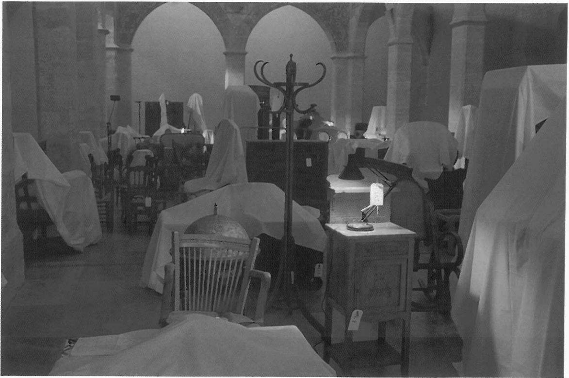
波爾坦斯基 (Christian Boltanski) 買與賣 西班牙瓦倫西亞

現成的形式，如在地面公共工程建構時，臨時覆蓋的鋼板片，使得作品挪用了現實世界中的非藝術形式，而讓作品巧妙且不著痕跡的融合在空間場景之中，但也不影響原本的用途，車子照樣輾過，人也從上面走過；而利用下水道的原本位置，及排水時所存在的水聲結構，來跟刻鏤的文句做一種呼應，產生一種日常生活藝術化的環境氛圍。