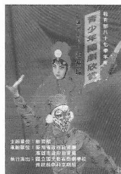
圖4 每年青少年國劇欣賞巡迴展DM

結訓，為讓僑居地學生，對祖國傳統文化多一層認識，特別規劃傳統戲曲做一次文化饗宴之旅。再如一九九八年七月份辦理之「中韓傳統表演藝術研習營」活動。它是韓國藝術學院邀請之國際性文化交流活動，活動內容包括教學訓練、展演及學術座談會等。由於活動內容項目多，人力、財力資源等學校均無法負荷。所以，首先成立臨時組織編制，邀請國立國光劇團合作辦理。一方面解決人力、財力資源負擔；另一方面找尋主管單位教育部、文化建設管理基金會、外交部、國立傳統藝術中心籌備處……等單位，給予財力支援，減輕學校預算負擔。