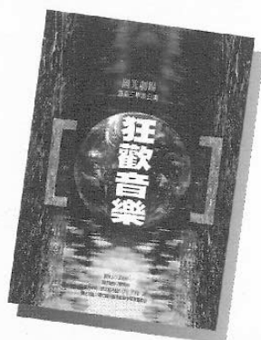
圖3 國光劇坊系列活動-音樂科學生畢業製作之DM