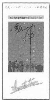
圖2 勁舞嘉年華會小DM