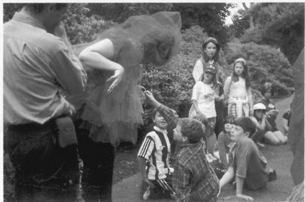
圖2 孩童拿草指引墨西哥甲蟲。

隨吹笛人遊園碰到龍時，聽龍在哀傷地訴說自己遠離自己的皇宮，而落腳在這歐洲植物園中的東方園區時，有孩子安慰龍說：「你現在住的這個地方也是皇宮呀（But this is the『Royal』 Botanic Garden！）」，聽了不禁讓在場的人莞爾。又當他們在雨林區碰到那隻一身綠、動作緩慢的甲蟲時，在了解牠正無所適從之後，爭相簇擁照顧牠時，有孩子靈機一動，從地上撿了草，握在手中，有效地引導著甲蟲走向正確的方向。另外還有請他們討論如何結識朋友，並以「靜止畫面」（still image）呈現他們如何結識朋友，以便給來自北美的箬麻樹結識朋友的方法等。