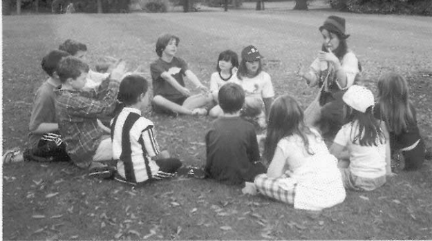
圖1 吹笛人和孩童講自己的經歷。