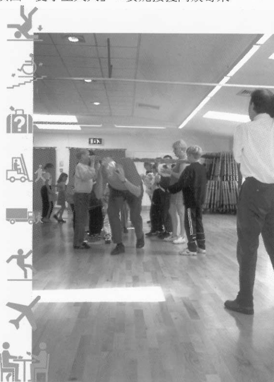
圖3 曾曾曾祖父牽大家經過防火隧道，逃離火場。