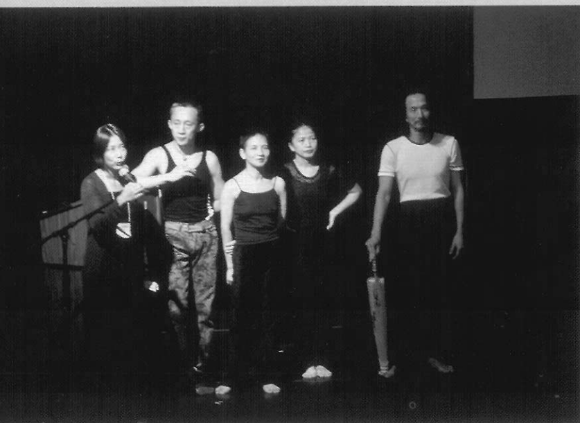
越界舞團在示範演出後與觀眾對談

舞蹈節除了每晚在該市最大的瑪瑞安劇場 (Merriam) 邀請主要代表舞蹈團體演出佳作之外，每天下午五點在 Drake 實驗劇場亦有中型之演出。早上由十點到下午五點，各個不同舞團給予「演講及示範演出 (Lecture / demonstration)」，讓觀眾與舞蹈家們有交流機會，其中廣東現代舞團及英國過渡舞團 (Transition Dance Company, England) 的高度技巧呈現，廣受好評。另