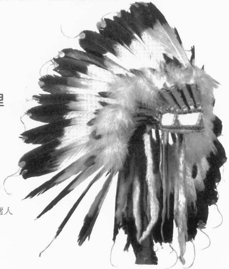
1999年大英博物館舉辦北美印地安文物特展，所展出的一件印地安鳥羽飾冠。