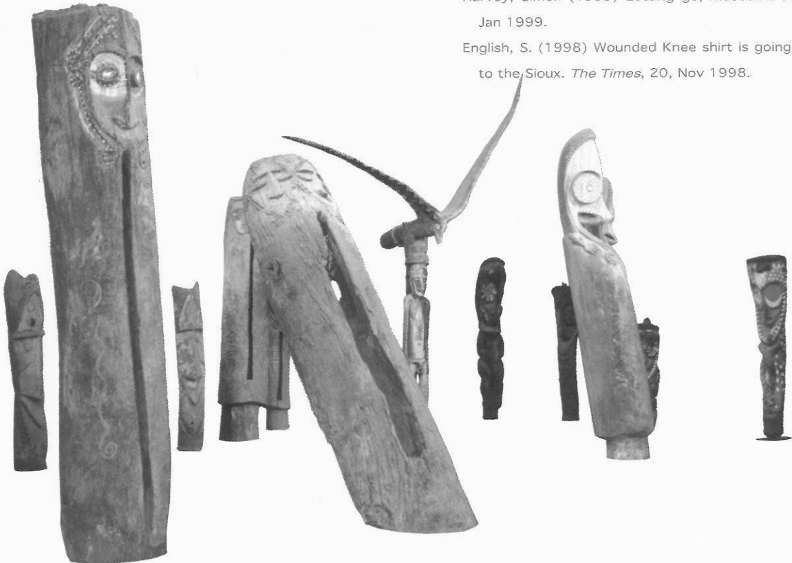
非洲各民族的圖騰柱。(筆者攝於法國巴黎國立非洲藝術暨大洋洲博物館-Musée National Des Arts Africains et Océaniques)