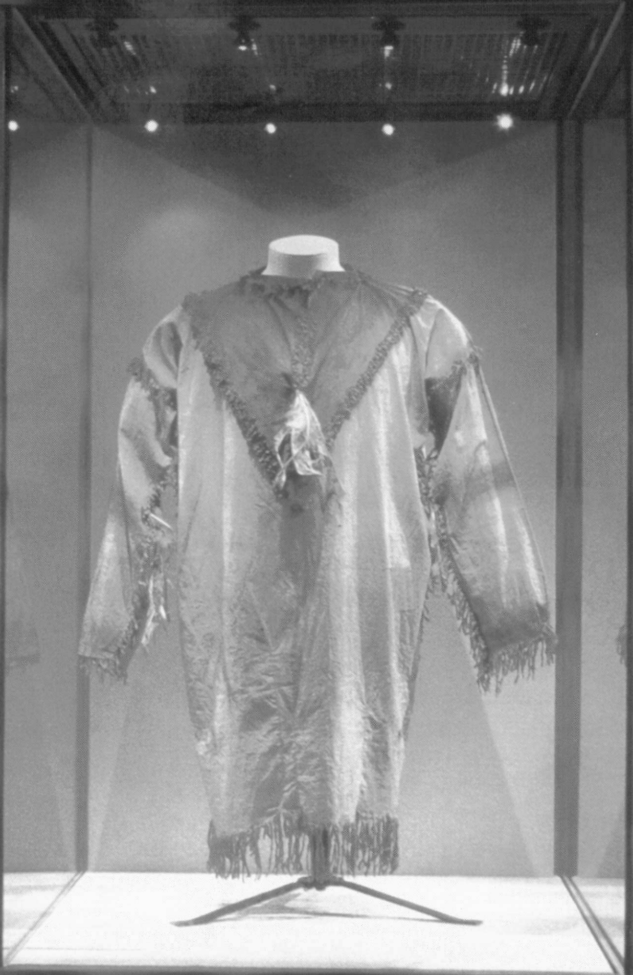
原屬於北美印地安蘇族(Sioux)的神聖物—靈魂舞衫(Ghost Dance Shirt)，已由英國格拉斯哥博物館還給蘇族代表。