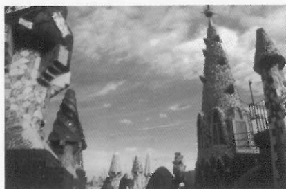
圖1 奎爾宅邸屋頂上，裝飾著各種造形的煙囪與通風口。

高第的建築，絕大多數興建在巴塞隆納，這個濱地中海的港埠自九世紀即為加泰隆尼亞的首府。十世紀時，加泰隆尼亞早在西班牙國家形成前脫離佛朗哥王國，成為獨立自主邦國，以基督教立國，並驅除境內的回教徒，產生地方語文，而形成強烈向心性的國家意識。加泰隆尼亞有其獨特的文化傳統，是發自中世紀基督教信仰的一種地方性傳統，非常具有浪漫的格調，加上集希臘、羅馬、哥德、阿拉伯等文化遺產，人文薈萃，與學院建築的結構理性主義是大不相同。 1 高第受此有機、豐富的多元文化薰陶自然含英咀華，融合個人才能、毅力，嘔心創造自己獨特的建築王國。