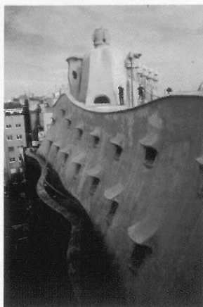
圖6 起伏的壁面、陽台與武士造形煙囪，有如夢幻景象。

飾元素，重整舊房子的外表，使得牆壁立面，有著波光粼粼的律動，尤其在旭日東升時，光線經由牆上五顏六色的彩瓷反射，更為絢麗，宛如童話中的城堡。有人批評像這樣的建築一如新藝術般，同樣忽略實用機能，例如：尖頭鑄鐵欄杆恐會刺傷人等等。