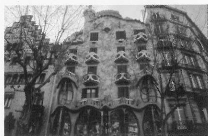
圖2 巴由之家正面屋簷呈現聖喬治屠龍：牆面以彩瓷表示海浪背景。左側階梯式山牆為 Amatller之家。