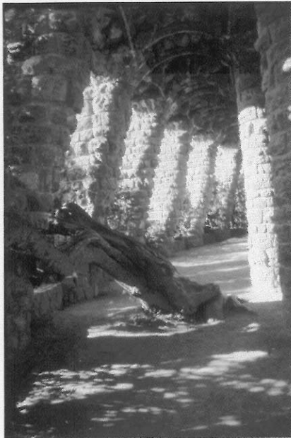
圖4 建造奎爾公園以不破壞原有自然為原則，步道中間的老樹仍被保留。