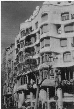
圖5 石頭陽台搭配精細鑄鐵欄杆，造成波浪律動的門面。