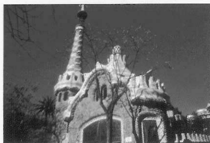
圖3 奎爾公園大門旁的房子設計成管理員的住所，螺旋狀的塔頂安放十字架。