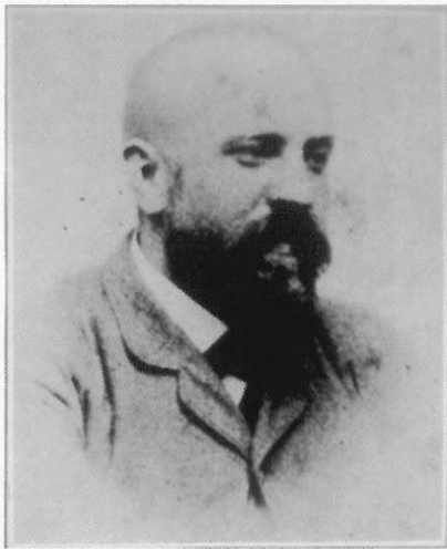
1888年巴塞隆納舉辦世界展覽會，高第當時36歲的識別證照片。