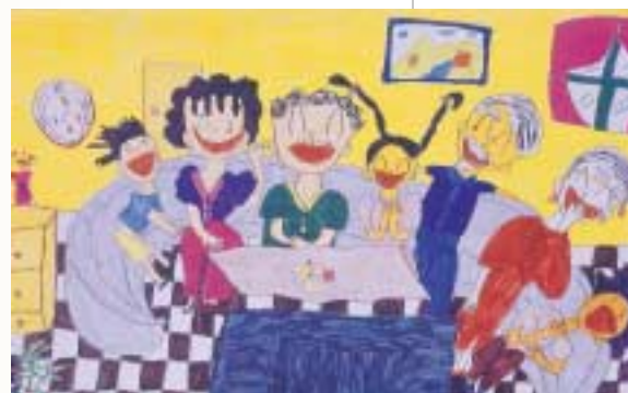
兒童畫筆下的家族圖象，具有超越攝影的情感寫真