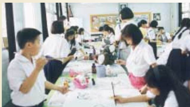
兒童畫的創作需要輕鬆自主的情境