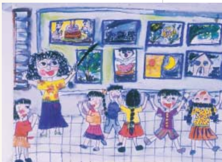
兒童畫展是兒童心靈圖象的交流