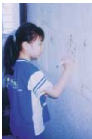
圖牆畫壁是常見的幼兒家庭美術活動

台灣現正處於後工業時代，面對二十一世紀快速轉換的高科技與多元價值觀的社會情境，兒童畫教育與社會未來發展的關係將更密切。今後的人類生活中，將更重視休閒生活，以平衡緊張快速的生活步調，如此美術活動將扮演極重要的角色，兒童畫教育將應受到重視。而在此高度科學與技術的時代，「智力」與「創造力」將取代「勞力」；「物化」與「商品化」的生活環境中，「人」的價值，將會是深刻的課題，以「人」為主體，超越、克服技術與科學的制約，而至全方位的擴展——人與環境相互關係的交流、確認與自覺，將是未來兒童畫的方向。另一方面，由於資訊媒體的發達，縮短世界距離成為地球村結構，因而強勢文化壟斷的時代將結束，尊重不同族群的多元文化價值觀將成為主流。如何教導孩子認識傳統文化及世界各國文化特質，期以創造出屬於我們自己文化的作品，也是兒童畫教育未來的目標。綜言之，全人的、人本的、多元文化的整合性的兒童美術教育目標，是未來發展的趨勢。