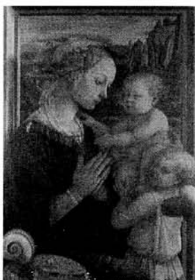
作品 1：【腓力波·利比—〈聖母子與天使〉 / 1456】

腓力波·利比雖然是一個基督教傳教士，可是在他的聖母像上見不到絲毫神秘氣質，畫家著意於借聖母形象來描繪女性的嫵媚、溫柔與善良的秉