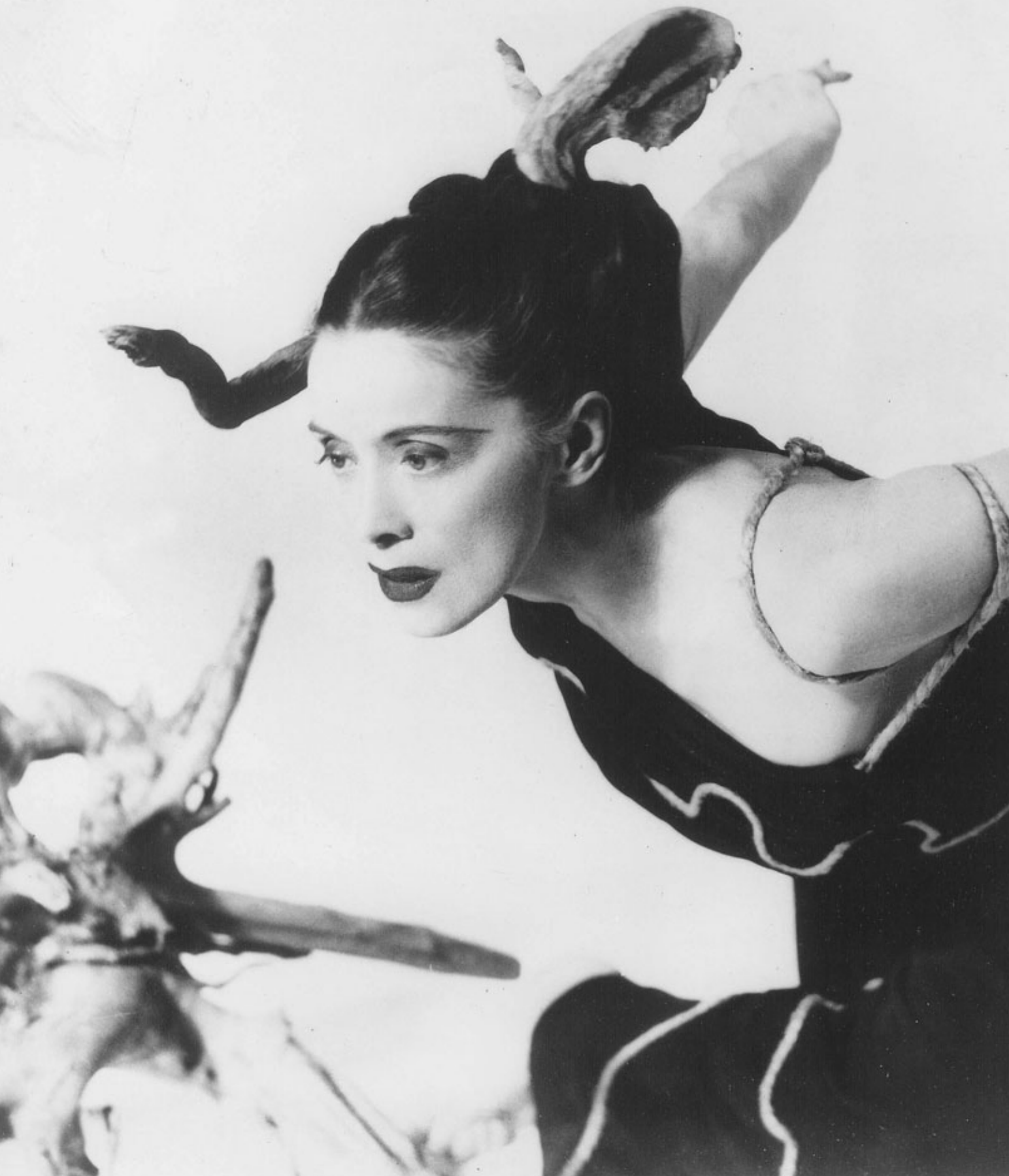
擅長編舞及表演的瑪莎·葛蘭姆在其舞作《心之洞》中演出