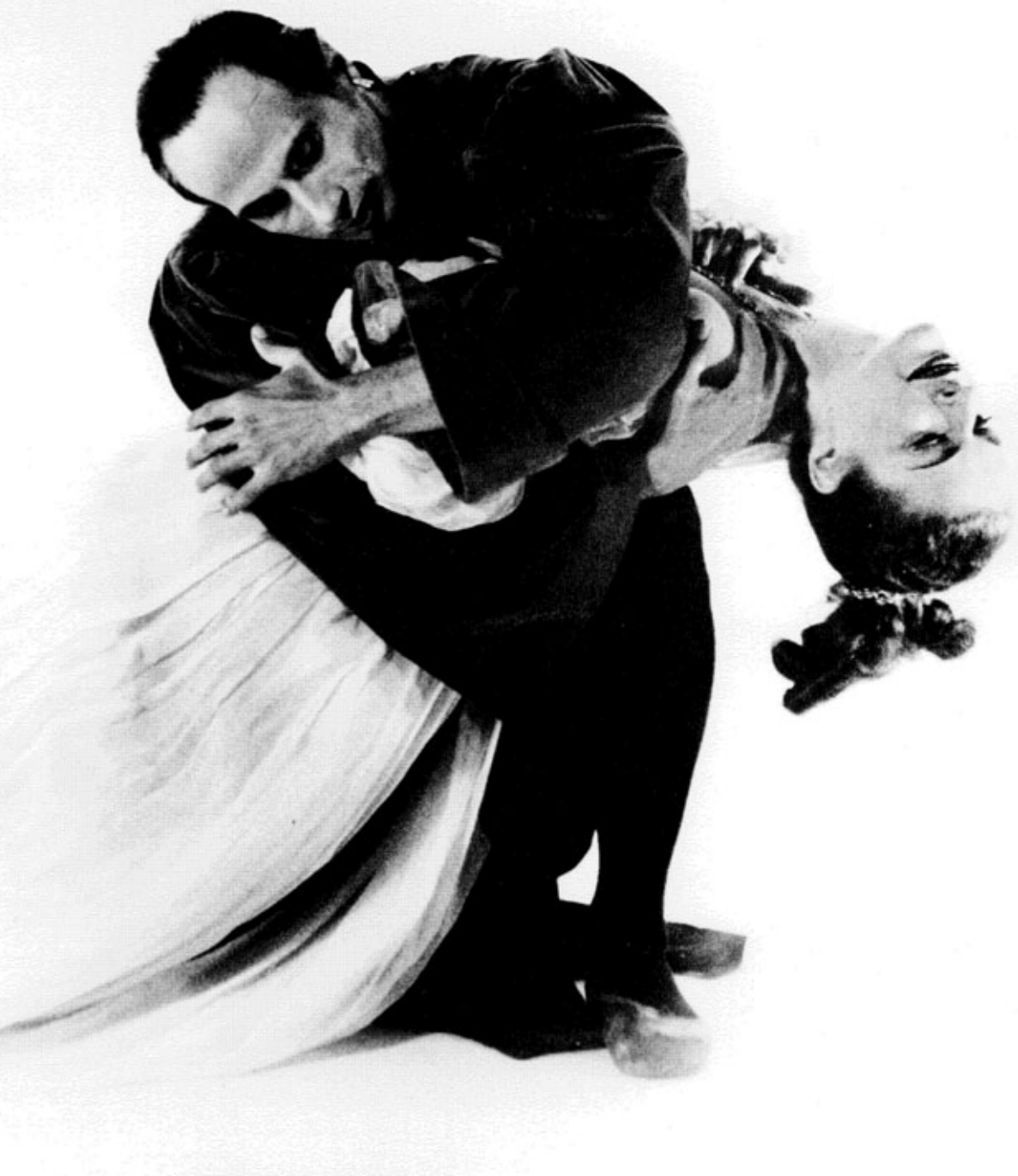
荷西·李蒙以莎翁的奧賽羅名作改編的舞蹈劇場作品《摩爾人的孔雀舞》