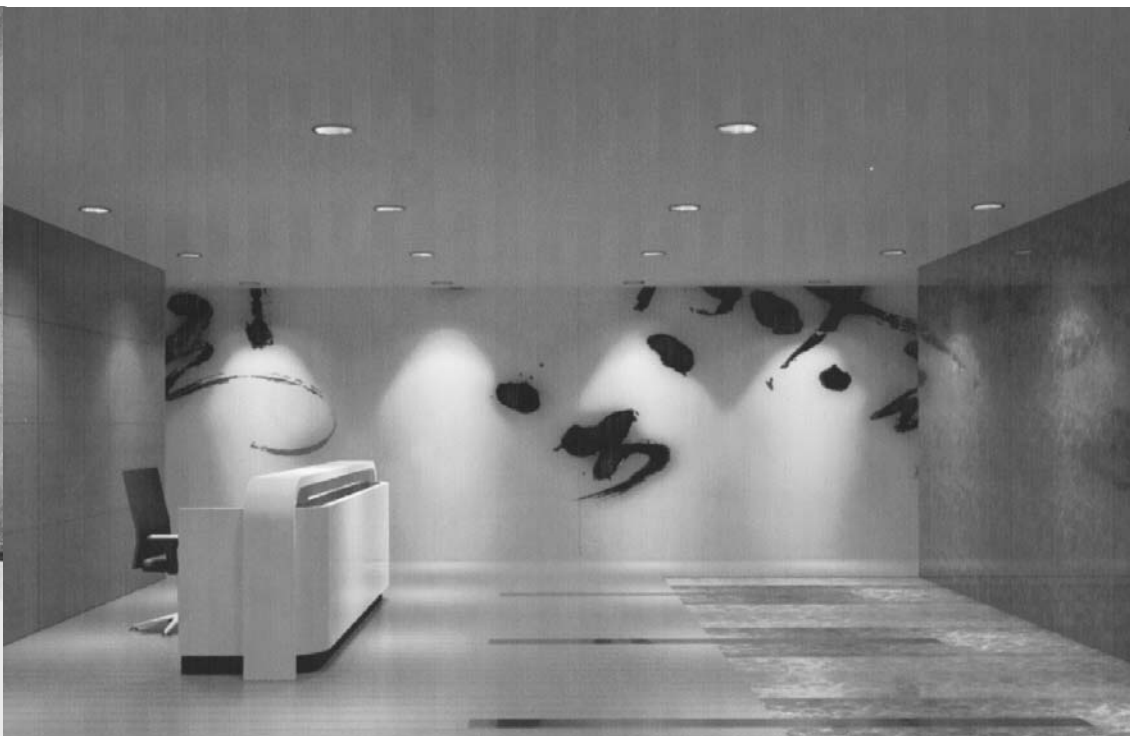
圖八 將書法直接書寫在牆壁。當然，「入境隨俗」與周遭環境的「現代感」搭調是絕對必要的。

處講究專業的時候，應該有其獨立的必要和重要性。而室內布置若能透過業主、設計師、畫商或書畫家三者的協商，是可以得到很好的布置效果的。畫商須具有專業之眼光，熟悉藝術家的風格和整個繪畫市場的行情，室內設計師須掌控及瞭解整個房子風格的色彩、材料、家具的型式以及業主的預算，書畫家也不應該置身事外，僅限於提供作品而無視於時代的進步和周遭生活的改變；三者合作無間，作出一個色、香、味俱全可口的漢堡便不是難事。