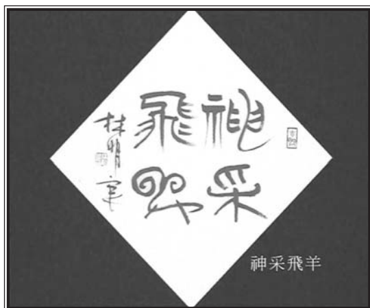
圖四 林明良〈神采飛采〉 大膽的以黑框紅底來襯托作品的喜氣和現代感

作品裝裱須與周遭環境的風格、色彩、材料、家具、設計年代等相協調，如果有室內設計師可以研究當然是更理想。我在處理書畫作品時，就喜歡大膽的以黑框紅底來襯托作品的喜氣，或根據現場以不