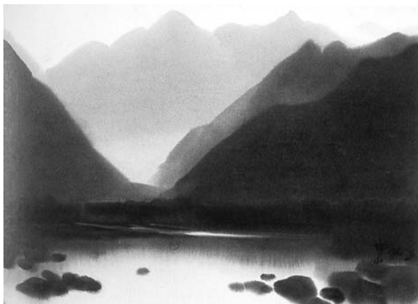
圖一 席德進水彩作品