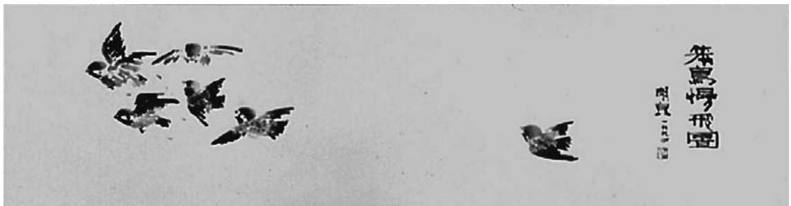
圖：〈笨鳥慢飛〉林明良 1994

從那時起，笨蛋家族就多了一個成員，名曰「笨鳥」。王大空先生以不同的觀點力挺笨鳥存在的價值，得到廣大讀者熱烈的支持和認同。