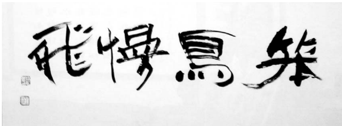
圖三 「笨鳥慢飛」林明良作 2003

一九九四年我在新生畫廊舉行個展，畫了件「笨鳥慢飛」自勉之（圖二）。「春聲畫會」的張美淑女史來到展覽會場，一見之下驚豔不已，隨即向我表態：「這件作品我要了！」基於同是「笨鳥知音」，原本是非賣品，遂忍痛割愛。