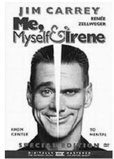
圖五 金凱瑞 (Jim Carrey) 電影「一個頭兩個人」的劇照

好萊塢首屈一指的超級笑匠，金凱瑞 (Jim Carrey) (圖五) 和香港的周星馳，都是銀幕上的超級大笨鳥，臺灣最近則冒出一個「上流美」，經常逗得觀眾樂不可支，開心大笑。她的經典名句語錄如：「偶是『鞋猴』(學佛)的人，我不七(吃)牛肉，只七(吃)羊