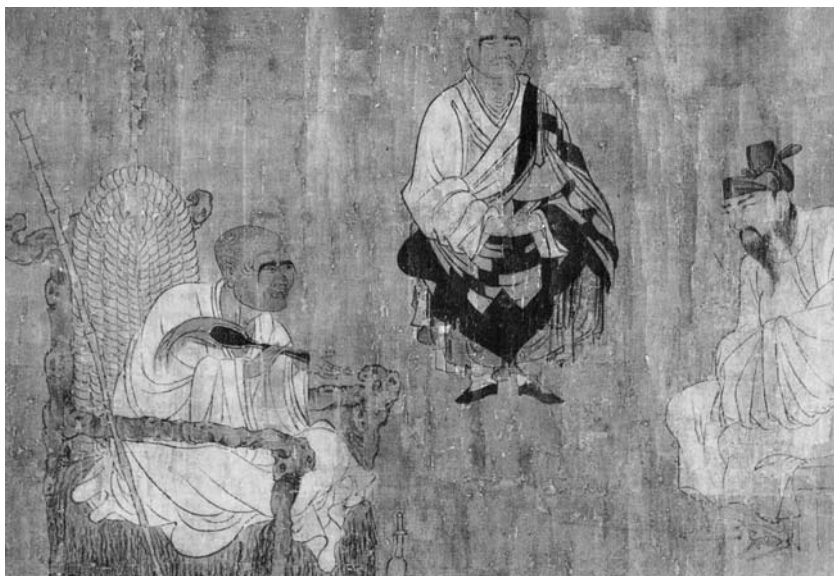
圖三 閻立本〈蕭翼賺蘭亭〉(局部)

唐朝還有一位大書畫家閻立本 1 （圖三），本是唐太宗朝廷重臣。一次，太宗和侍臣們在春苑池中泛舟，正值水禽弋游，「上愛玩不已」一時興起，於是急召閻立本前來描繪之。閻立本當時已是位居主爵郎中，職位不算低，傳旨的侍臣卻直喚他爲「畫師」，而不稱其官銜；彼時由於畫師社會地位不高，致使他認爲受到了莫大的屈