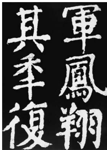
圖二 顏真卿〈大唐中興頌〉