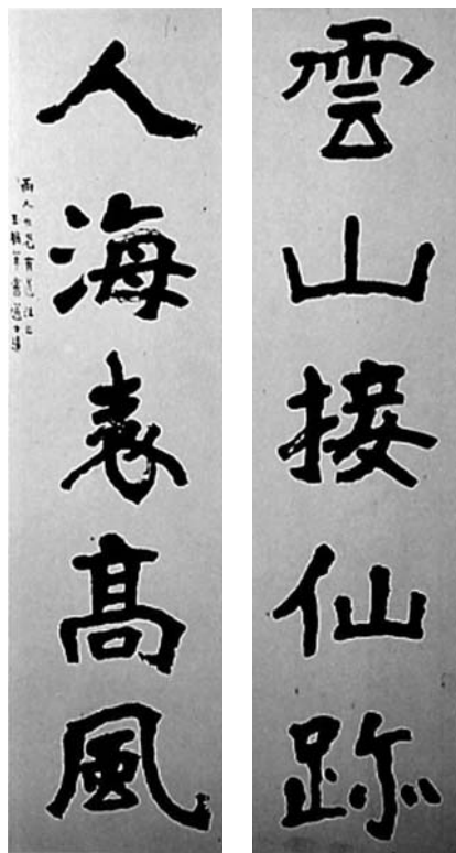
圖四 張大千的老師清道人李瑞清書法

國畫大師張大千的書法老師清道人李瑞清 4 （圖四）也是個例子，清道人昔以賣字為生，而要字的人，經常是急得跟討債一般，常令清道人應接不暇。每春秋佳日，亦不得休息，眼見連鄰居野老牧童都有「週休度假」之時，清道人自怨「予獨居繫一室，腕脫研穿，不得稍息，人生如白駒過隙，何自苦如此。」他的友人歐陽君因此常勸他說：「為學莫學書，學書誠無益，拙無損於