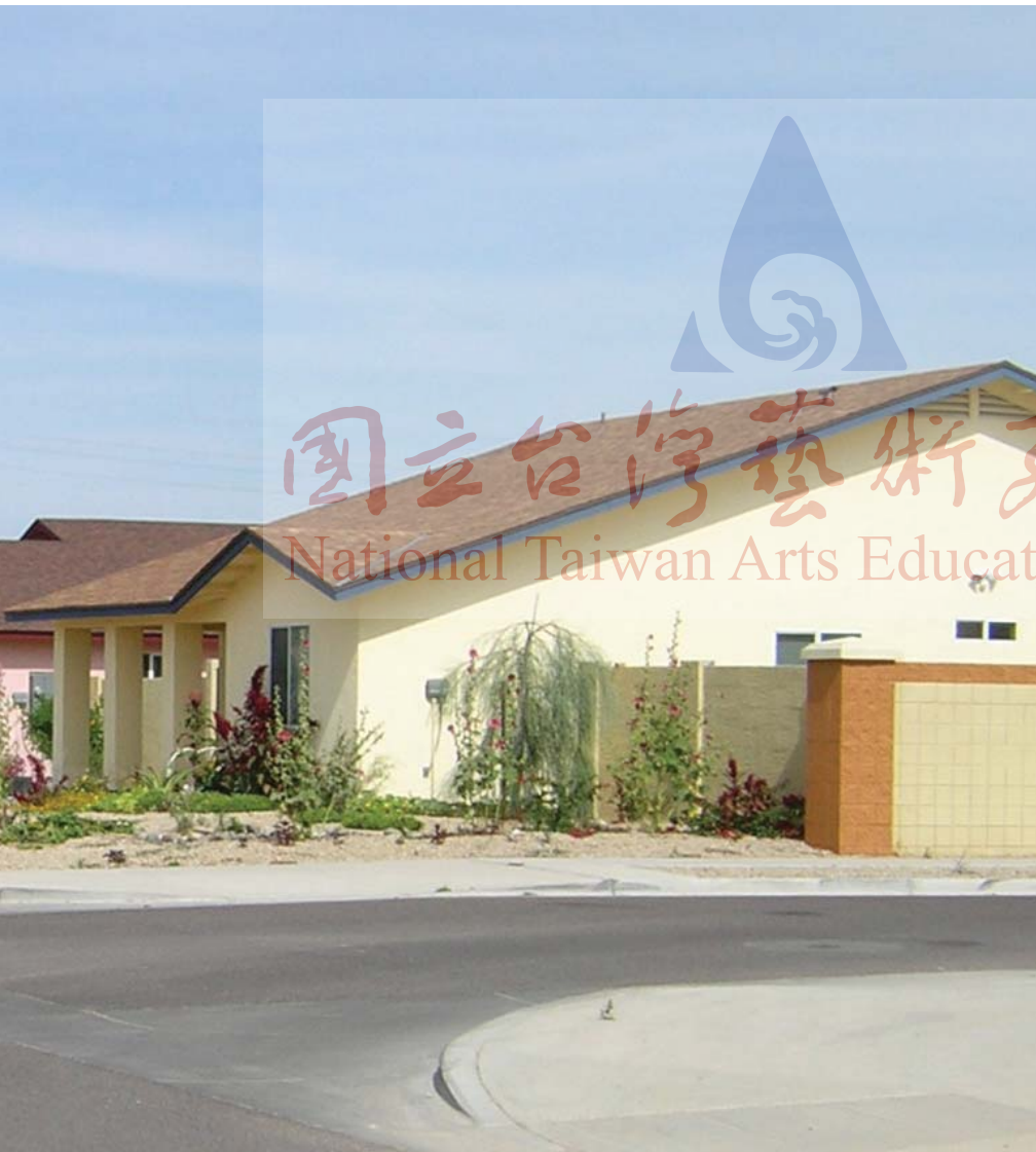
圖13-10 整個社區已落成，2005年攝