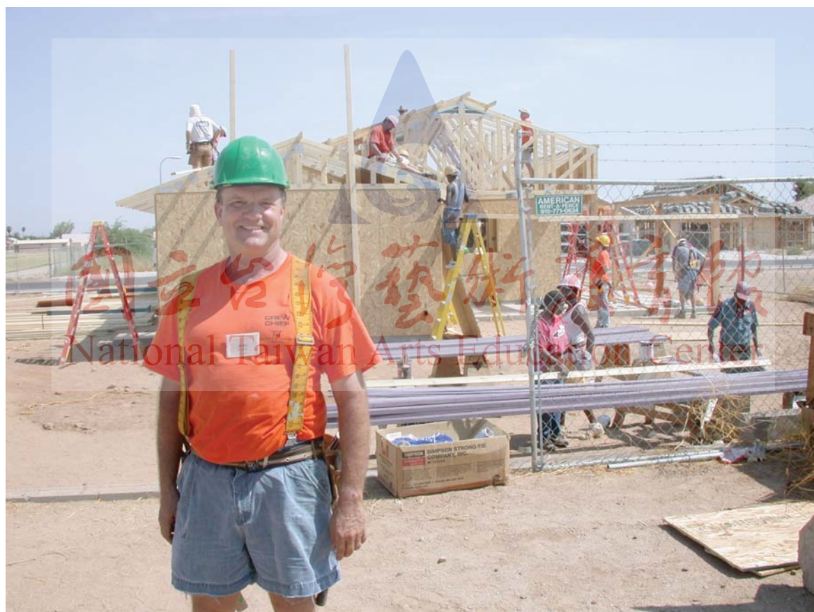
圖13-1 韓弗瑞教授，2003年攝

Building Two Houses:A Day with Dr. Humphreys