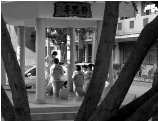
變裝前的校園涼亭

筆者以往美術課實作部分，大多由學生個別完成，除了互評與欣賞別人作品之外，較缺乏團體合作的機會，為使美術課有更寬廣的揮灑空間，設計本教學單元，以中心主題——「地景藝術」，延伸出各種學習項目，並藉由引導方式讓學生學習環保、地景藝術、包紮藝術、溝通諮詢與團結合作的人文修養，以使課程呈現多元、具學校特色的樣貌，它不僅僅是美術實作課。也讓學生充分發揮想像力，使得一成不變的校園，展露出不一樣的風情。（如下圖）