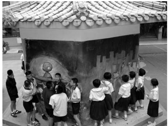
變裝後的校園涼亭