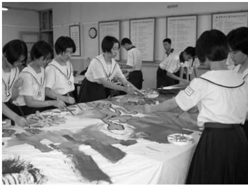
各小組合力繪製包紮作品