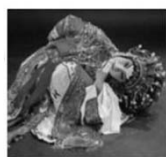
做：舞蹈化的形體動作