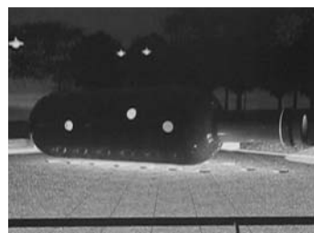
圖三：Malcolm Cochran之公共藝術品 〈紐約瓶中船〉