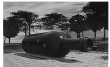
Malcolm Cochran之公共藝術品〈紐約瓶中船〉