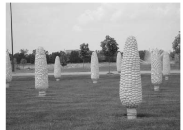
Malcolm Cochran之公共藝術品〈玉米田〉