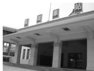
高雄舊火車站

請學生到高雄舊火車站遺跡參觀，請學生仔細觀察舊火車站以及火車站周遭環境，並拍攝照片予以記錄，以做為創作時的參考資料。