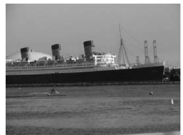
瑪莉皇后二號