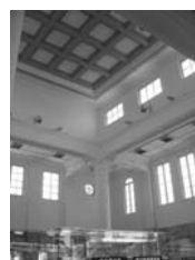
高雄舊火車站內部

教師先說明，在進行完前面的活動和學習後，希望同學能思考，如何像Malcolm Cochran一樣，運用公共藝術的方式，來創作一個能夠傳達高雄火車站與高雄人生活關係的裝置藝術品。接著請學生展示所蒐集的高雄舊火車站資料和照片，教師觀看並與學生討論，進行心得互換，從討論的過程中凝聚創作的構想。