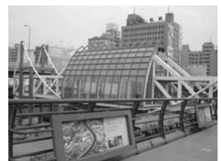
保存鐵道文化的高雄願景館