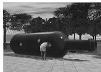
Malcolm Cochran之公共藝術品 〈紐約瓶中船〉