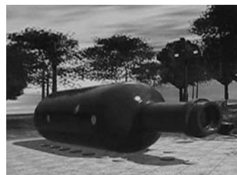
Malcolm Cochran之公共藝術品 〈紐約瓶中船〉