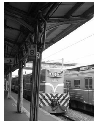
現今高雄火車站月台