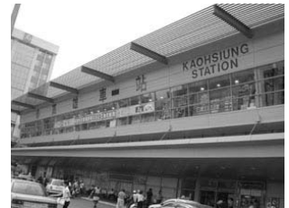
人來人往的高雄臨時火車站

由於高雄捷運、高鐵的建立，原高雄火車站的位置將是台鐵、捷運、高鐵「三鐵共構」的中心，原本要面臨拆除的高雄火車站，在高雄人極力維護和聲援下，展開「保存火車站」的運動，即以工程上的「總掘工法」進行遷移，也就是在完全不損壞地面上建物的方式，將整棟建物移至附近的空地安放，同時也在站旁建立「高雄願景館」（以介紹高雄鐵道文化為主），以及週遭附屬的高空鳥瞰區，讓高雄市民一同參與見證火車站的保存與改變。