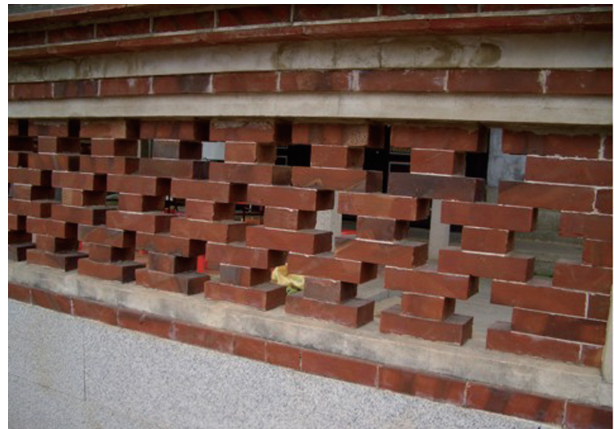
圖3-18 金門國家公園水頭黃俊西堂別業圍牆的磚砌工法細部。