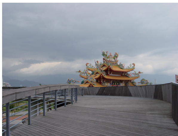
圖3-10、3-11 自由造型的自行車道天橋，既創造了活動，也創造了多元社區活動的多元場所，更創造了新福宮前的一個罕見的聚落地景。