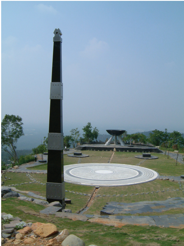
圖3-23 三地門地磨兒傳統生活工藝園區的生命舞台廣場：前為高聳直立的「祖靈柱」，中間為「生命舞台」，以水道延伸至祈求豐收的「灶」。「灶」前有「動物祭台」、「植物祭台」各一座。

位於屏東縣北側的三地門，是屏東縣八個原住民鄉最大的一鄉。境內丘陵起伏不平，造就了許多幽雅的景觀。三地門共設有十個村，人口約有七千多人，是一個以原住民為主的鄉鎮。三地門舊稱「山豬毛」，排灣族語稱三地門為「音斯笛摩兒」，指霧臺、三地門、瑪家等三處山地鄉共同的進出門戶。但目前還是採用日據時代時的名稱：三地門。