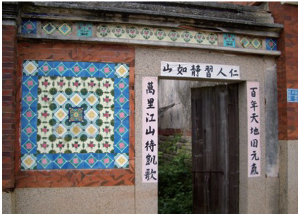
圖3-14 金門國家公園中水頭黃天露宅，入口裝飾面磚砌工精美。