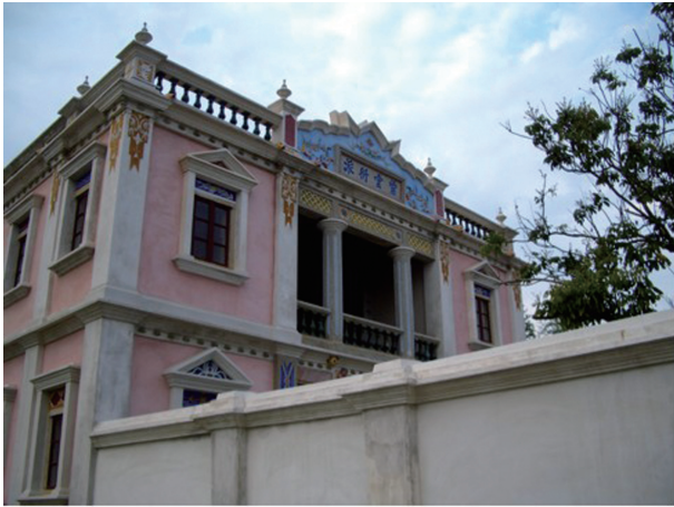
圖3-12 金門國家公園中的水頭42號洋樓，是棟式樣混和的洋樓。