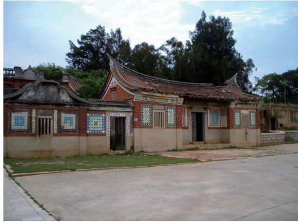
圖3-13 金門國家公園中水頭黃天露宅的埕與入口。

宗祠是金門國家公園的另一特殊人文景觀。因為金門的聚落多由單姓血親所組成。在這種聚落中，都建有該姓氏的宗祠以奉祀祖先。這種以宗祠為中心的同姓宗族聚落社會，可見於珠山的薛氏、水頭的黃氏宗祠等。金門國家公園內宗祠密度居全國之冠，這充分說明金門宗族觀念的深厚以及慎終追遠、不忘根本重血緣情感的民風。