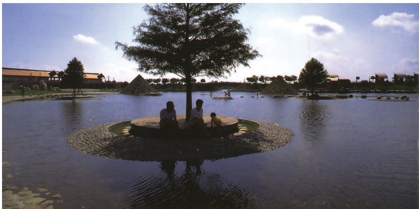
圖3-19 為了彰顯親水公園中「親近水、擁有綠」的規劃主題。景觀設計師們充分利用冬山河水域的特性，將其開發成一個「水與綠」結合的開放空間。

童趣鑲畫區是由宜蘭的八百位小朋友們，利用貝殼、瓷片、陶片、彈珠等所鑲成充滿童趣的水泥板畫。藉此，建立起冬山河親水公園與兒童間的親密互動關係，使冬山河親水公園更自然、更活潑、更有朝氣、更近人。