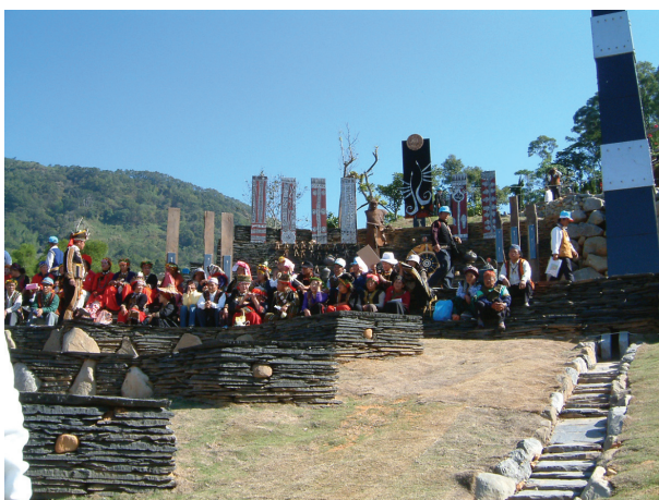
圖3-27 三地門地磨兒傳統生活工藝園區的生命舞臺廣場：百步蛇觀禮坐席區。