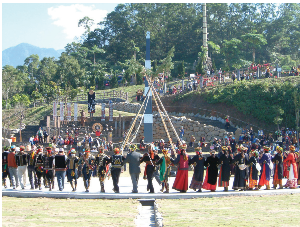
圖3-26 三地門地磨兒傳統生活工藝園區的生命舞臺廣場：「生命舞臺」舉行祭典時之場景，中間高豎起的是黑白相間的祖靈柱，背景為百步蛇觀禮坐席區。