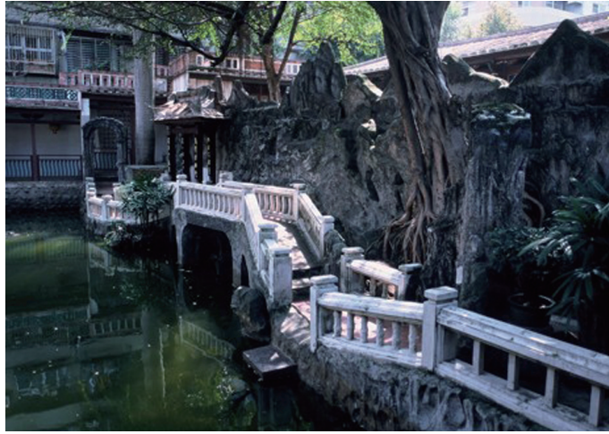
圖3-2 板橋林家花園：方鑑齋的假山