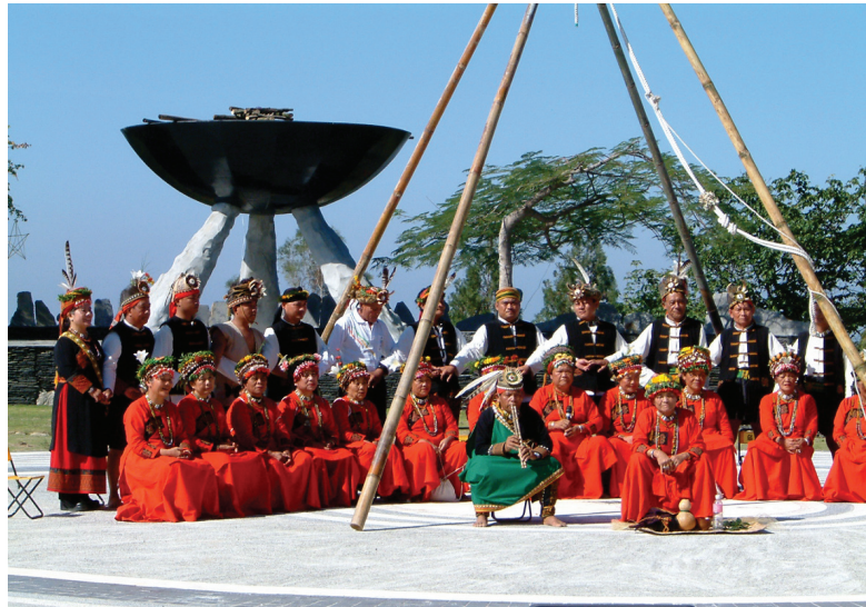
圖3-24 三地門地磨兒傳統生活工藝園區的生命舞臺廣場：祈求豐收的「灶」。

不管是排灣或魯凱，族人的傳統圖騰以百步蛇最具代表性。舉凡在木雕、石雕、日常用品及服飾上，都可以看到百步蛇圖紋的使用。百步蛇在排灣與魯凱的社會中，象徵著權威和尊貴，因此，只有貴族才能夠使用百步蛇圖騰。此外，百步蛇在排灣族的信念中，代表著「正靈」的化身，是全排灣族人的守護