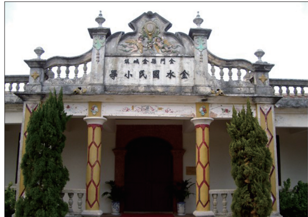
圖3-15 金門國家公園中水頭的金水國小，由僑資捐獻興建，風格式樣特殊。

聚落內到處都可見到華麗的燕尾官宅。在家廟中，懸滿了「文魁」、「兄弟文魁」、「五世登科」等顯赫的匾額。瓊林除了大宗的「蔡氏家廟」外，每房也都有各自的祠堂。其中有兩座祠堂同位在一棟三落大厝中，而有「七座八祠」之稱。其他與瓊林聚落相關的人文景觀資源尚有：金門最早的國民學校「怡穀堂」位於聚落東北和西南二角的風獅爺等。