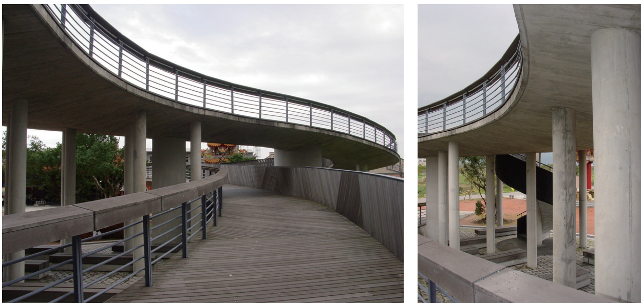
圖3-8、3-9 支撐飛橋的混凝土圓柱列，在橋下形成了茂密的柱林，讓空間多了「藏」與「露」、「圍」與「透」的質感。

大片橫豎斜切的三角形狀鐵木鋪面，讓飛橋地面增添了趣味性與韻律感，同時也解決了自由造型的飛橋平面被分割的窘境。地板面上延至扶手面在視覺效果上是成功的；在創意上是新穎的。廟埕廣場前的螺旋梯，一方面導引人由