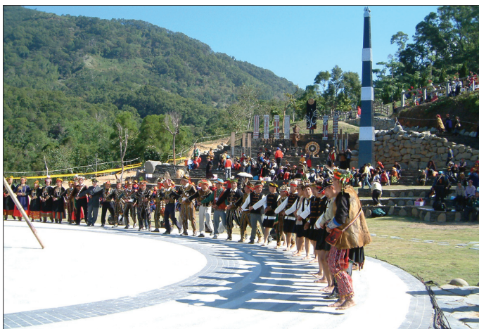
圖3-25 三地門地磨兒傳統生活工藝園區的生命舞臺廣場：「生命舞臺」舉行祭典時之場景，背景高豎起的是黑白相間的祖靈柱。

三地門的排灣與魯凱族人，由神話傳說、信仰崇拜與原始生活的傳承中，發展出民俗性的舞蹈，以肢體形象特徵，如走、踏、蹬、滑、踮、跳、涮等動作，配合身體的屈、伸、俯、仰、振動等姿式，按不同的節奏與速度前進、後退，組合成各式各樣的舞蹈，應用在禋年、酬神、溝通祖靈或聯歡自娛上。