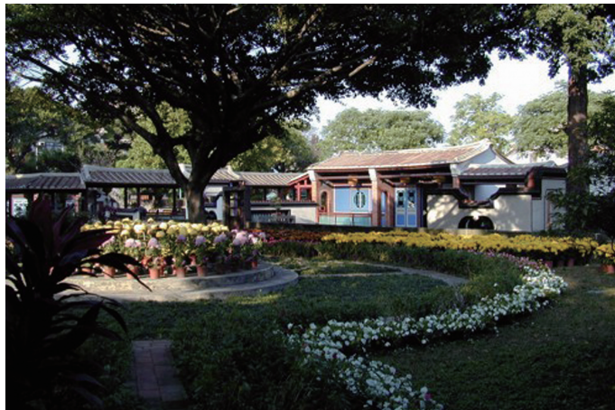
圖3-3 板橋林家花園：園內有亭、有池、有草花苗圃、有許多中國文人的象徵和隱喻。