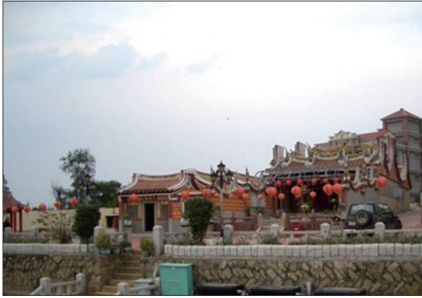
圖3-16 金門國家公園中的水頭金水寺也是風格特殊的金門景觀。