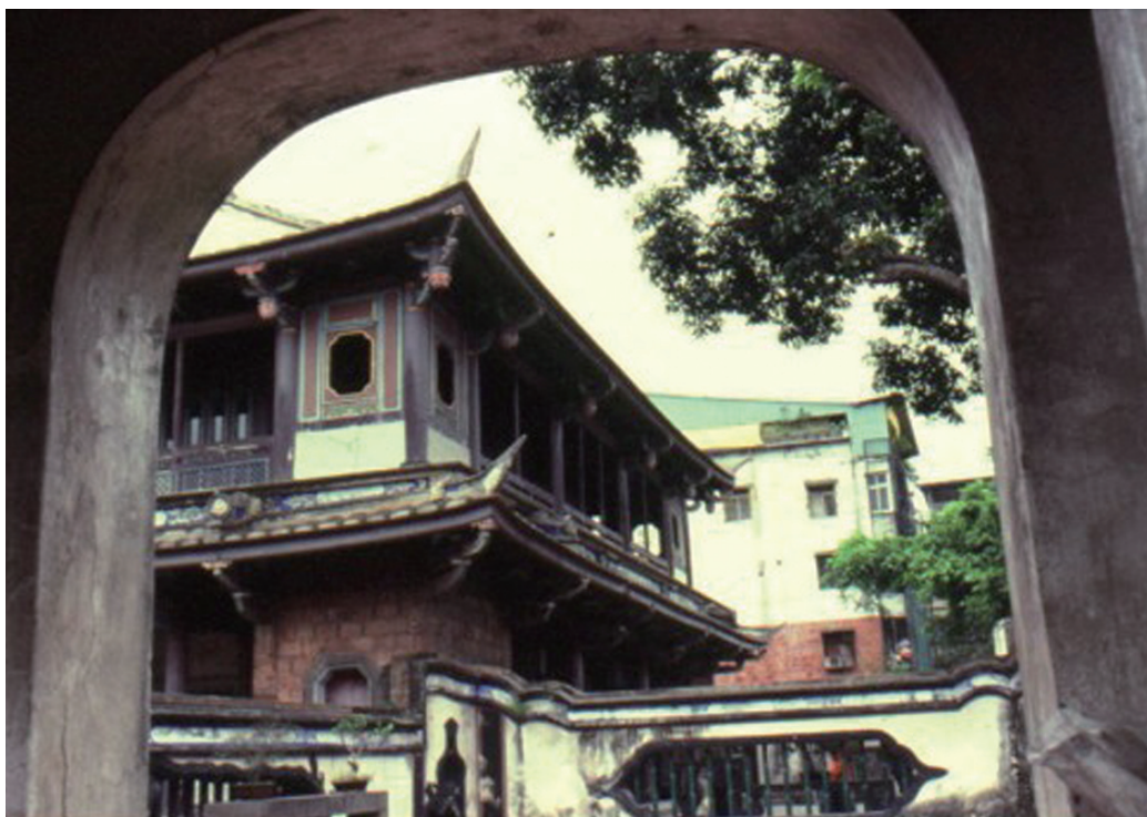
圖3-1 板橋林家花園中的觀稼樓

「入相」的區隔，這也巧妙地暗示開軒一笑亭是做為戲亭子之用。太師壁旁有對聯一幅，對聯內容更彰顯傳統園林中的文人氣息：「海宇正澄清，花柳馬中，一片承平調雅頌。園林新結構，笙歌聲裡，四周全碧湧樓台。」