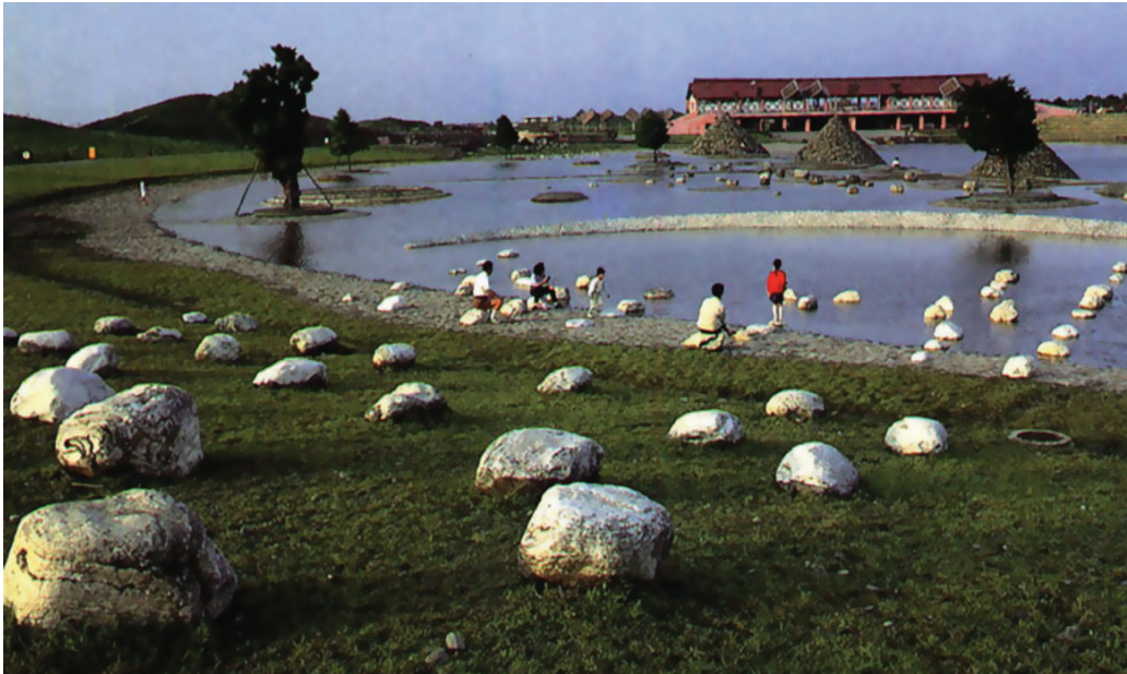
圖3-21 涉水池高低錯落的淺水池，水深僅足以覆蓋足踝，提供遊客親子涉水之用。

冬山河親水公園是一座「綠化」、「防污」、「農漁業」兼顧的知識型、運動型、娛樂型休閒公園。知識型森林公園，象徵著自然與歷史的傳承，空間之構成與大地結合為一體，構造物偏向體狀、塊狀。運動型的親水公園散發親水、樂水、熱情、愉快的活力，空間構成以線狀、面狀為主。娛樂型的水上海濱公園，則是發展全國性大型水上休閒活動的孕育地。冬山河親水公園的其他旅遊與景觀資訊，請參考以下網址： http://www.goilan.com.tw/dsriver/content/intro.htm