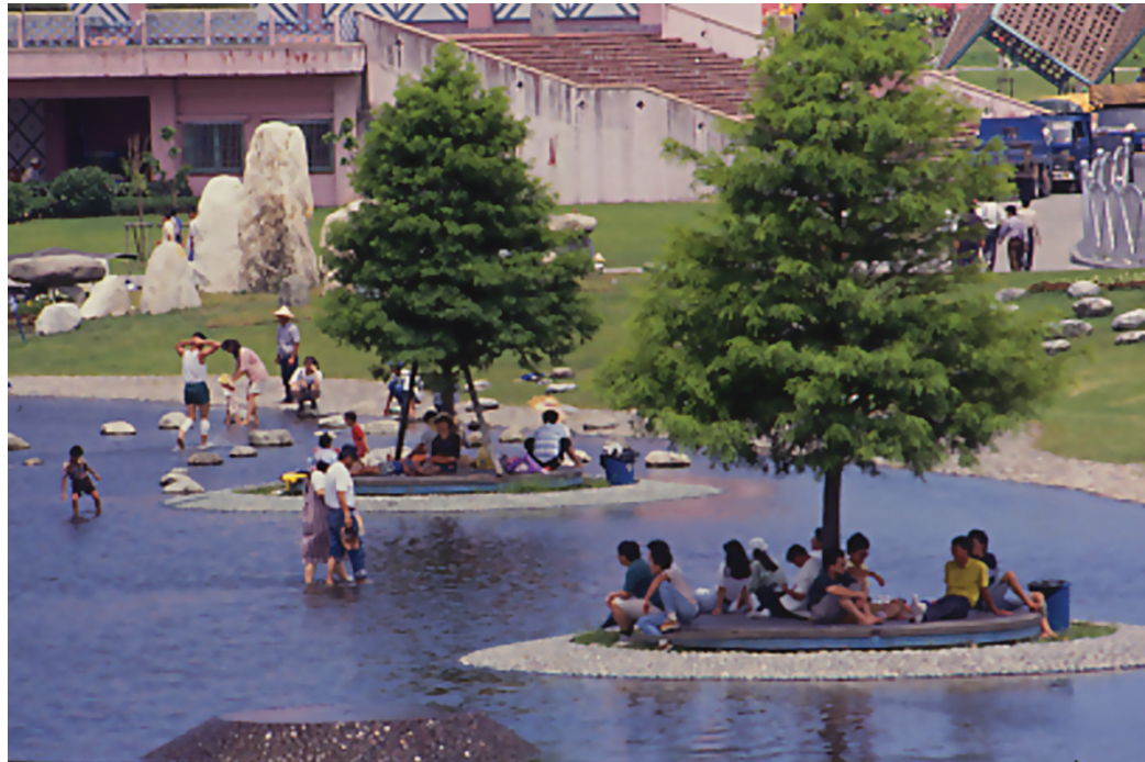
圖3-20 宜蘭冬山河親水公園，為了落實「親近水」的理念，在陸地與水接觸的地方，多半都被設計成階狀平臺，一層層的沒入河中。