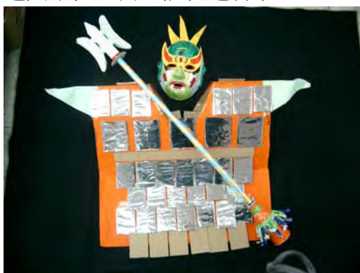
5.有了面具、沙鈴道具！當然還要服裝 ，等我上了舞台，哈哈！保證您大吃 一驚喔！