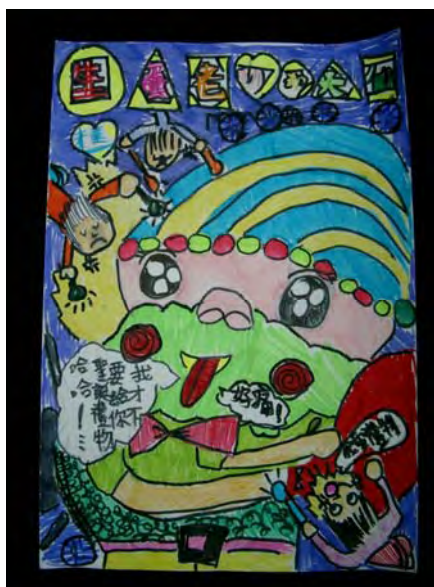
7.時代不同囉-----「生蛋」「聖誕」大仙魁仔是一定要出現的啦！