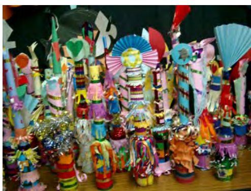
3.彩飾沙鈴樂趣多課程中----- 藉由聲音的探索，我們演出的 道具不但豐富且能製造音效喔！