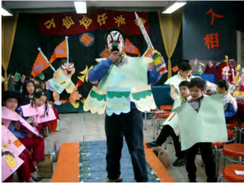
13.配合雄壯的音樂曲調，再看看我英勇的神情，沒錯，我就是無敵的「大將軍」！