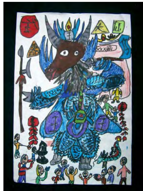
4.當各路神明出巡，「大仙魁仔」常在神轎兩側護駕，您覺得我適合擔任哪位神明的左右手呢！