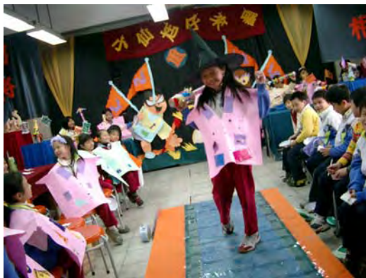
17.哎呀呀！大仙魁是傳統廟會出現的神將，怎麼連「巫婆小仙魁」也來呢！