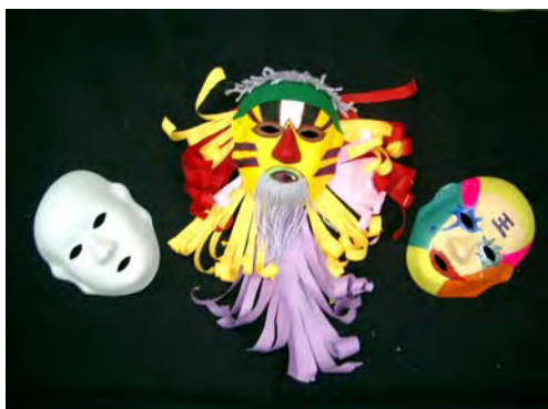
1.我的仙魁 10°C 課程學習 -----由面具彩繪至配合角色演出 ，我們的偉大計畫正要開始喔！