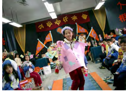
14.搭配輕鬆的音樂聲----我呢，可是比名模「林志玲」還受歡迎呢！