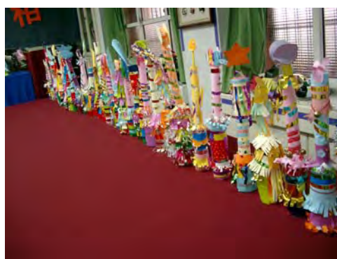
4.演出時，你是將軍，我是仙女，究 竟誰較厲害，讓我們比一比就知道 了！