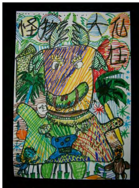
6. 您可別看我長得醜喔，我可是變身「大仙魁」！打擊犯罪，伸張正義是我的最愛呢！