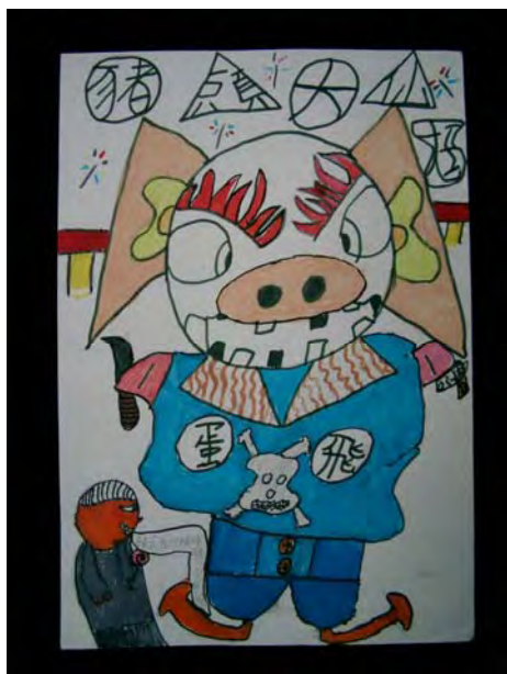
5.老師說：大仙魁仔常結隊出現，好吧！讓我們組個「豬頭」大仙魁仔陣如何呀！