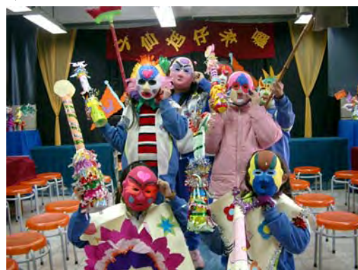
6.老師，我們都準備好了，何時才能演 出呀！