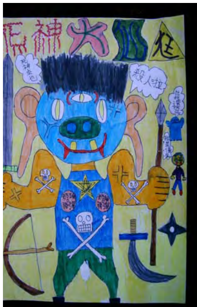
3.就是我-----死神大仙魁！相信閻羅王一定會聘請我！