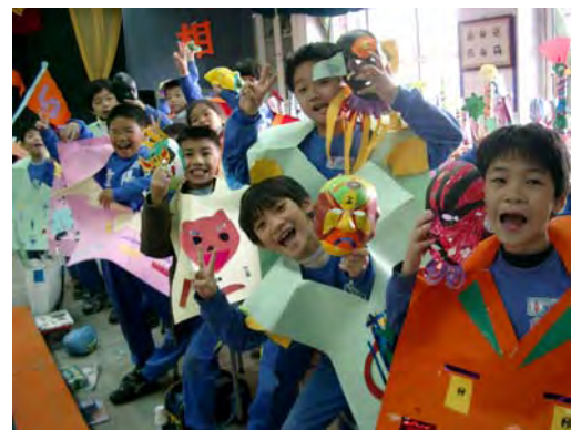
18.表演雖然結束了，但是我們都覺得意猶未盡，老師您就讓我們再表演「一次」嘛！