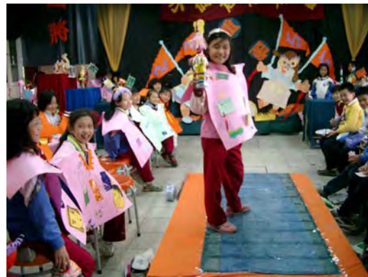
16.老師說，搭配音樂氛圍，可以選擇表演雄壯、端莊、趣味搞笑等不同型態，您猜猜----我屬於哪一型呢？