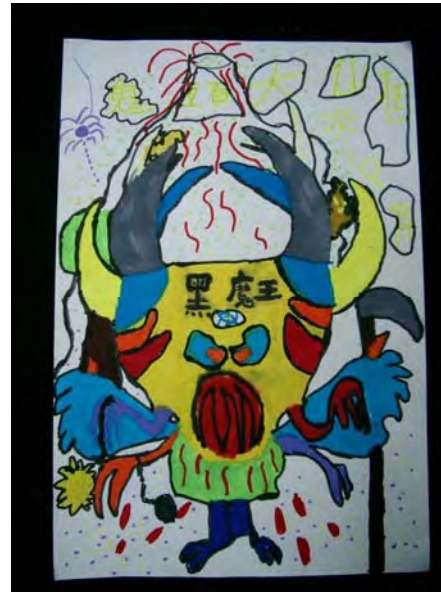
2. 老師說:大仙魁是由「拚場」而來，看我的長相，就知道我的厲害！誰敢跟我一比高下呢？