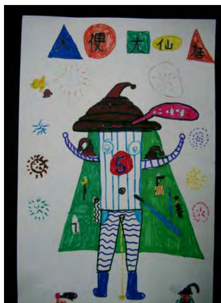
8.唉呀，來個「大便大仙魁仔」，不知道大家會不會歡迎我呢！