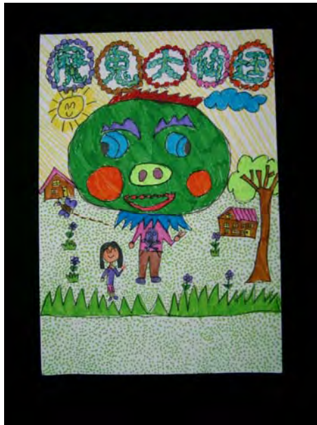
1. 傳統大仙魁仔，常是神的護衛 ----廟會時我如果出現，不知會如何！