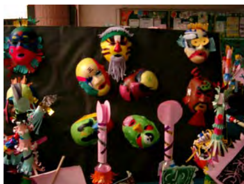
2.配合藝術節的展出，讓我們學習更 用心，還有，您猜得出我們將扮演的 的角色嗎？！