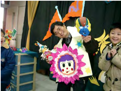
15.嗯！人家不好意思嘛！？ ----老師，我們表演的比你好，你快點下台吧！