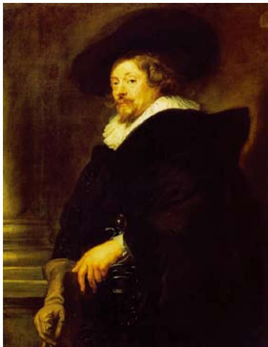
自畫像 (Self-portrait) 約1638-1640 畫布上油彩 109.5×85cm