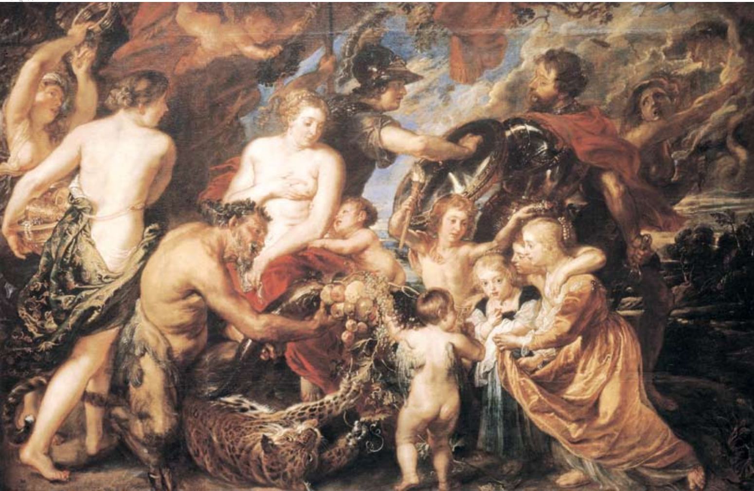
戰爭與和平 (Peace and War) 1629-1630 畫布上油彩 203.5×298cm