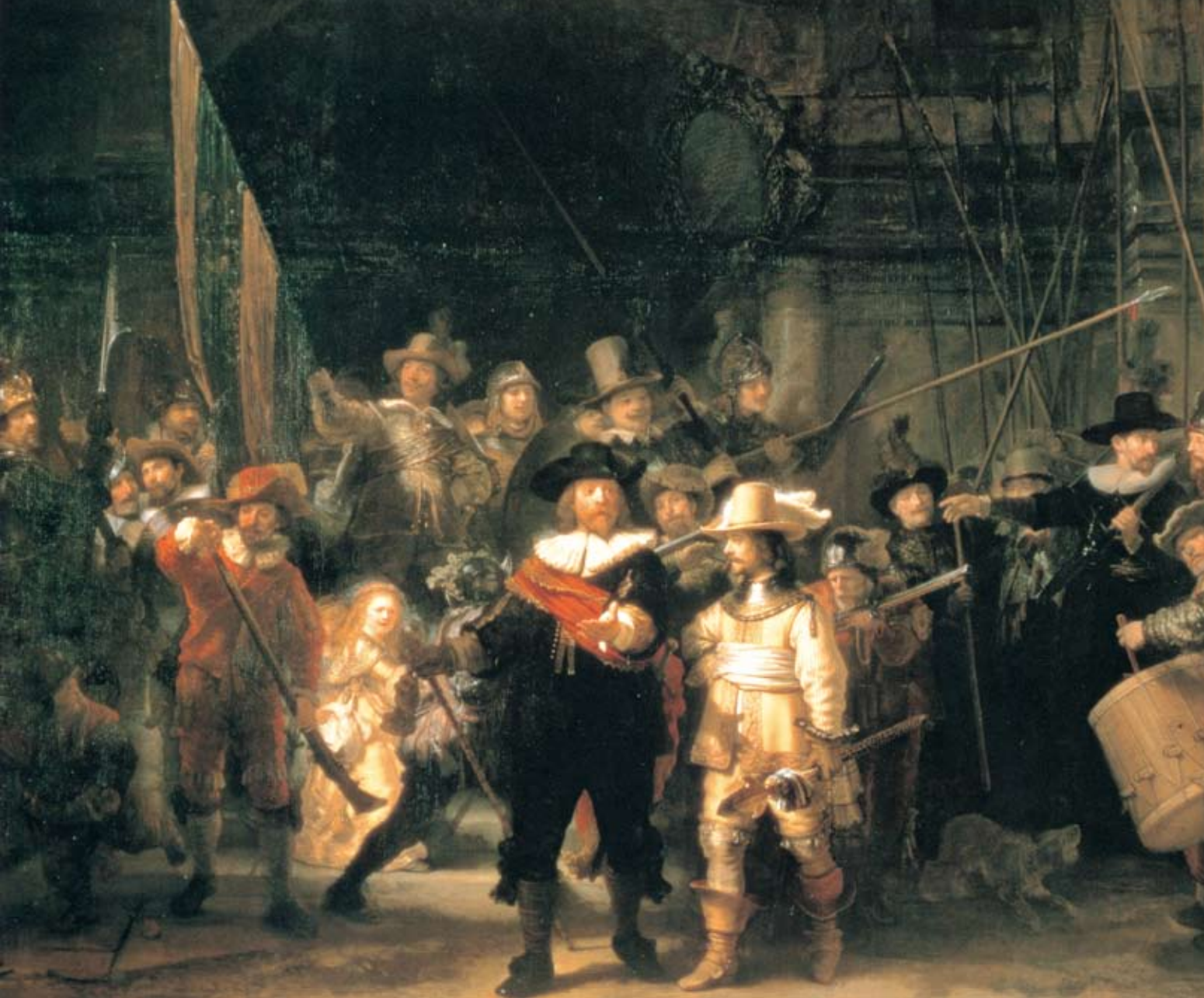
夜巡 (Nightwatch) 1642 画布上油彩 363×437cm © 阿姆斯特丹国立博物馆

Shui Huang ● Chi-Chun Liao ● Paul Rubens ● Rembrandt Harm 18 ● Chi-Chun Liao ● Mei-Shu ns ● Rembrandt Harmenszoon v Huang ● Chi-Chun Liao ● Mei Rubens ● Rembrandt Harmensz