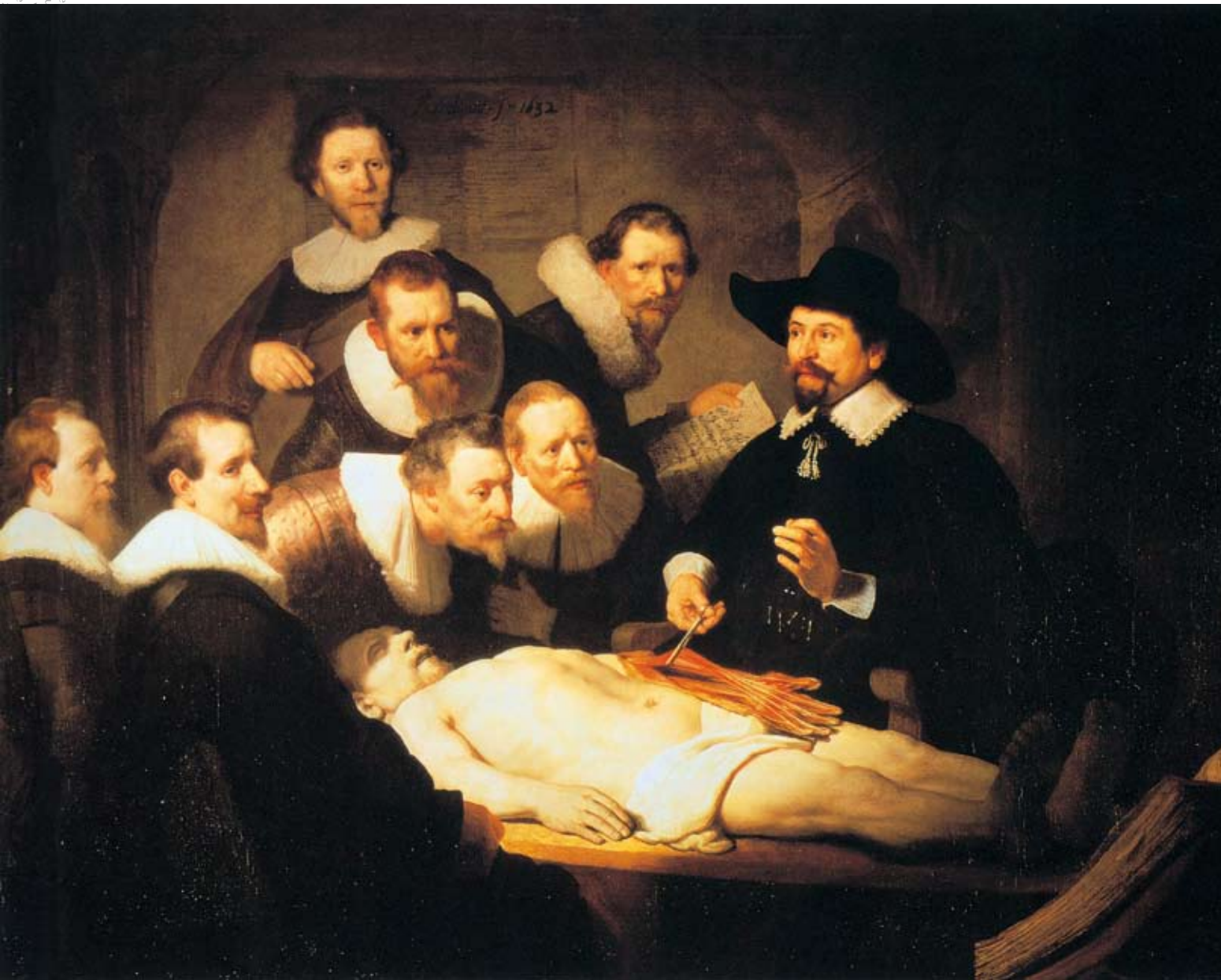
杜爾普博士的解剖課 (The Anatomy Lecture of Dr. Nicolaes Tulp) 1632 畫布上油彩 169.5×216.5cm