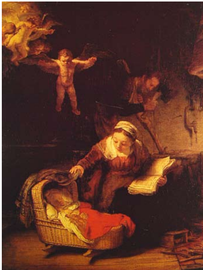
聖家庭 (The Holy Family) 1645 畫布上油彩 117×91cm

一種新的、專屬於自己的獨特風格。畫中鋪張的戲劇性大場面，也漸漸消失，取而代之的，是儉樸的場景；其中捕捉的往往是發人深省的時刻以及人物內在的心靈。聖經故事也不例外，就如「聖家庭」(1645年)，若非窗口飛進來的天使，我們幾乎會認為這是一幅風俗畫，描繪卑微家庭相依為命的景象，質樸純淨，但卻深刻動人。落魄的晚年時期，林布蘭的繪畫越發顯得深沈莊嚴，愛、懺悔、寬恕等寶貴的人性特質，往往取代特定事件，成為作品的真正主題。他的「光影魔法」因此也不再僅是強化了視覺效果，更映照出幽微又深刻的情感與人性的深度，同時，也勾勒出一個洞察人生而永垂不朽的藝術靈魂。達文西所說的「藝術家無時無刻地在畫自己」這句話，在此再次地迴響。