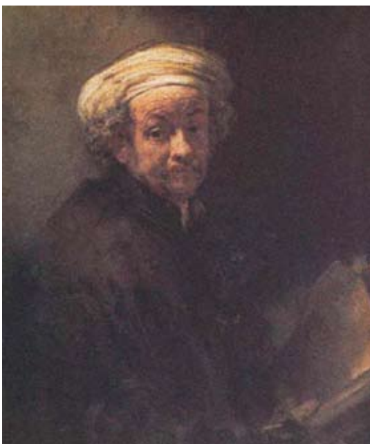
扮成聖保羅的自畫像 (Self-Portrait as the Apostle St Paul) 1661