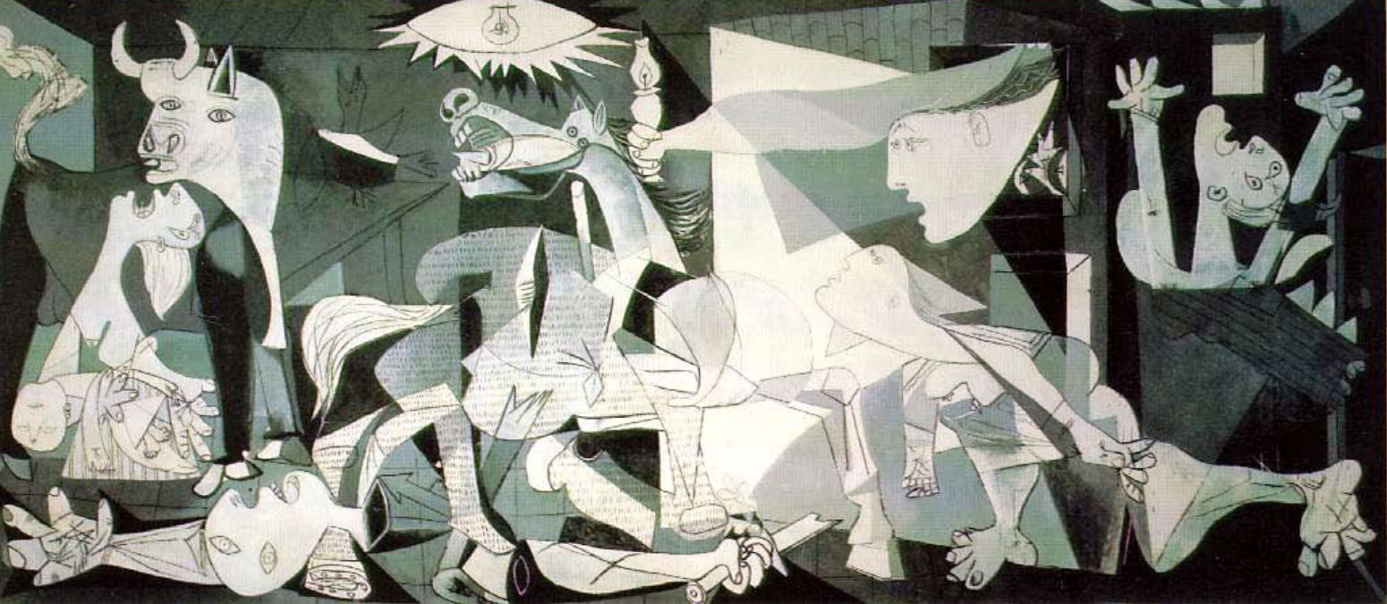
格爾尼卡 (Guernica) 1937 349.3×776.6cm