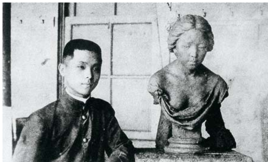
少年黃土水已展露雕塑才華