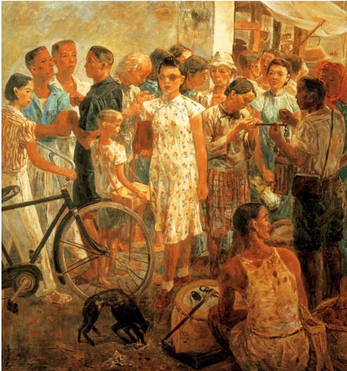
市場口 1946 油畫 157x146cm