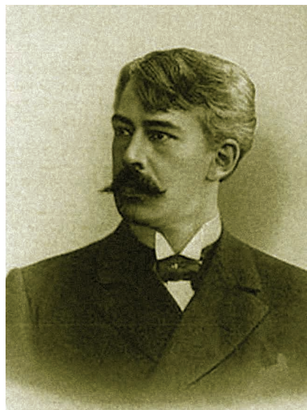
年輕時的史氏。