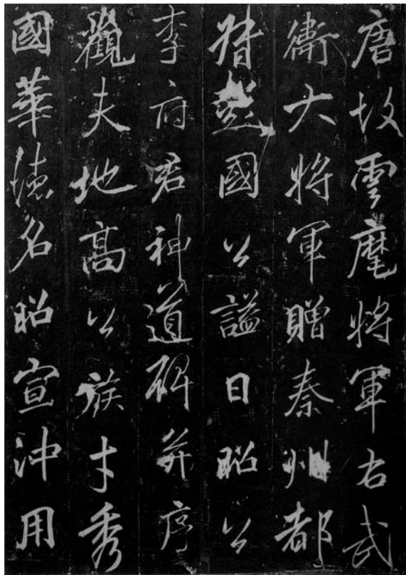
圖四 李邕〈雲麾將軍碑〉

林：「再拿眼前的例子作說明，最近印林泰斗王北岳先生（1926—2006）（圖五）不幸仙逝，北岳先生在書法篆刻方面造詣之高有目共睹，藝壇大夥兒都對他懷念不已。多年前他曾告訴我一段往