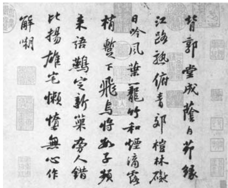
圖二 蘇東坡行書手卷