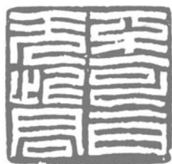
圖五 王北岳篆刻作品 〈不可一日無此君〉