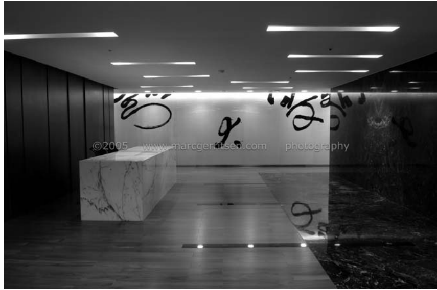
圖七 長廿五公尺、高兩公尺半的「書法長廊」完成後現場（一）（約1/4局部）