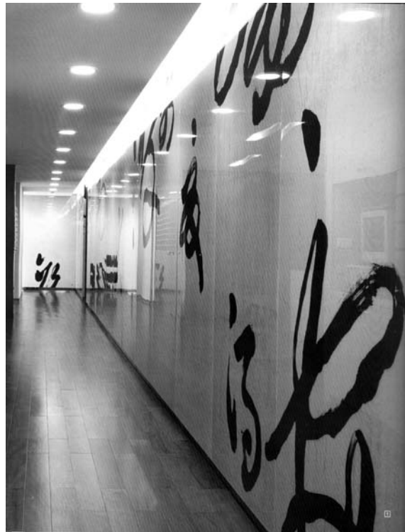
圖八 長廿五公尺、高兩公尺半的「書法長廊」完成後現場（二）（約1/4局部）