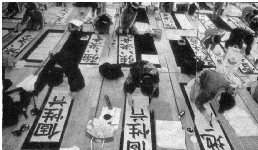
圖四、圖五 寓體育、遊戲及書法為一體的日本小學生現場比賽，小小年紀已見大書法家的氣勢。