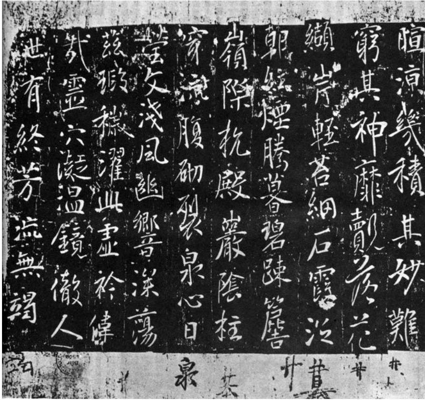
圖二 唐太宗《溫泉銘》