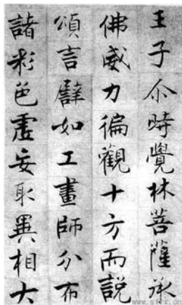
圖一 南宋張即之《大方廣佛華嚴經卷第六十五》