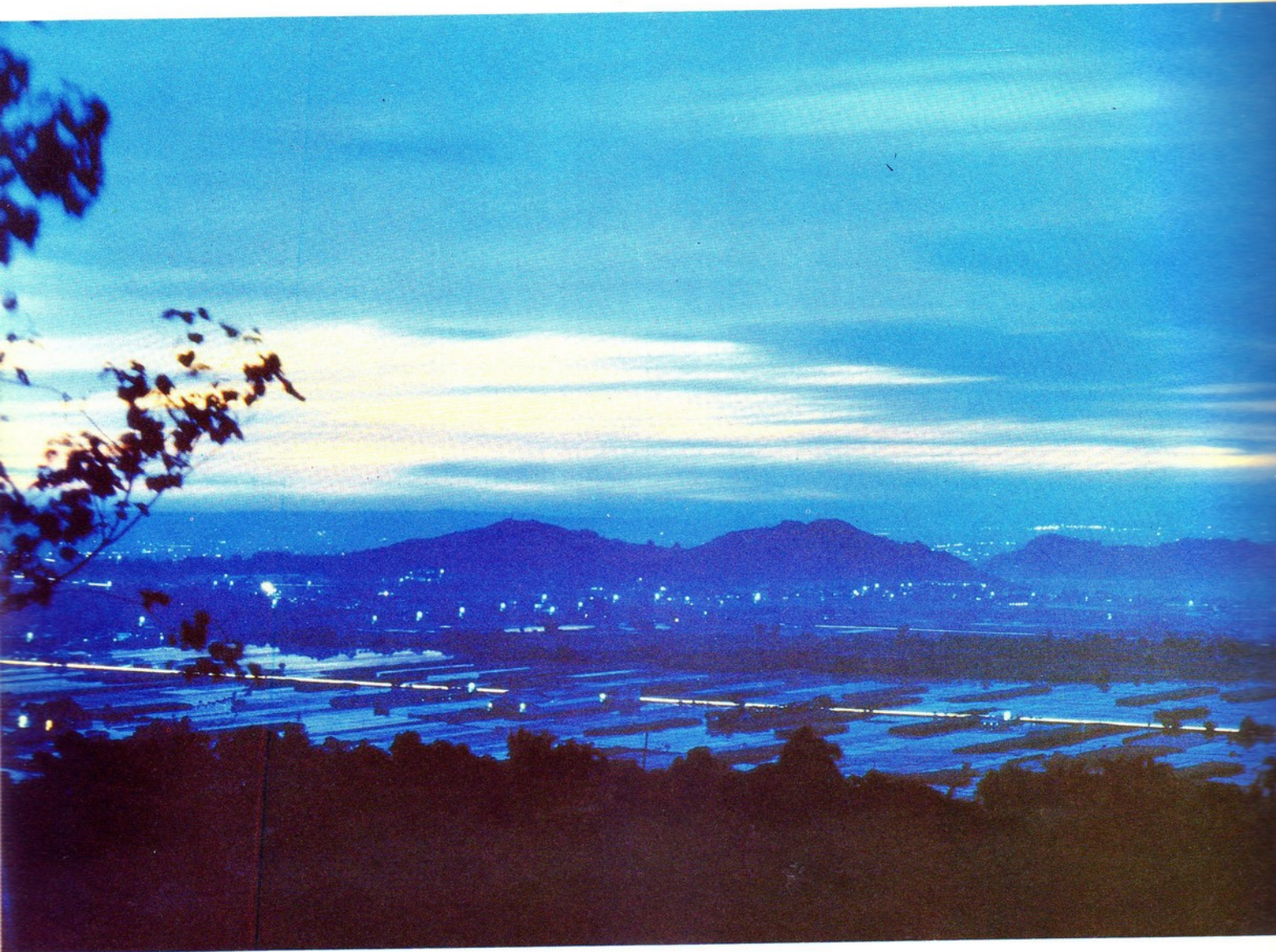
一抹餘暉撩夜幕 攝影佳作 梁正育