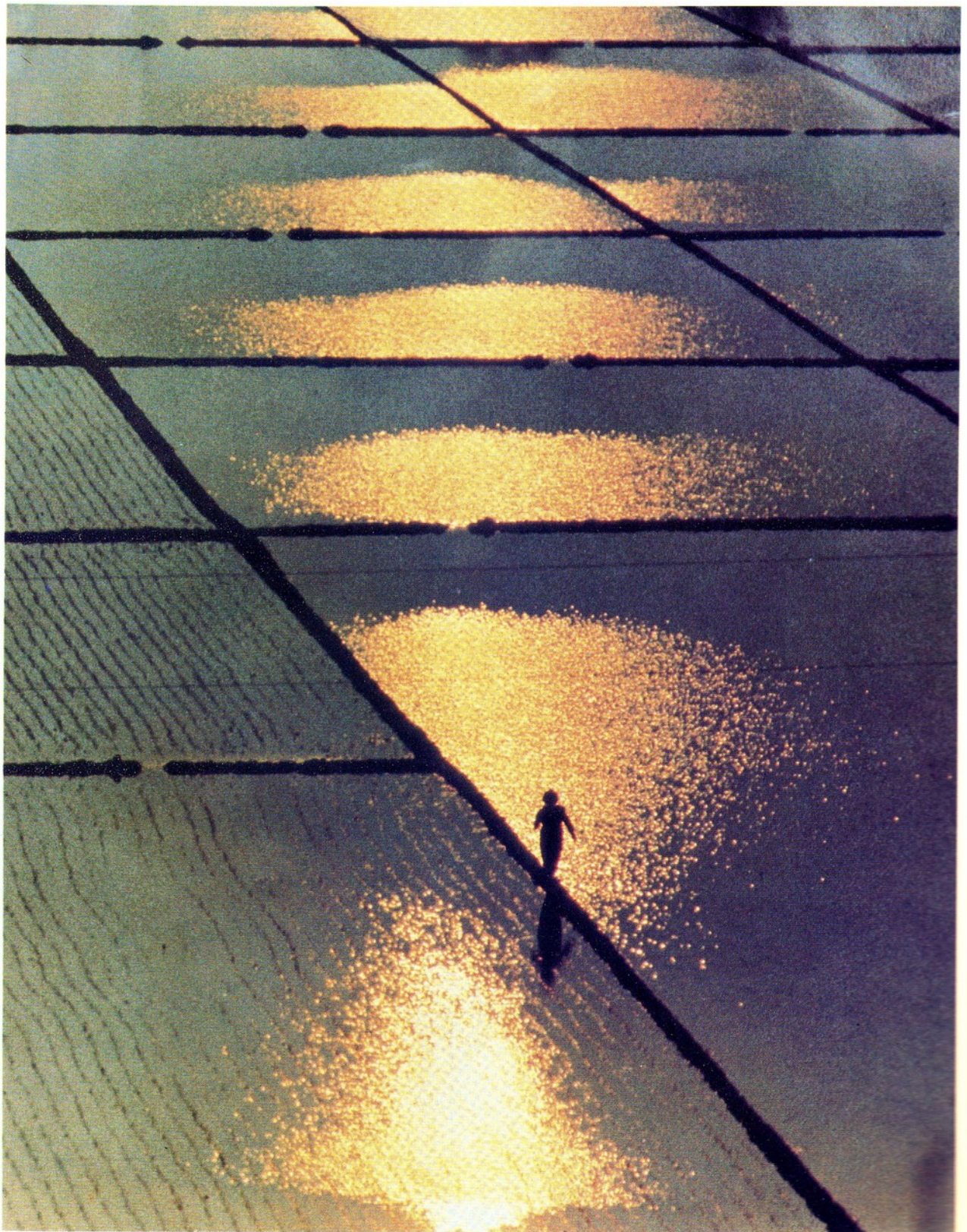
農田景觀 攝影第二名 洪宏榮