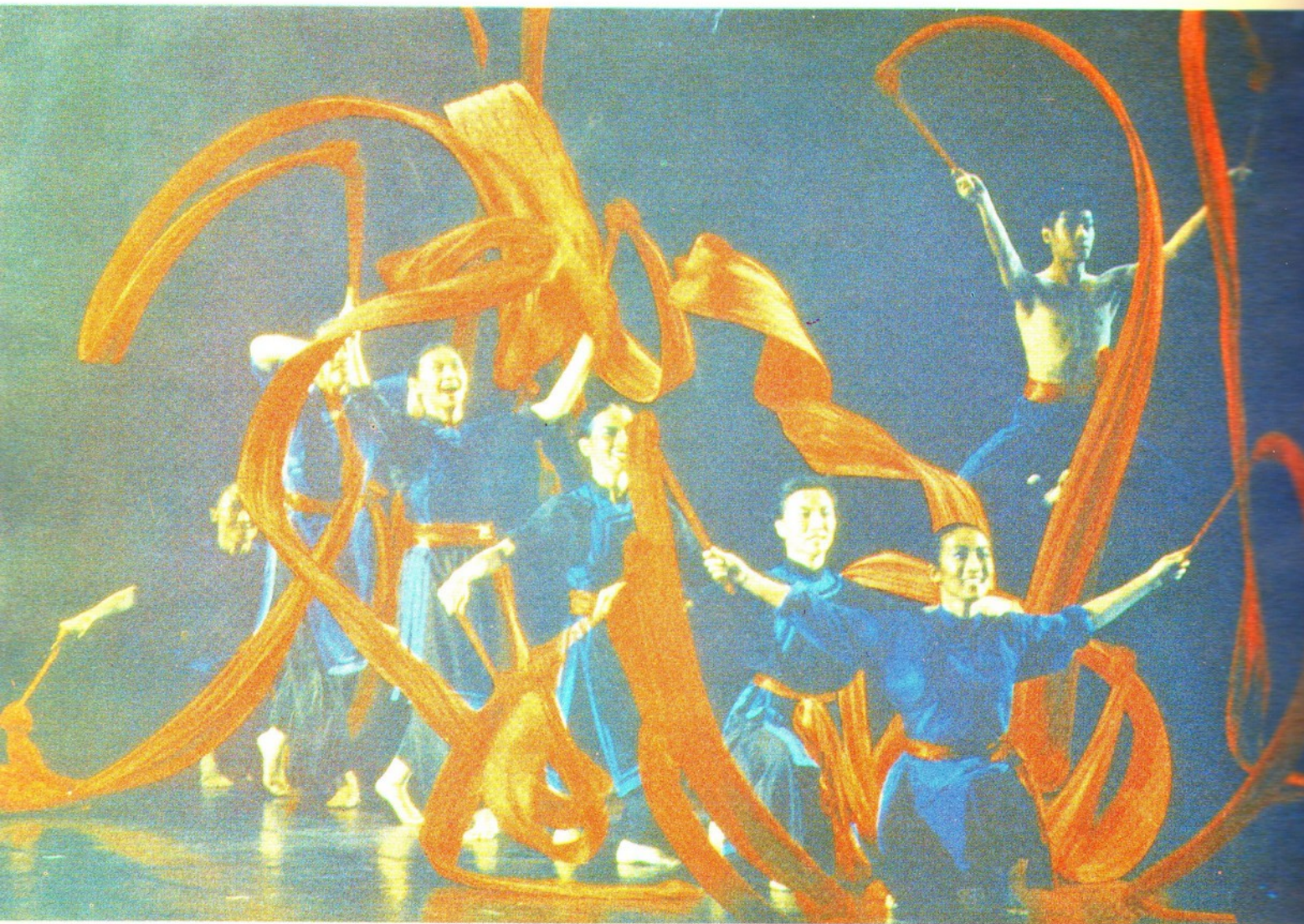
薪傳 攝影佳作 洪明政