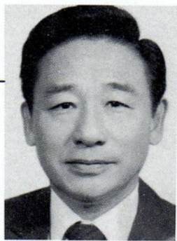
評審委員 凌嵩郎先生

江蘇省江都人，國立台灣師範大學藝術系畢業，現任國立台灣藝術專科學校校長。著有「藝術概論」、「中國美術發展史」、「中國美術的精神表現」等書。