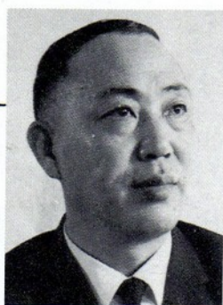
評審委員 傅佑武先生

江蘇省江都人，國立台灣師範大學藝術系畢業，現任國立台灣藝術專科學校校長。著有「藝術概論」、「中國美術發展史」、「中國美術的精神表現」等書。