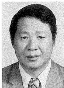
莫洛夫先生（召集人）

筆名洛夫，湖南衡陽人，淡江大學英文系畢業，曾任教東吳大學外文系，亞盟總會專門委員。一九五四年與痲弦、張默共同創辦「創世紀」詩刊，並歷任總編輯迄今。作品被譯成英、法、日、韓等文，並收入各大詩選，包括「中國當代十大詩人選集」、「中國新文學大師名作賞析」。出版詩集有「石室之死亡」等十五部，散文、評論、翻譯等十四部，另在大陸出版詩集三部，散文集一部。其詩作曾獲國家文藝獎，中山文藝獎，吳三連文藝獎，中國時報文學推薦獎。此外，「詩魔的蛻變——洛夫詩作論集」已出版，「洛夫論」，「洛夫評傳」二書亦將於近期在大陸出版。