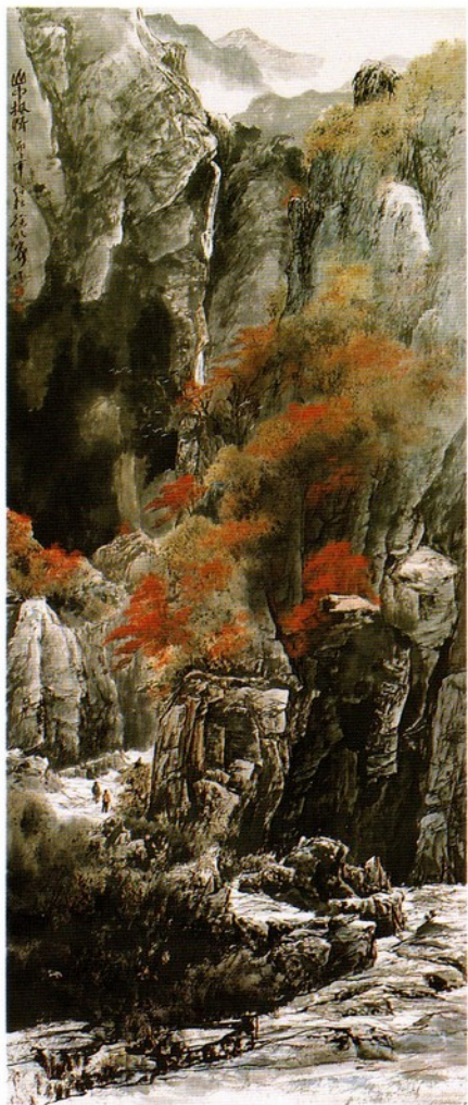
徐明寄 / 山中楓情 / 250 × 108 cm