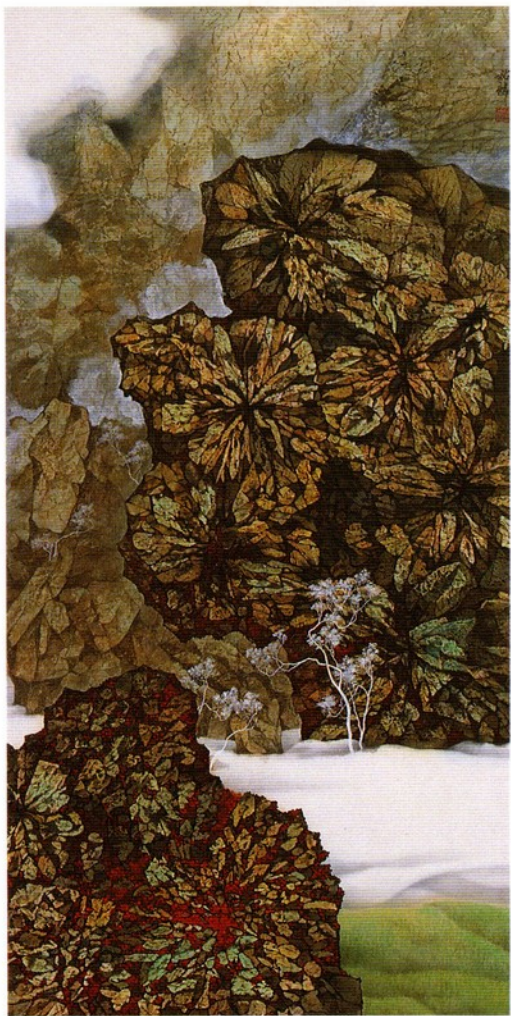
郭祐麟 / 生之颂 / 126×64.5 cm