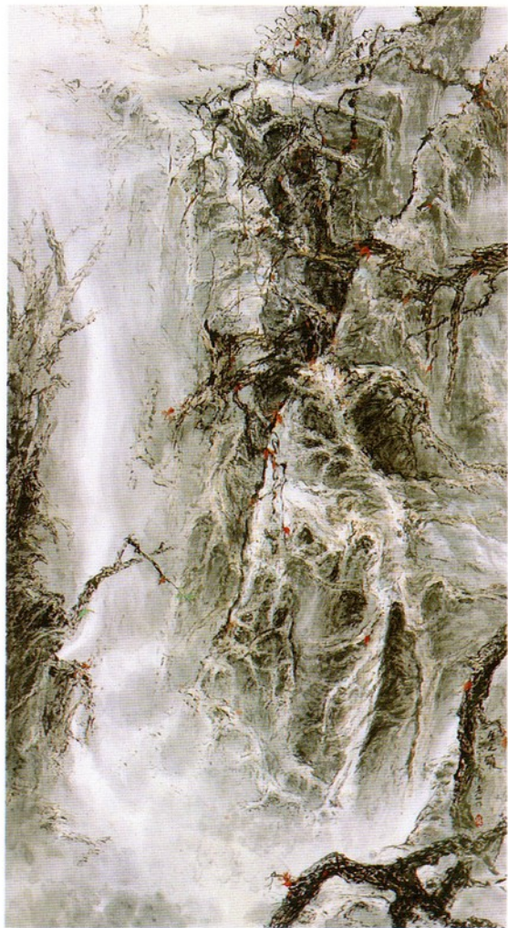
林宏山 / 生之颂 / 136 × 70 cm