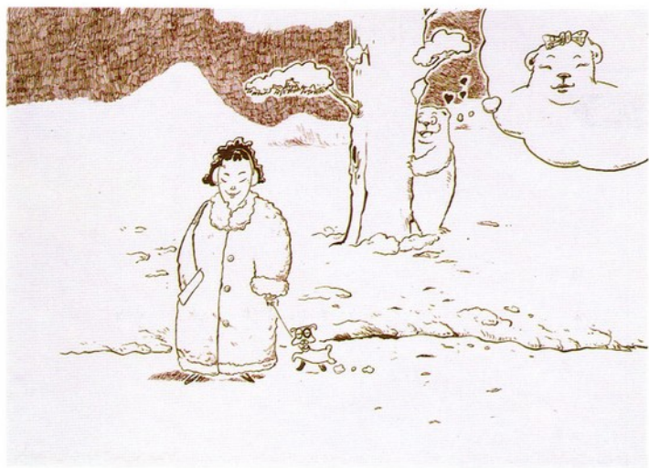
鄭俊皇／皮衣的故事（錯覺）／39×54 cm