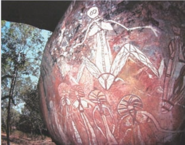
圖2-21 澳洲原住民的岩石彩繪，是部落生活與宗教信仰的圖象記錄。