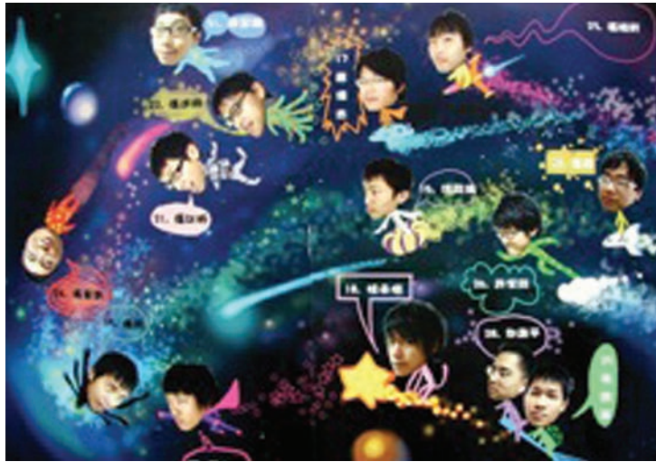
▲圖2-38 結合攝影、漫畫與電腦繪圖的創意班級介紹，展現高中青年的科幻式美學。