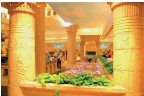
▲圖2-7 融入古埃及神殿意象的觀光餐廳，創造了埃及國際觀光文化的新視野，也是實用主義美學的實踐。

實用主義美學的誕生，不僅開啟哲學研究的新視野，同時也帶動二次戰後藝術創作、藝術教育、藝術傳播與藝術商品化的時代風潮。從德國包浩斯的建築與工業設計教育，到當代五花八門的文化創意產業，我們易於見證：藝術創作者是美感符號的設計與發訊者；藝術欣賞者是美感符號的接收與享用者；而藝術推廣者透過美術館、畫廊與藝術商品行銷，則在搭建藝術家與藝術欣賞者美感情意溝通的橋樑。