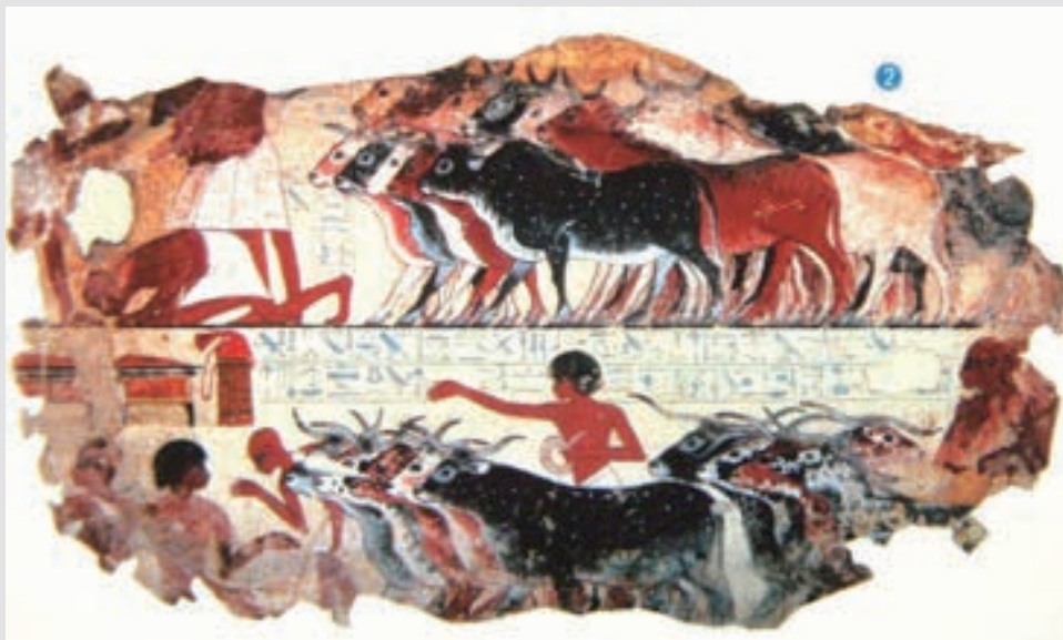
圖2-20 透過古埃及的牛群壁畫，可以感知圖像與文字均與人類生活不可分割。