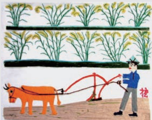
圖2-30 〈牽牛犁田〉，臺灣農民畫家蘇楊昶，彩繡，1989，60×72公分。