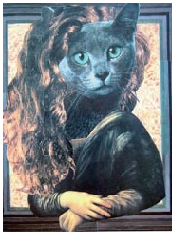
▲圖2-33 結合名畫圖象與攝影照片的蒙太奇剪接技巧，可以引為高中青年視覺藝術創意教材的新觀念。