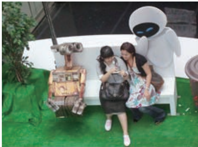
▲圖2-6 現代人的視覺傳達是人腦與電腦的視訊系統整合。

早在古希臘時代，柏拉圖與亞里斯多德兩人就將希臘美學思想發展到高峰，並對後世美學思想產生巨大的影響。十六世紀的文藝復興，美學思想在人文主義的基礎上得到新的發展。十七、十八世紀的英國經驗主義美學，把生理學和心理學的觀點融入美學中。十八世紀末和十九世紀初，德國古典美學迅速崛起，康德、歌德、席勒、黑格爾相