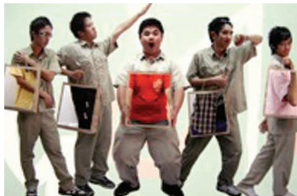
▲圖2-39 應用攝影與電腦合成技巧，拼構「全班一起去旅行」的友好意象。