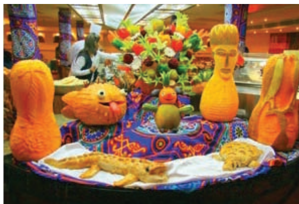
▲圖2-8 埃及尼羅河的船上餐廳，利用蔬果雕刻和動物麵包的裝置設計，展現觀光文化的創意生活美學。