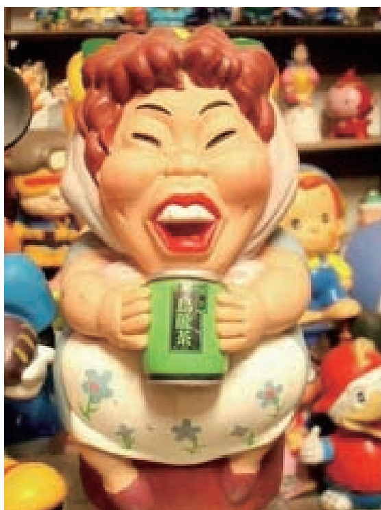
▲圖2-32 烏龍茶罐裝飲料巧妙的結合開喜婆婆公仔造型設計，是本土創意美學廣告行銷成功案例。

青少年的藝術學習難免有眼高手低的創作表現心理障礙，因此透過多元化的藝術鑑賞活動，