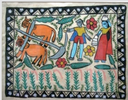
圖2-31 〈種田人家和耕牛〉，尼泊爾樸素畫家曼達拉，彩繪，38×48公分。