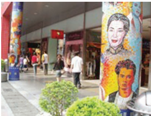
◀圖2-3 走在臺北市東區的電影街，彩柱、櫥窗、招牌與商品，不停的散發出文化的訊息。