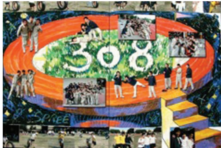
▲圖2-39 結合攝影拼貼與彩繪圖象，展現全班同學愛好運動的班風。