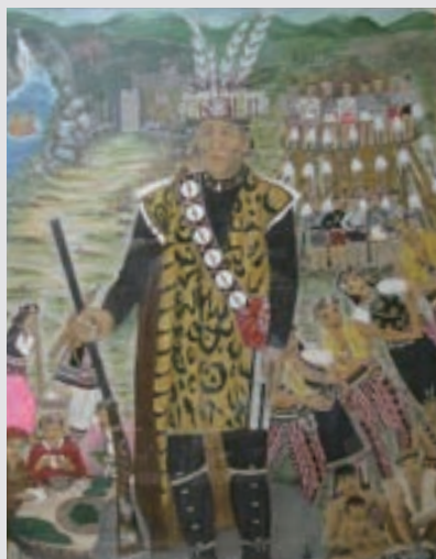
圖2-23 卑南族南群玲女士的彩繪，作品中描繪祖父擔任酋長時與族民共同傳承部落文化的記憶。