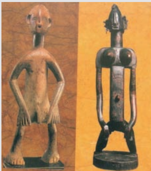
圖2-19 非洲原始部落的男女雕像，具有性別與倫理的圖象意義。