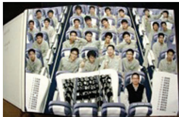
▲圖2-41 應用雙重意象的美學攝影，幽默的展現高中畢業生的穿著主張。