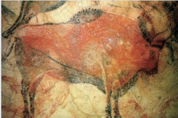
圖2-18 法國拉斯卡洞窟狩獵壁畫，是25000年前獵人與動物爭戰的文化圖像。