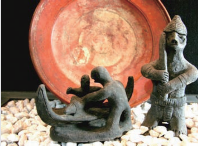
圖2-22 蘭嶼達悟族的陶偶，是成人捏給兒女的生活玩偶，玩偶作品中也涵括了達悟勇士和捕飛魚的精神圖象。