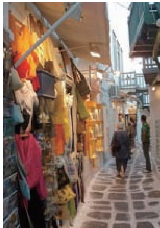
▲圖2-10 日本設計家透過冷暖色調的應用，巧妙的行銷紅白葡萄酒。