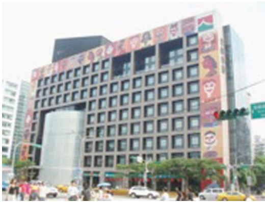
◀圖2-1 行人不僅要注意馬路上的路名與交通標誌，還要觀看商家招牌和大樓建築美化設計。