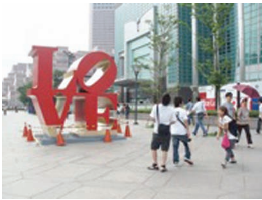
◀圖2-2 城市街道的公共藝術也是都市人賞心悅目的地標。