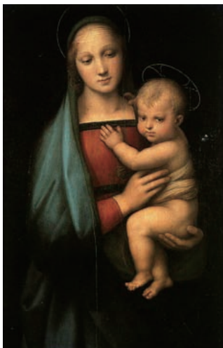
圖 2-4 參考圖例一 聖母與聖子