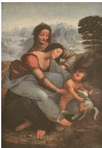
圖 2-5 參考圖例二 岩石間的聖母