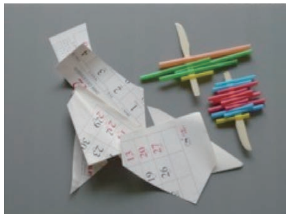
圖 2-3 作品實例三 〈心橋〉