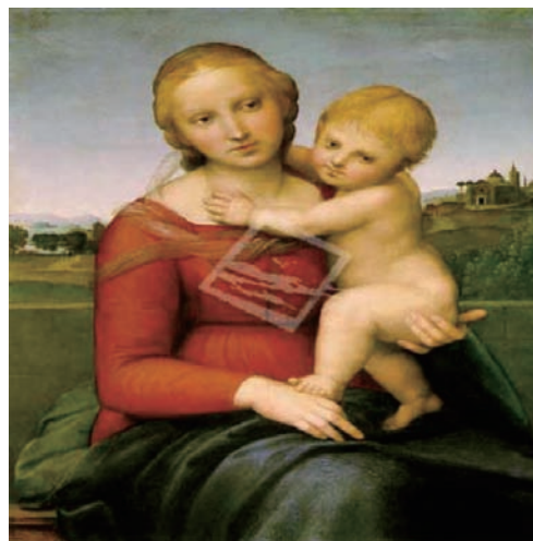
圖 2-6 參考圖例三 母與子