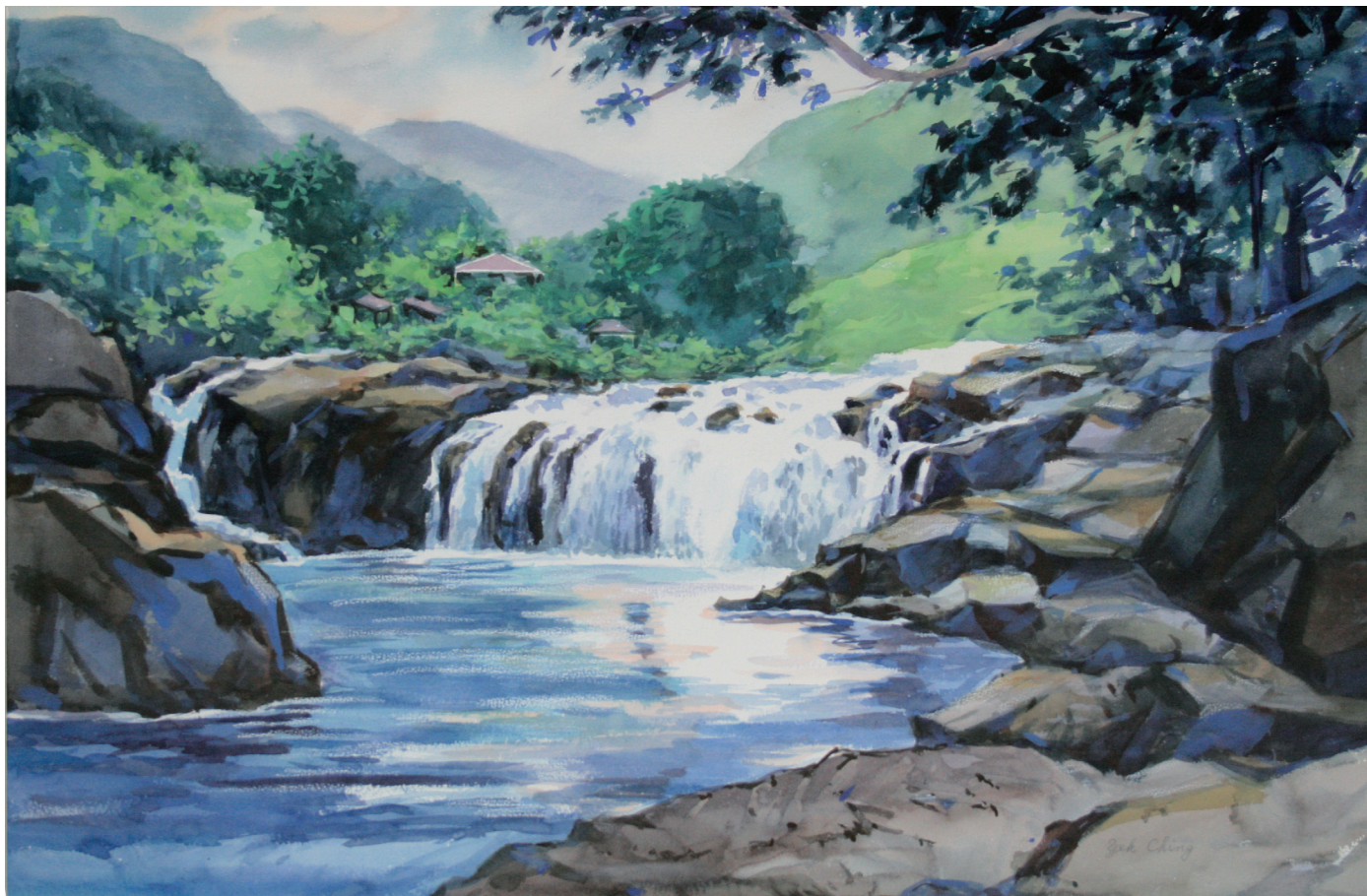
寧靜 Tranquility 54×78公分