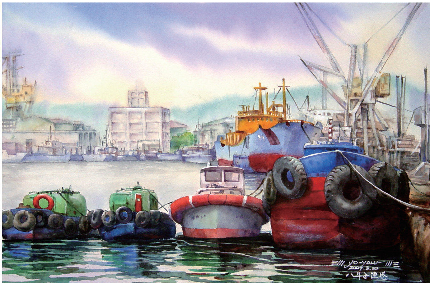
船解 Fishing Baot 39×54公分