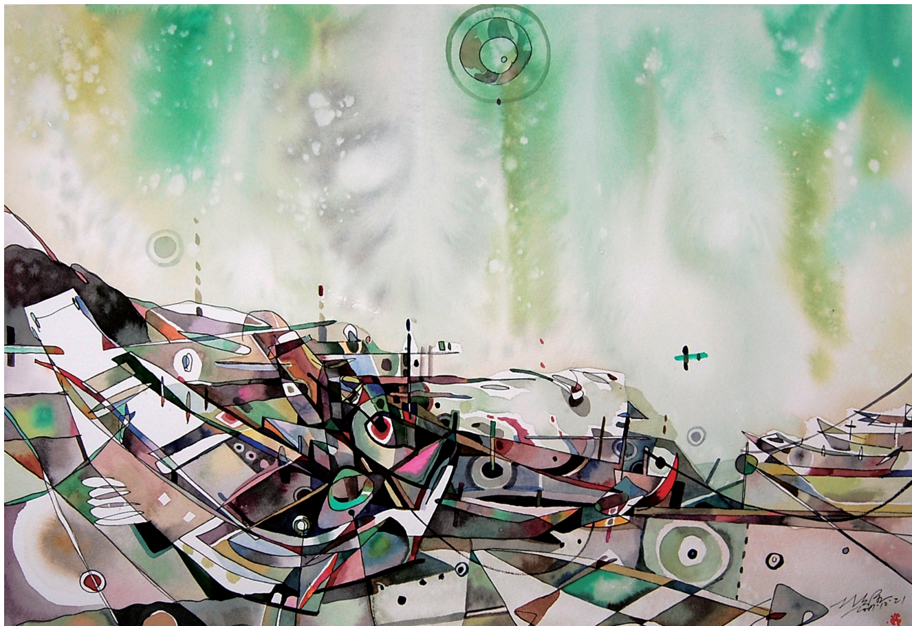
淡水實驗2 Tamsui Experiment 2 41×57公分