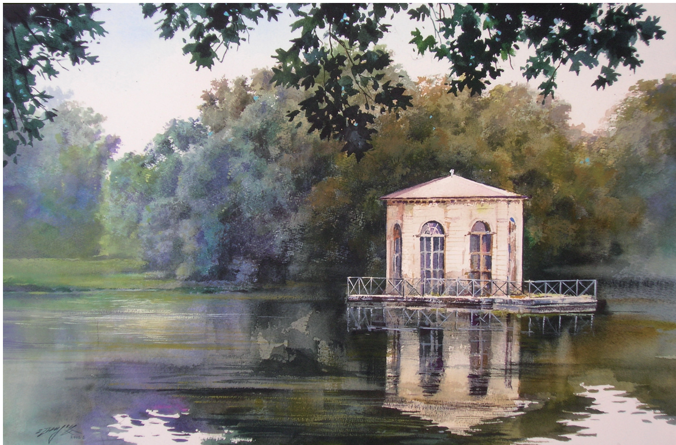
寧靜湖畔 The Peaceful Lake 38×56公分