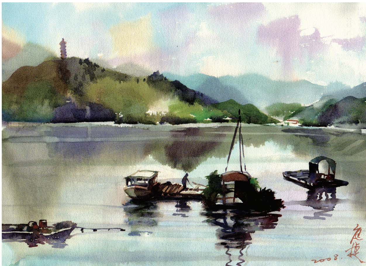
晨間靜靜的湖水 Tranquil Lake in the Morning 37x54公分