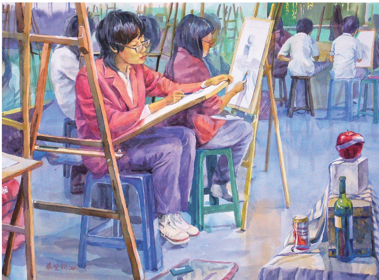
學畫的孩子 A Child Learning Painting 54×73公分