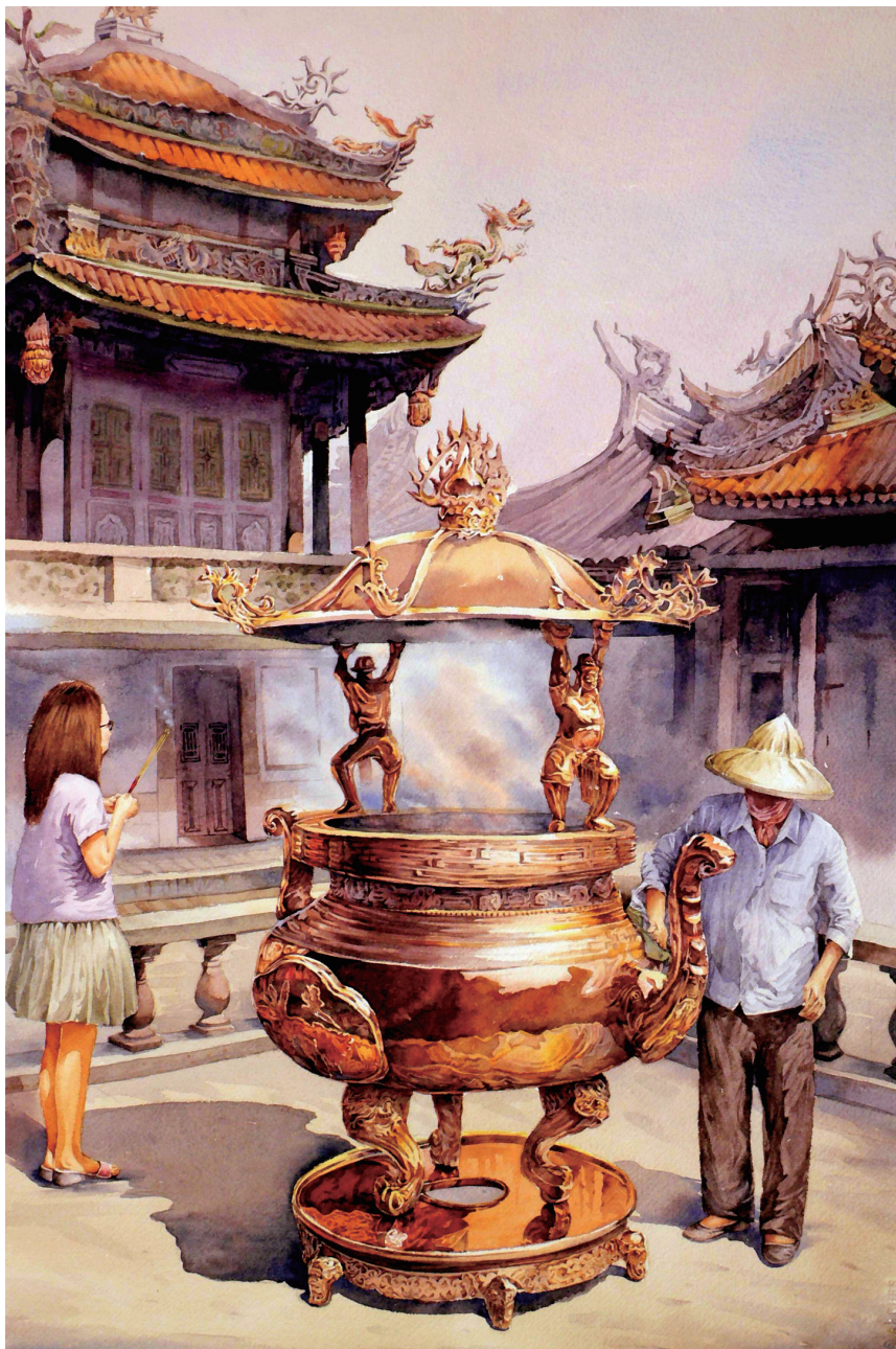
龍山寺 Lung-Shan Temple 54×38公分