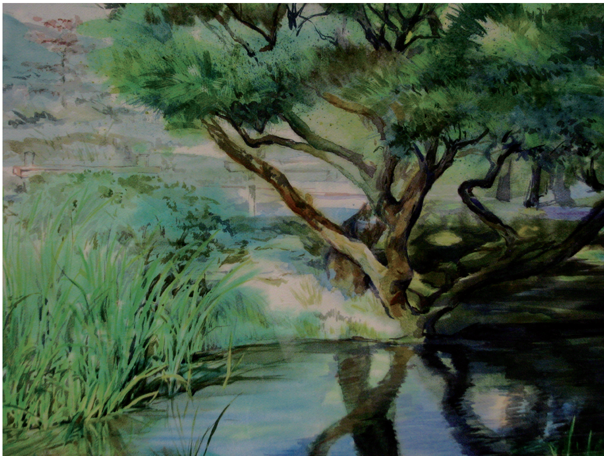
夏之兼六園 Kenroku-en Garden in the Summer 76×106公分