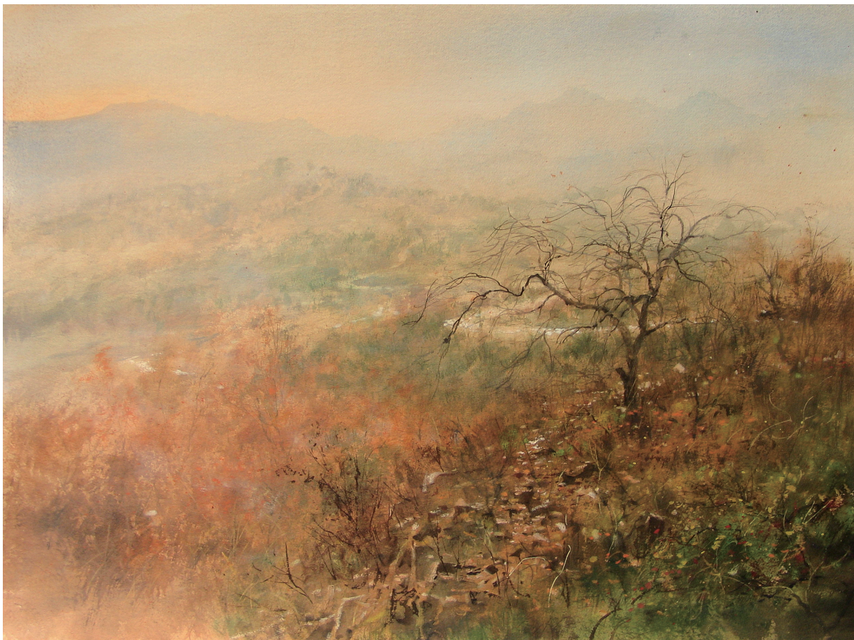
寂 Silence 56×74公分