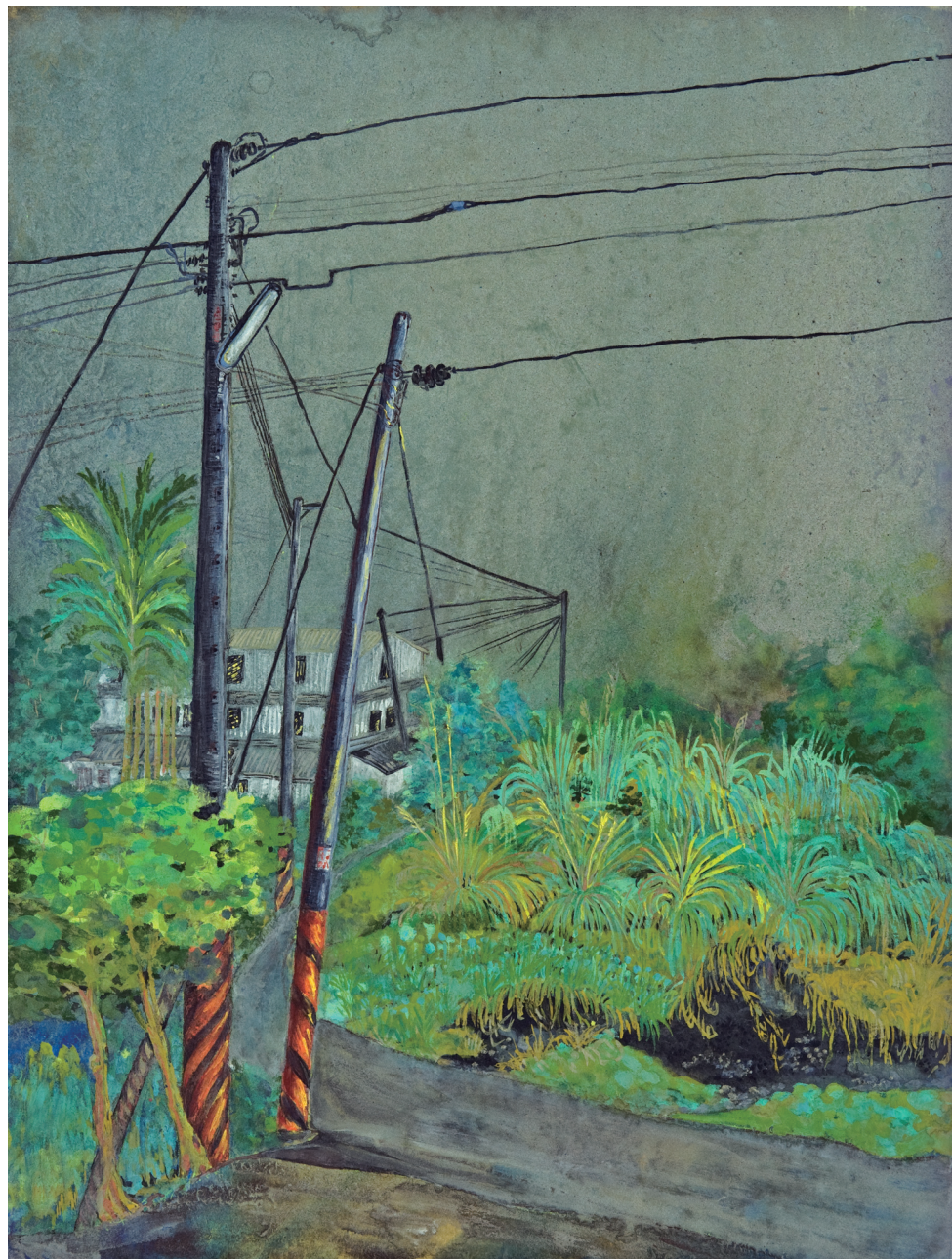
鄉間小路 Country Road 60.5×45.5公分

家一對筆者有著牽引與沉澱作用。鄉間和風徐徐吹來，熟悉的青草香喚醒思緒；荒地上的雜草沒有因為阻礙而放棄生存動力，轉而在夾縫中求生存，累積能量撥雲見日。期許自己的生命亦能如不知名的勁草，爭取生命該有的精采。