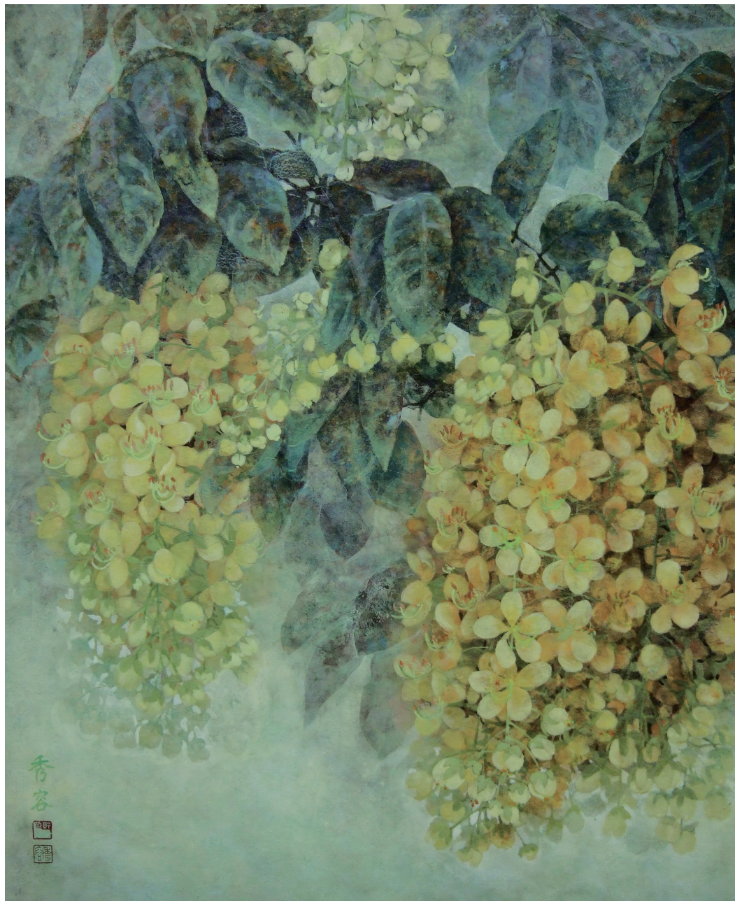
青春之歌 Song of the Youth 72.5×60.5公分