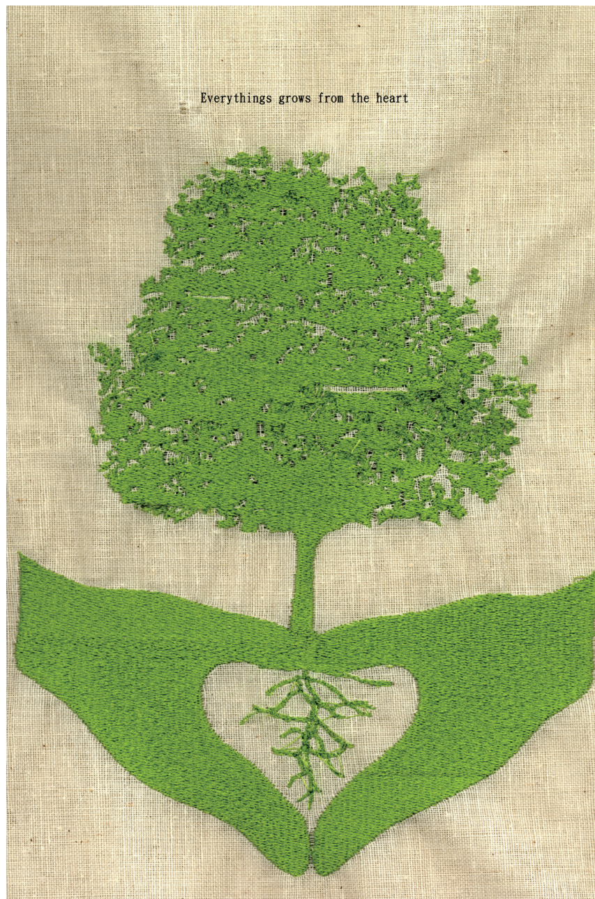
萬物由心起 Everthing Grows from the Heart 96×68公分

人的心，就像植物的根，當根扎穩了，樹葉就會繁茂，當心茁壯了，萬事就能備足、開散枝葉。因此，心靈的教育是最重要也是最根本的，就像樹的根。教育應該從最基礎的根做起，首重心靈教養，讓每個小孩的童稚之心在老師雙手的教養下，從根本茁壯為頂天立地的大樹。本作品為展現視覺的溫暖質感，使用布與線作為使用材質，刺繡技法構成整個畫面，讓傳統精細的工藝技法，藉由日常生活的布線材質傳遞心靈教育的溫暖特質與重要感。