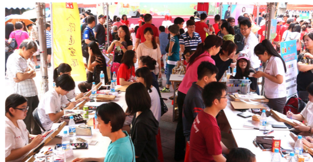
臺灣金控傳愛公益義賣暨臺銀 68 週年慶速寫服務

成立人像速寫隊、風景寫生隊，紮實學生專業基礎，擴大學生服務社會理念，實踐「以勇氣來實踐理想」內涵，每一位學生都能找到自己的特色，培養：「知識」，具有豐富人文素養；「技術」，擁有優秀專業；「態度」，具良好的品德，三大知能。