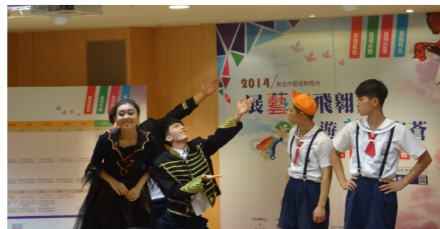
藝術教育月記者會

得獎之後，竹圍高中更確定在未來將以「藝術」為學校的發展重點，學校興建中的教學大樓、校園環境的布置、課程的規劃、社團的發展都將以藝術教育為最重要的核心目標，讓竹圍的校園中處處充滿藝術的氛圍，讓竹圍的學子們個個具備藝術的涵養，用具體的行動與作為，感謝評審團的長官對學校的支持與肯定。感恩！