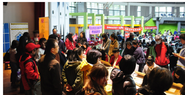
復興商工於北區美術能力鑑定考場服務

本校感謝新北市教育局、教育部及各界肯定，才能獲得此項殊榮，未來，我們必定秉持著學習科技新知、聽取各界建議及以盡心盡力的精神培育藝術人才，期盼臺灣藝術發展與成效能在世界各地備受肯定。