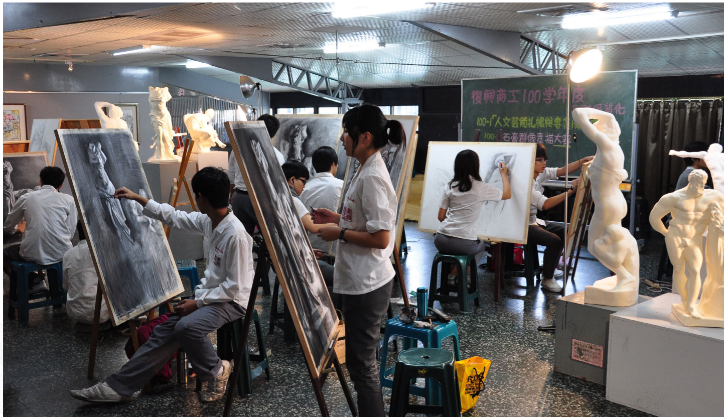
石膏群像比賽實況