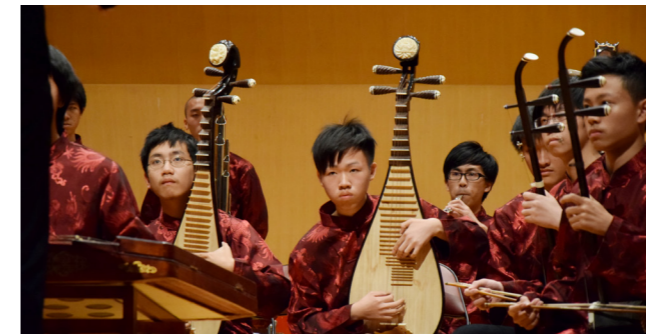
國樂社參與校慶音樂會演出