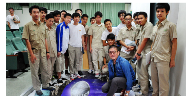
廣達游於藝「文藝復興」講座