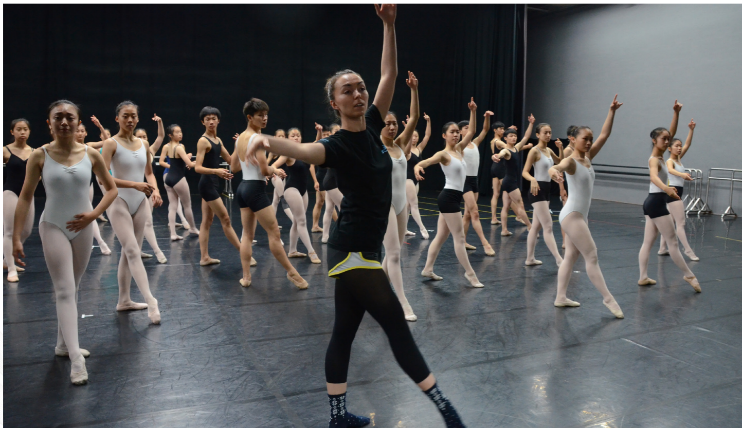
104 年法國普雷祖卡於芭蕾舞課教學