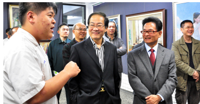
校長於高三元旦展與學生在作品前進行交流