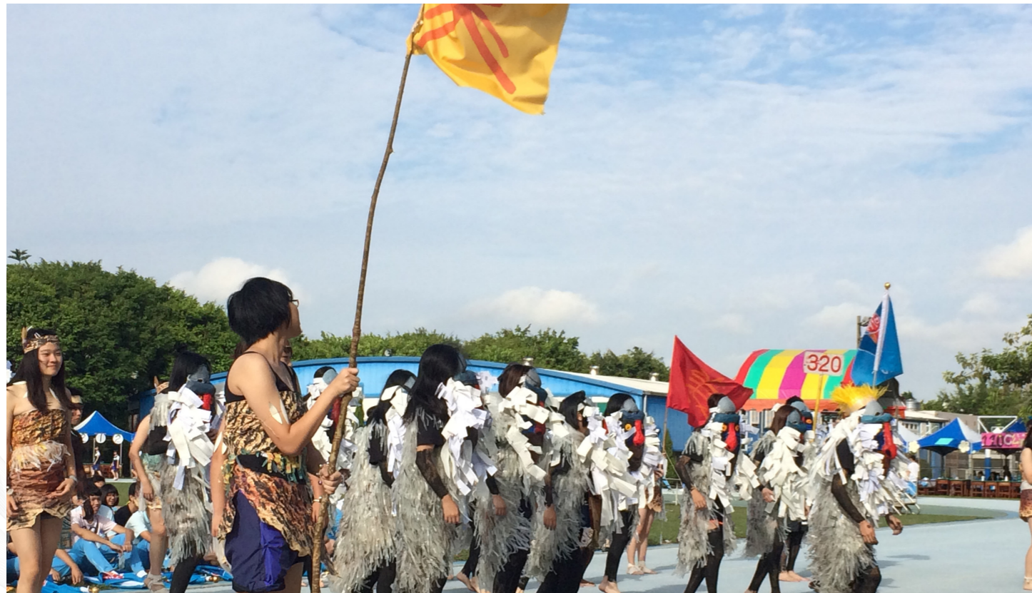
校慶運動會入場表演