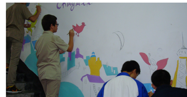
夏卡爾展的牆壁繪畫

藝術之於人，猶如雨水之於大地，其能滋養、浸潤人心，讓身、心、靈平衡發展，豐富精神生活，成就圓滿自我。本校此次能獲此殊榮，榮耀之至，師生雀躍。學校當本設校初衷，五育並進，全人發展，續以藝術教育之落實與推廣為職志，以提升地區藝術水平為目標，型塑富足、安樂且充滿藝術氣息的祥和社會。