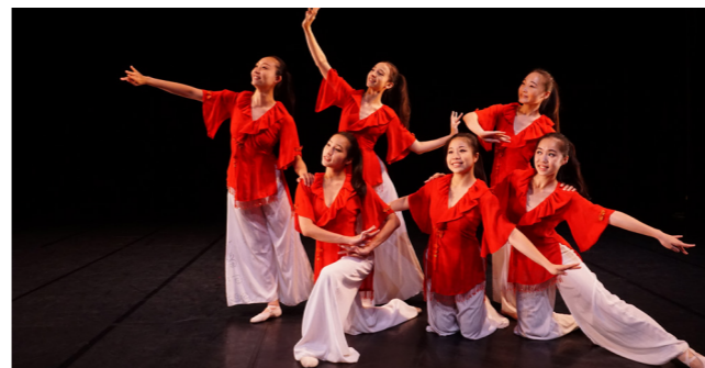
學生創作展 - 104 年 Polaris

左營高中舞蹈班今日有此成就，感謝高雄市政府教育局每年編列經費挹注，讓我們得以有基本的運作經費；感謝國內外舞蹈界前輩們長期的指導與關注，讓我們得以在舞蹈領域佔有一席之地；感謝本校家長會及舞蹈班家長們的鼎力支持，讓我們沒有後顧之憂，努力前行；感謝全校師生、社區民眾、舞蹈同好們熱情的掌聲與歡呼聲，讓我們有源源不斷的創作與演出動力。