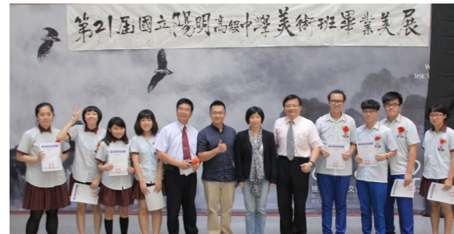
陽明美術班畢業美展

國立陽明高中美術班是桃園縣內第一所高中美術班，在教學與行政團隊的配合之下，讓陽明高中美術班的學生在學習上能有寬闊的視野，並在畢業後往各領域發光發熱。陽明高中美術班為提升學生的學習力及動機，可說是不遺餘力地舉辦各類有意義的活動，如各大專院校藝術相關科系的校外參訪、美術館展覽活動、校外教學、講座活動、美術展覽或是邀請表演……等等。陽明高中的學生受到這樣的養分之後，面對未來皆具有熱情挑戰的奮發力，未來皆能在各領域綻放光芒，這也是陽明高中美術班團隊所希望培育，對藝術領域有持續探索力，且熱情洋溢的陽明人！