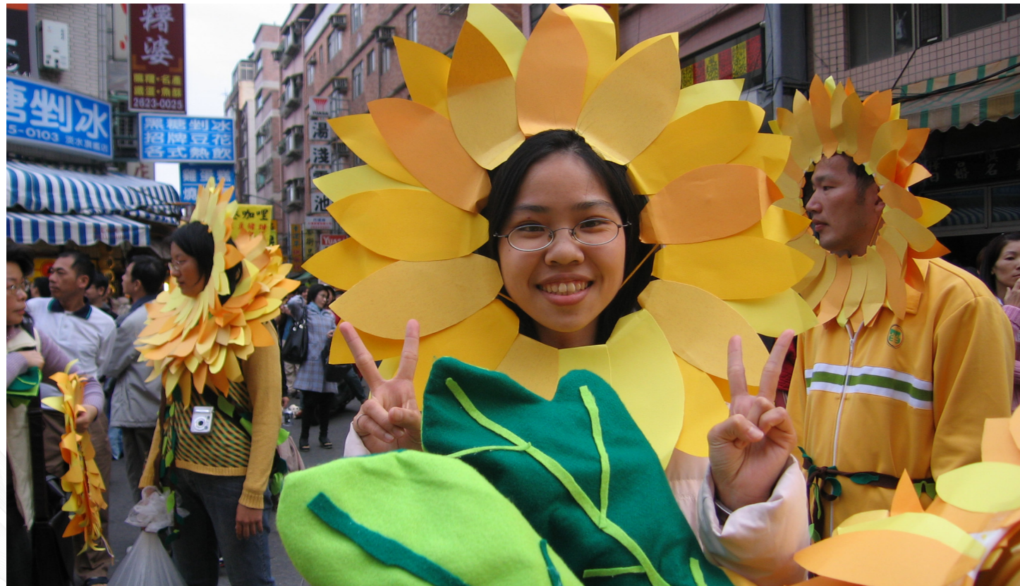
淡水藝術踩街造型