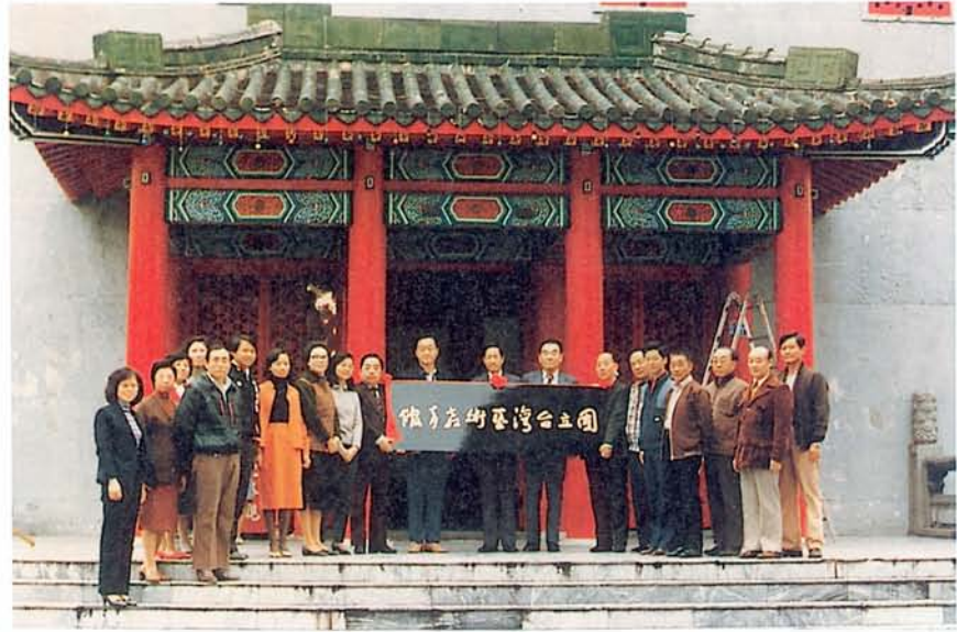
國立台灣藝術教育館 組織條例完成立法 舉行掛牌典禮合影