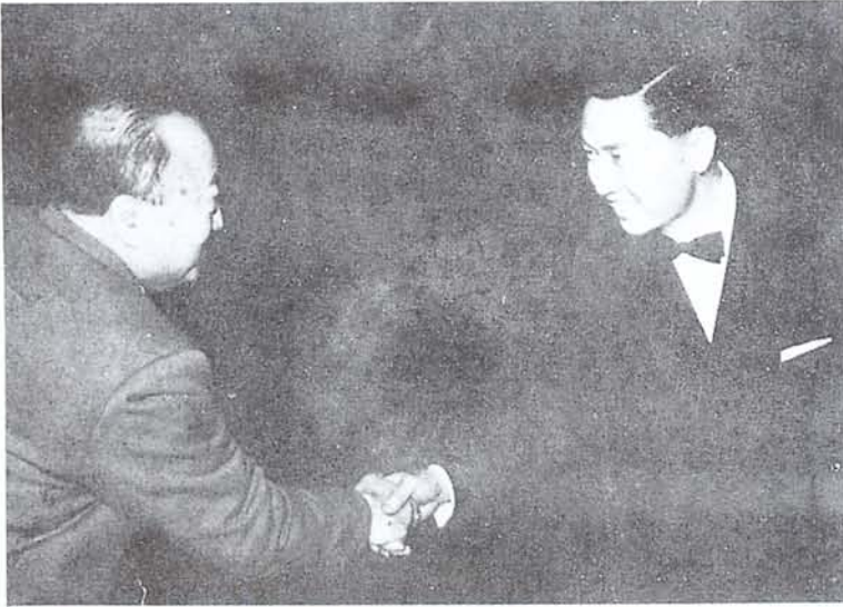
教育部黃部長季陸先生 巡視本館