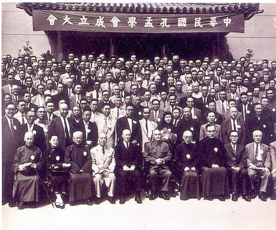
孔孟學會在本館開成立大會