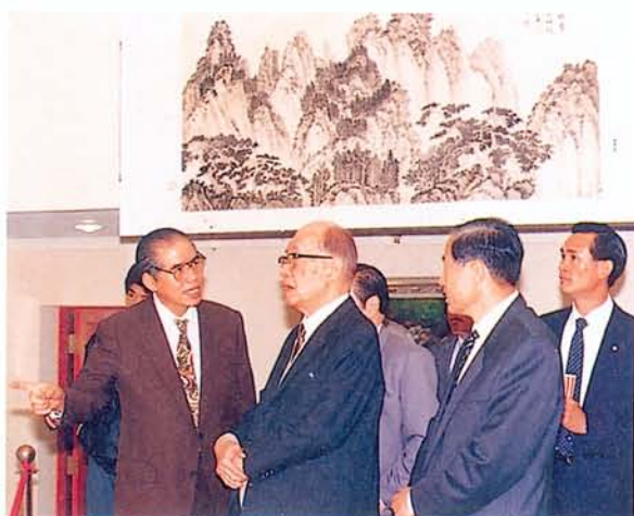
謝資政東閣先生 蒞館畫廊參觀