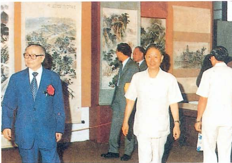
教育部朱部長滙森先生 蒞臨本館巡視全國美展會場