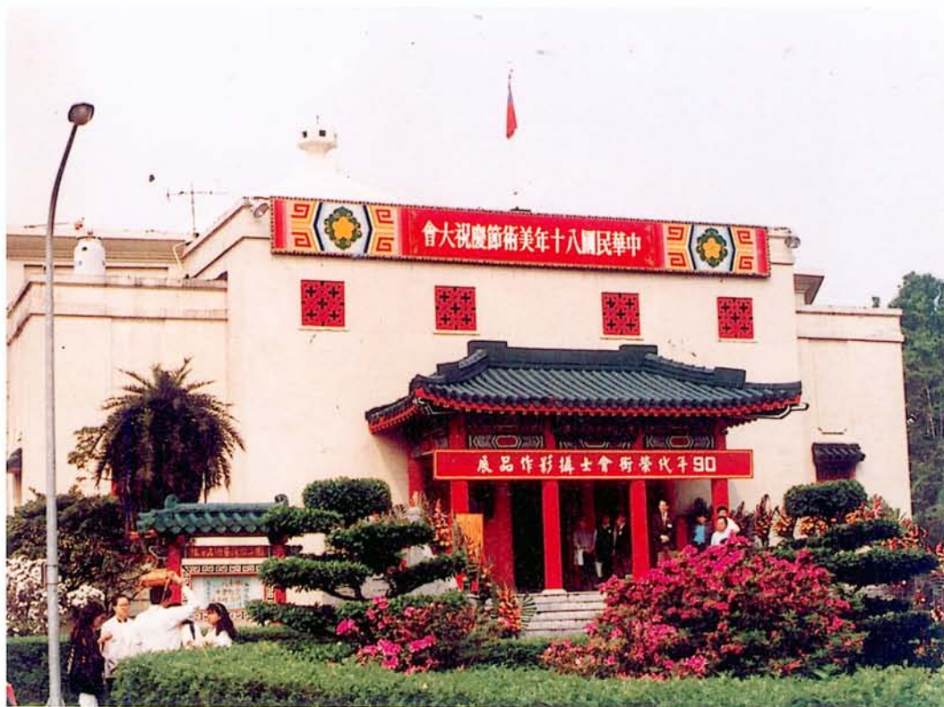
國立台灣藝術教育館外觀