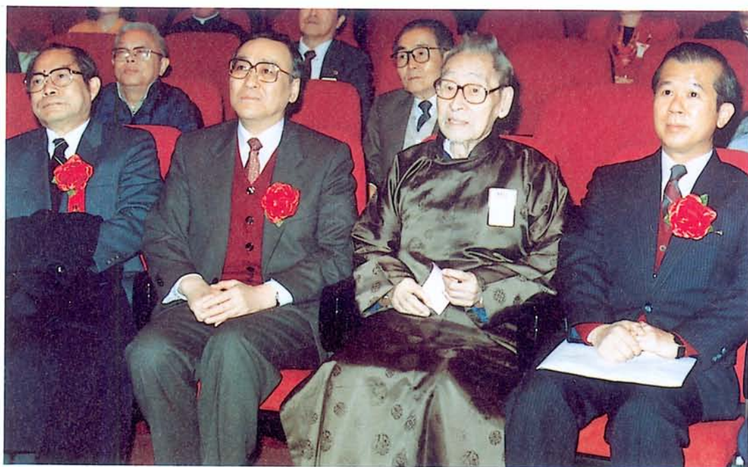
教育部毛部長高文先生蒞本館主辦藝術家春節聯誼會