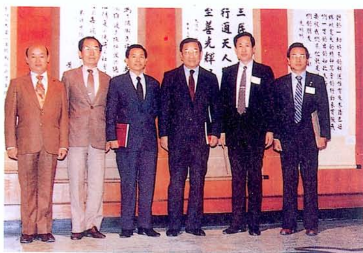
教育部李部長煥先生 蒞館巡視