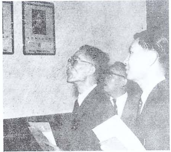
教育部梅部長貽琦先生 巡視參觀本館畫廊