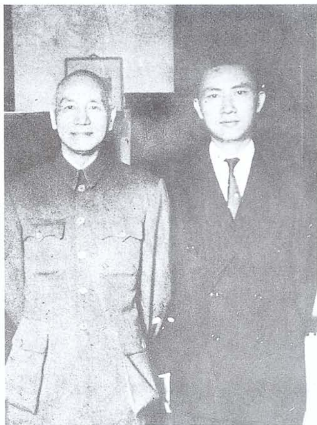
先總統 蔣公蒞臨本館與館長鄧昌國先生合影